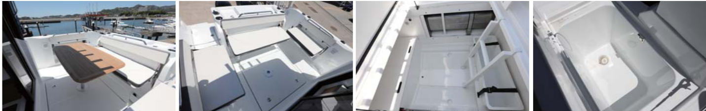
アフトデッキの中央にはテーブルも設置可。3箇所から収納式のシートを引き出せる。アフトの足元は大型の収納もできそう。右舷後方にはイケスがある。