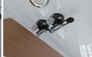
天井のアタッチメントで竿も固定できる。