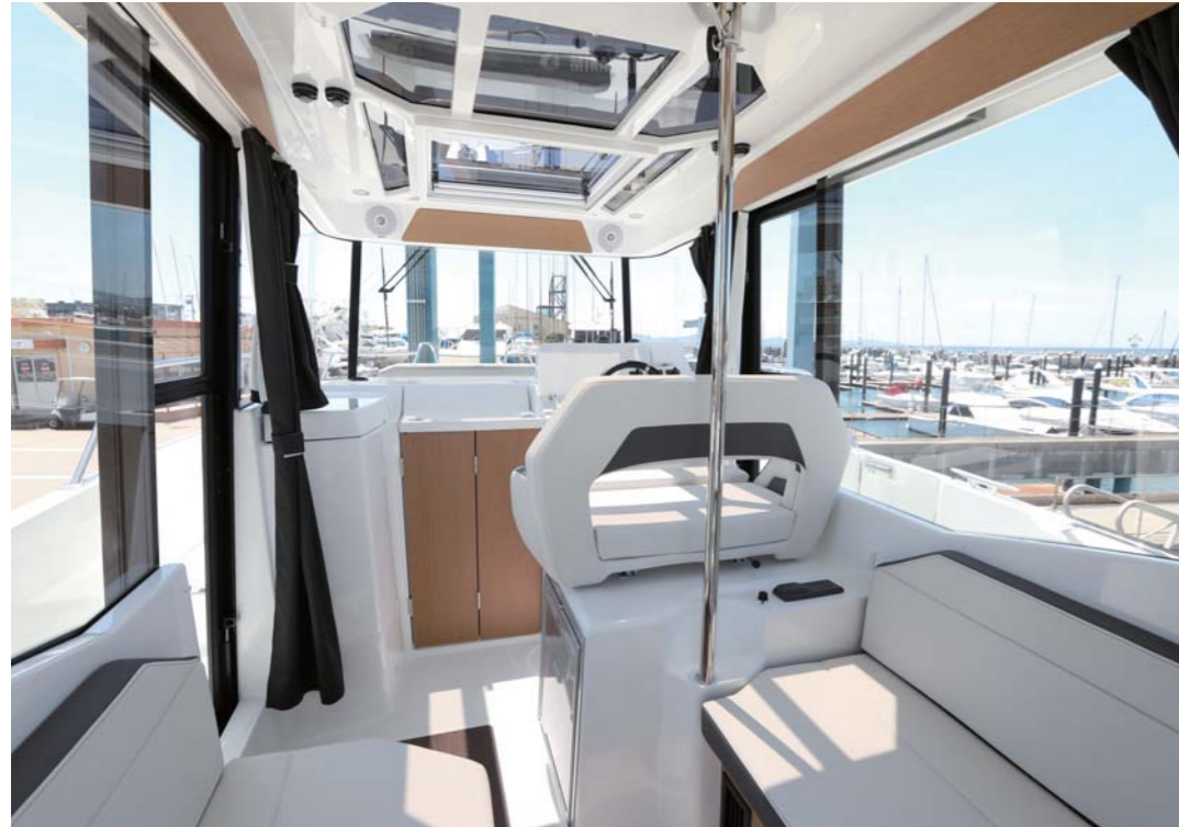
サロンは開放感抜群で、自然光もたっぷり入り、とても明るい。遮るものがほとんどなく、乗船時の視野も抜群に広い。