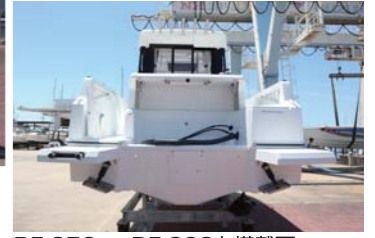
DF-250 or DF-300を搭載可。