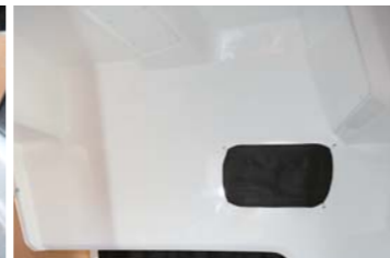
パウバースの天井高は1.65mあり、狭さを感じない。ミッドパースでも小休止できそうだ。陸電専用のエアコンも完備。

はかなり高いと思う。続いてアフトデッキをみると、収納タイプのシートが両サイドと後方に配置されており、状況に応じてレイアウトを調整できる。中央にテーブルを設置すれば、ここも歓談場所となりそう。他にも、デッキシャワーやイケス、専用のアタッチメントで取付可能なロッドホルダーもあるので、クルージングだけでなく、釣りにも高いポテンシャルを持った1艇と言えそう。ぜひ、一度チェックして欲しいと思う。