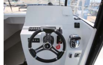
ヘルムのパネルスペースにも余裕がある。両側からデッキに出ることができる。サロン内も機能性が高く、テーブルも設置可能。スライド開閉式のハッチもある。