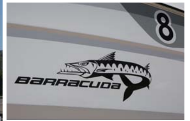
船体にはバラクーダのロゴを配置。