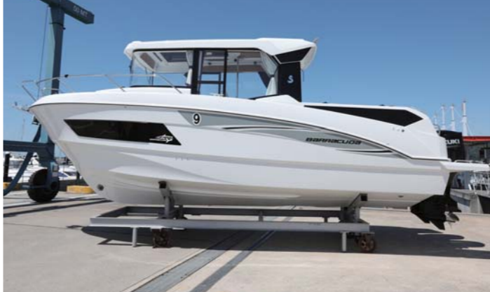
バラクーダ9はフランスの名門ボートビルダーベネテウ社が建造している。

取材協力:三河みとマリーナ 愛知県豊川市御津町御幸浜 1-1-21 TEL 0533-76-3100 URL: http://mikawamito-marina.com