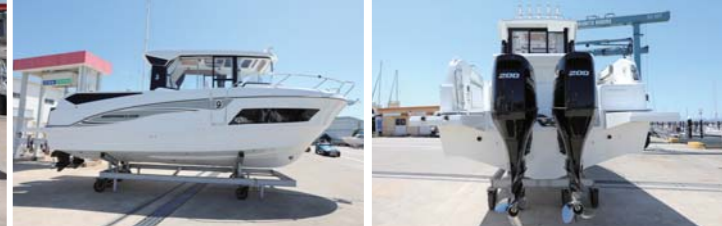
船体にはスズキ200馬力エンジンを2基搭載しており、爽快な走りを楽しめる。