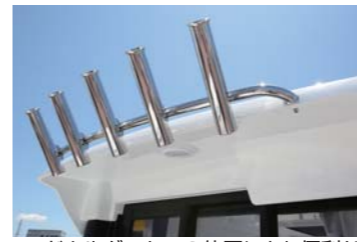
ロッドホルダーもこの位置にあり便利だ。パウバースも十分な広さを確保している。個室トイレは女性にも喜ばれそう。ヘルムシート下には冷蔵庫も完備。