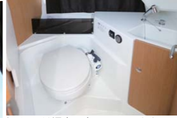
トイレには温水の出るシャワーもある。