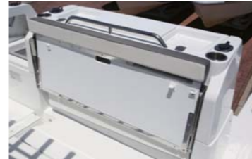
アフトシートは横長でゲストも並んで座れそう。船外機設置エリアの高さも十分確保している。右舷後方にはイケス、左舷後方にはラダーステップを装備。