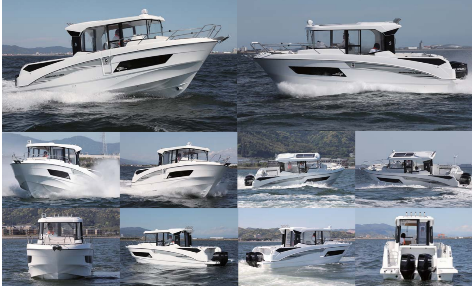
200馬力のスズキ船外機を2基搭載したバラクーダ9の乗り味は抜群だ。凌波性も良く、やや波のある海況でも30ノットオーバーの走りを披露してくれた。

取材協力:(株)ユニマツプレシヤス 舟艇販売グループ 西日本営業所 愛知県豊川市御津町御幸浜 1-1-21 TEL 0533-76-3100 URL: https://www.unimat-marine.com