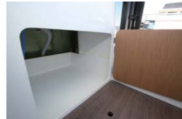
収納場所も広く確保している。2ステーションは釣りもしやすい。アフトデッキ下には燃料タンクを設置している。アフトデッキはフラットな部分も広い。