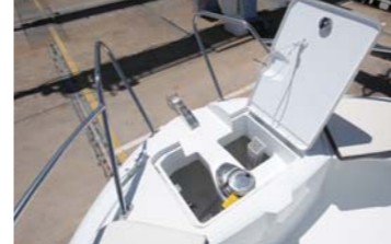
リューマーのウィンドラスを装備。パウデッキもかなり広く、3箇所シートも設置できるので、歓談場所も豊富。こちらも左右非対称だが、左舷側でも十分な広さ。