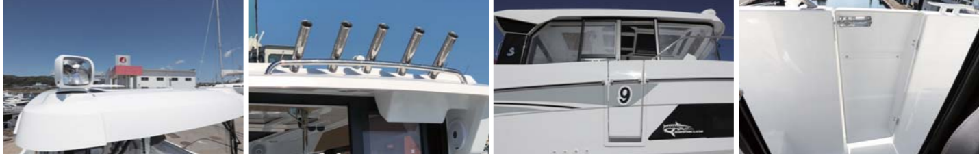
マリンコのサーチライトも装備。キャビン入口にはロッドホルダーが5つある。両サイドのウォークスルー幅は左右非対称で、右舷側が広く、扉も設置されている。