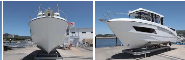
独自形状のV型ハルは高速走行時も安定性が高く、乗っていて安心感がある。