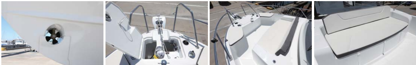
パワースターで離着岸もスムーズ。リュウマのウィンドラスも付いている。パウデッキの幅も広く、3箇所にシートを設置しているため、仲間と談笑も可能。