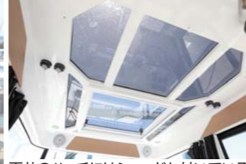
天井のハッチにはシェードも付いている。