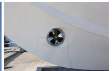
パウスラスターを装備。

全長:6.98m、全幅:2.80m、全高:2.41m、燃料タンク400L、清水タンク100L、最大搭載馬力300HP ※撮影艇にはオプションが含まれています。価格及び装備詳細は、要問合せ。