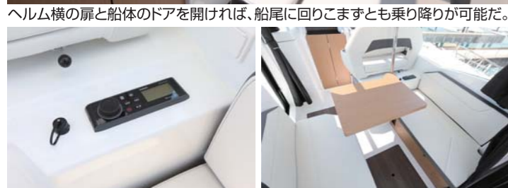
ヘルム横の扉と船体のドアを開ければ、船尾に回りこましても乗り降りが可能だ。ギャレーでは温水が使え、ガスコンロもある。ヘルムシート下には冷蔵庫を配置。

スも広く、温水シャワーやトイレ、ガスコンロに冷蔵庫、更には陸電専用エアコンもあるので、週末のマリーナステイにも十分対応してくれるだろう。ヘルムはベンチシートで、操船中の見晴らしも最高だった。サロンには左右からアクセスできるドアもそれぞれ設置され、船内の移動は本当にスムーズだった。シートの上に配置するテーブルは使用しない時は天井に固定しておくこともできるため、サロンの居住性や機能性