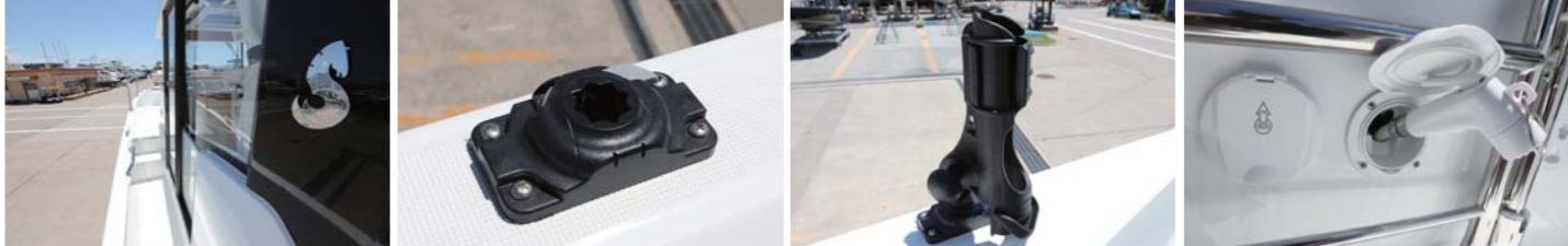
左舷でも十分な幅を確保している。このアタッチメントを配置することで、ロッドホルダーなどのギアを後付けで装備できる。左舷後方にはデッキシャワーを装備。