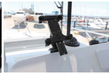
ヘルムにはGPS魚探を設置するスペースもある。スマホホルダーも取付可能。