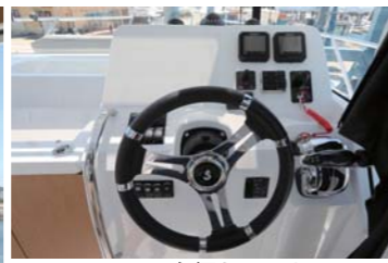
ヘルムにはGPS魚探を設置するスペースもある。スマホホルダーも取付可能。