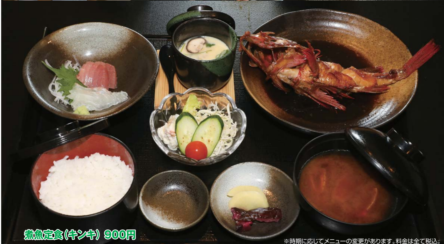
煮魚定食(キンキ) 900円