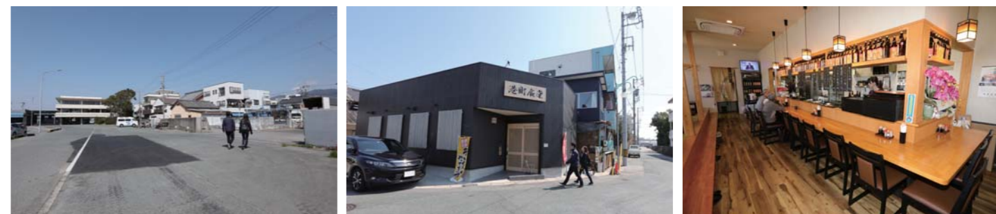
係留場所からお店には徒歩で向かうことができます。お店は黒を基調とした外観となっています。店内にはカウンター席もあり、席数も多く確保されていました。