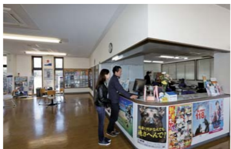
今回はスズキマリーナ三河御津から出発しました!!広い陸上ヤードには様々なボートが並んでいます。クラブハウスに入ったらまずはフロントで受付をします。