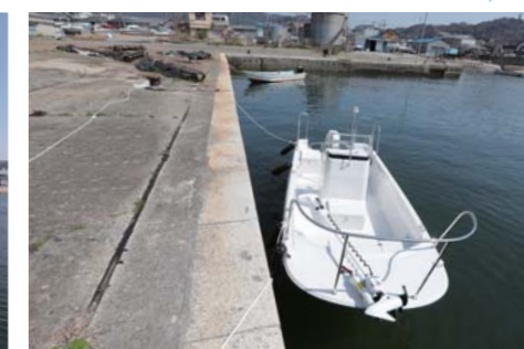
※必ず御自身で海図、GPS、魚探、天気予報等をご確認の上、安全に十分注意してお出かけ下さい。トラブル等発生致しましても当社は一切責任を負いません。