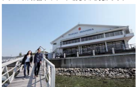
クラブハウスを出て、係留棧橋へと移動します。