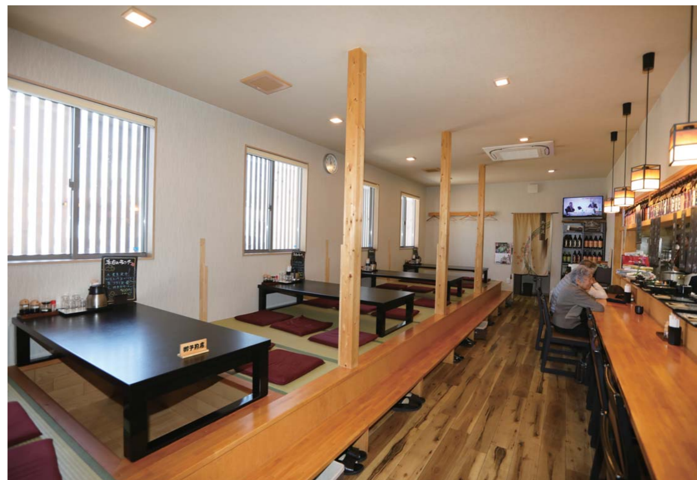
カウンター席以外にもテーブル席が多くあるので、仲間同士でクルージングに行った際のランチ場所として最適です。店内はとても清潔感がありました。