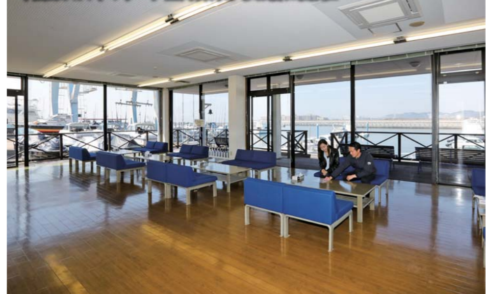
クラブハウスではボート免許、レンタルクラブ、ボート購入に関するご相談が気軽にできます。