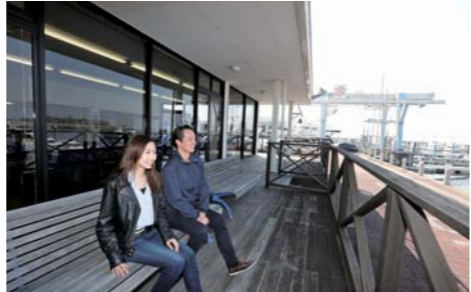
テラスでは係留中のボートを見ながら寛げます。