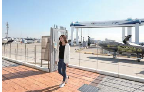
60tの大型クレーンを完備しています。