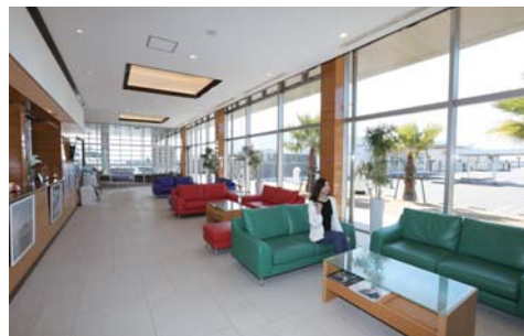
マリナラジでは落ち着いて商談もできます。また、海遊びを楽しむお洒落な大人達から今絶大な支持を集めている「ムータマリン」のショップもあります。