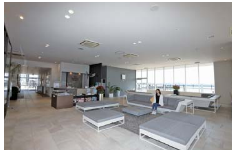
広いマリーナハウスは情報交換の場にもなります。