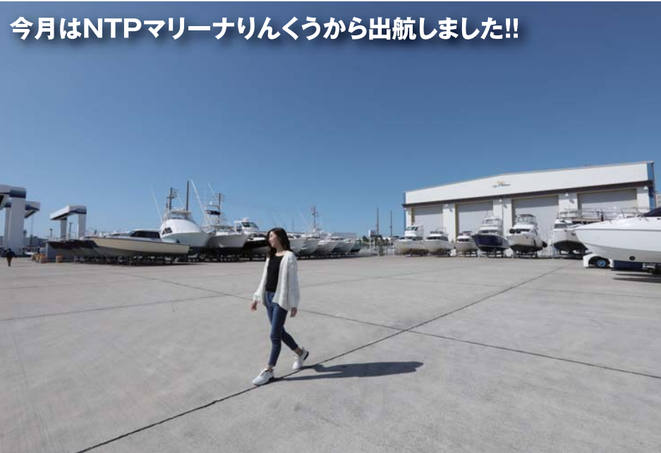
陸上にはサービスセンターがあり、70ft(24m)クラスの大型艇を4隻一度に収容できます。