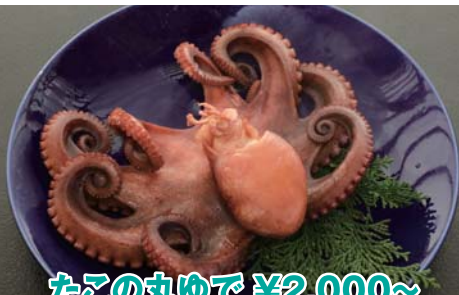
たこの丸ゆで ¥2,000~ ※大きさにより異なります。