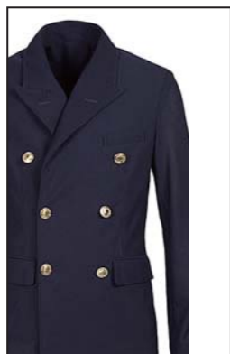
←きっかけは春夏の新定番「ストレッチメッシュシリーズ」。様々な体型にフィットするストレッチ性と快適な着心地がカジュアルやフォーマルにフィット。アスリートの体型にもフィットしやすい1枚で、色違いで購入する人も多く、春先から秋口まで着られる期間の長さもファンを増やすきっかけになっている。選手にとっても、ただ単にサイズを合わせるだけではなく、多くのシチュエーションに合わせることでできるディティールと素材感(吸汗速乾、ストレッチ素材等)がファッションを楽しむポイントになっている。【ロゴアレンジメントメッシュダブルジャケット 35,000円(+税)】