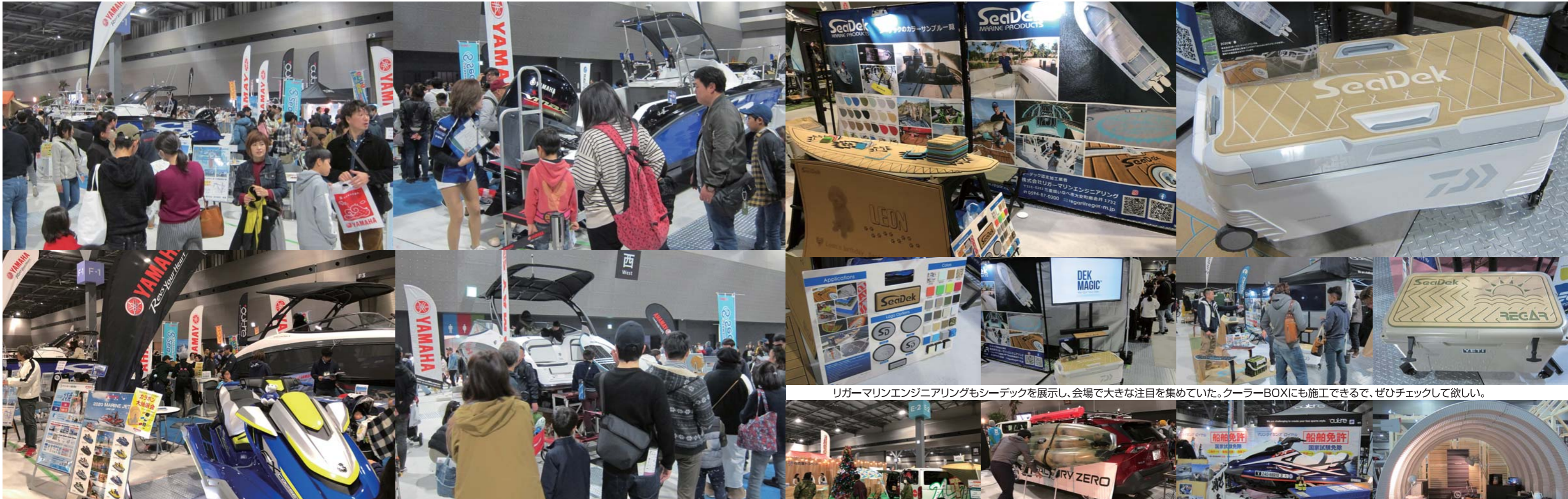
リガーマリンエンジニアリングもシーデックを展示し、会場で大きな注目を集めていた。クーラーBOXにも施工できるので、ぜひチェックして欲しい。