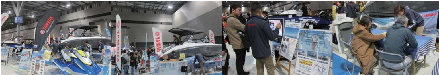
イベントにはヤマハ発動機も出展し、レンタルボートクラブ「シースタイル」の案内や「SR-X EX」をはじめとしたボートやマリンジェットの展示を行っていた。

12月7日~8日、愛知県常滑市のAICHI SKY EXPOにて、中部地区最大の遊びの祭典「FIELDSTYLE JAMBOREE」が開催された。昨年8月にオープンしたばかりの大型展示場が開催場所となった今回は開場時刻前から既に長い行列ができており、大きな賑わいを見せていた。このイベントにはヤマハ発動機やリガーマリンエンジニアリングといったマリン製品を取り扱うメーカーも出展しており、日頃からキャンプやアウトドアを楽しむ大勢の来場者に自社のマリン製品の魅力をアピールしていた。特にヤマハ発動機のブースではフィッシングボート