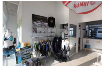
各種マリン用品の販売スペースやシャワールームも完備している。