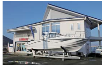
伊良湖シーサイド店の店内は清潔感のあるラグジュアリーな内装になっている。