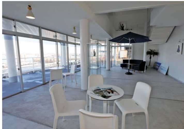
店内では海を見ながらポートや水上バイクの購入相談をすることができる。