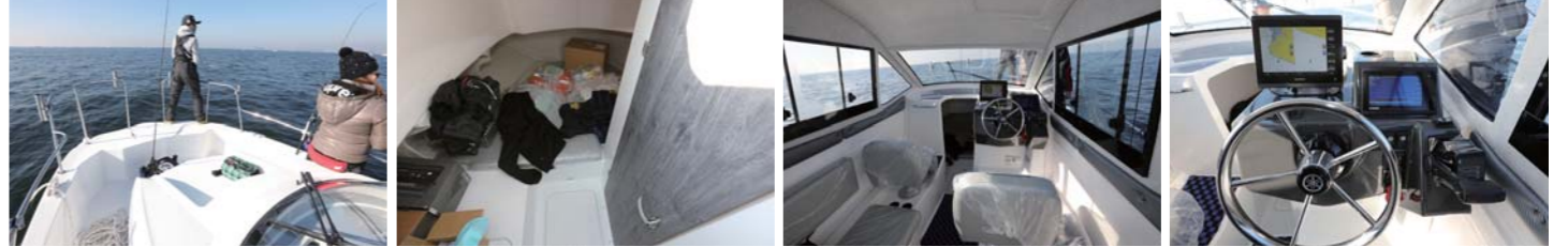
パウデッキは広く、レールも高さがある。パウバース内も広く、荷物の収納力も高い。キャビンは仲間との歓談スペースになる。ヘルムにはガーミンを装備。