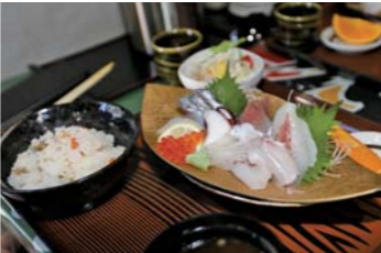
釣りの途中で帰港してランチ。ポイントが近いとこんな利点もある。「いちば食堂」愛知県田原市伊良湖町宮下3000-3 渥美魚市場 TEL:0531-35-6731