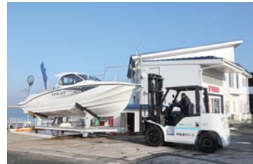
マリーナには充実した設備も整い、安全にポートを揚降してくれる。また、マリーナの前には専用の棧橋を完備している。レンタル艇(シースタイル)も大好評だ。