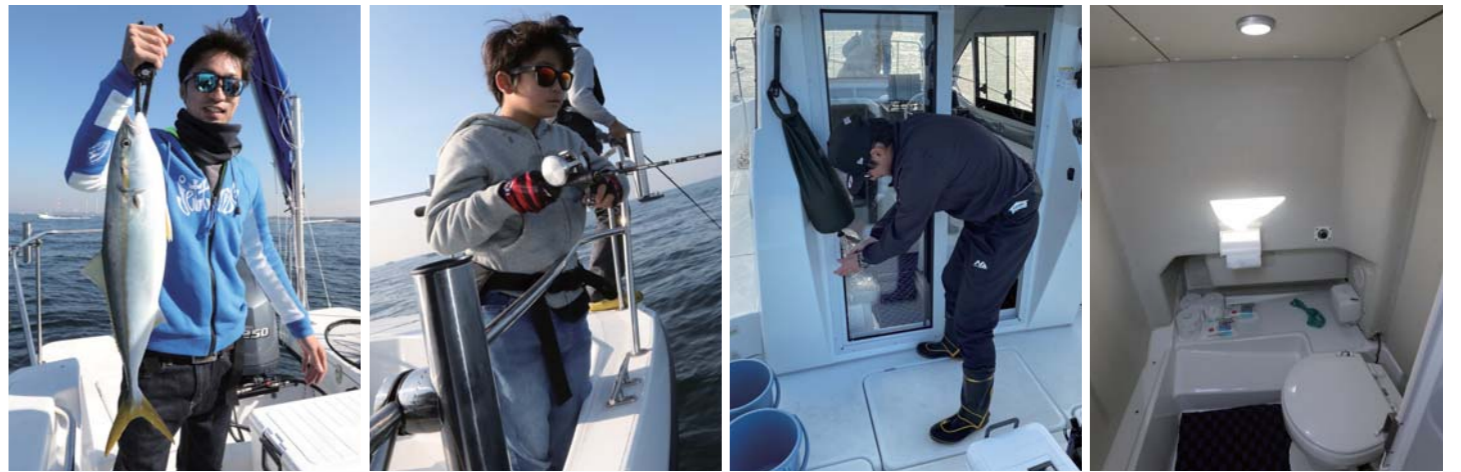
マリーナから5分の場所でワラサをゲット。パウレールがあると子供でも安心だ。デッキウォッシュ代わりの便利な袋で手を洗う。マリントイレもこの広さを確保。