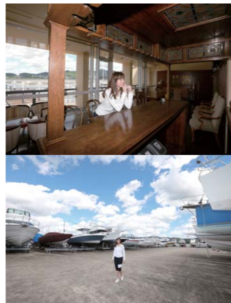
取材協力:三河みとマリーナ 愛知県豊川市御津町御幸浜1-1-21 TEL:0533-76-3100 URL: http://www.mikawamito-marina.com/web/