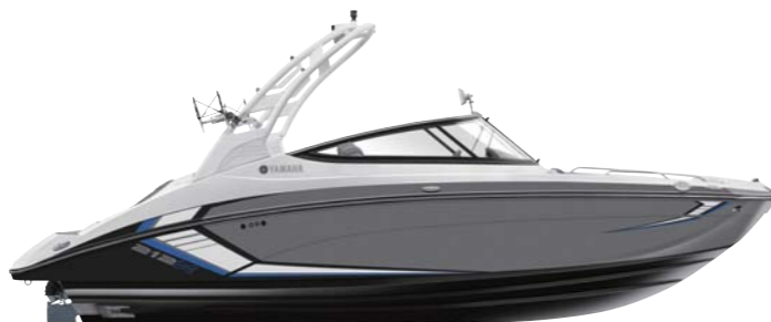
White Tower with Suede Gray