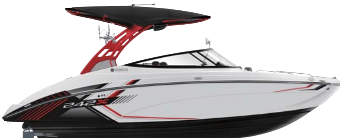
Red Tower with White