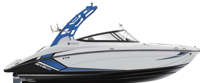
Blue Tower with White