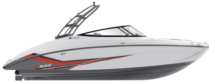
Suede Gray Tower with White