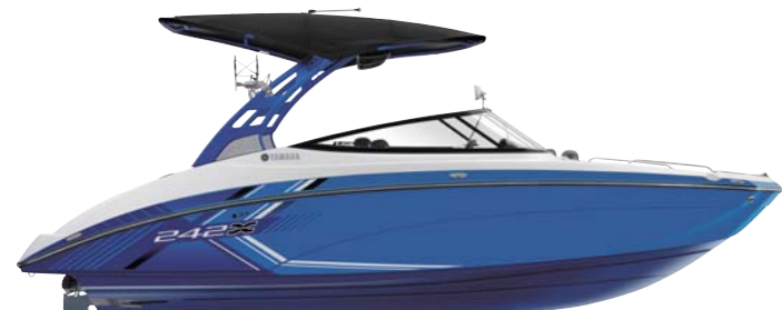
Yacht Blue Tower with Space Blue