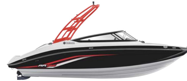
Red Tower with Black