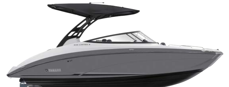
Black Tower with Suede Gray