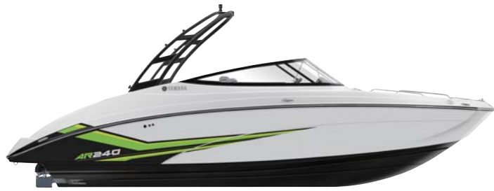
Black Tower with White