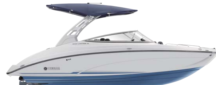
White with Slate Blue