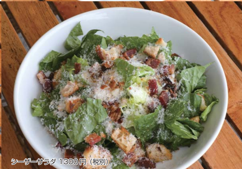
シーザーサラダ 1300円 (税別)