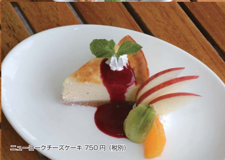
ニューヨークチーズケーキ 750円 (税別)