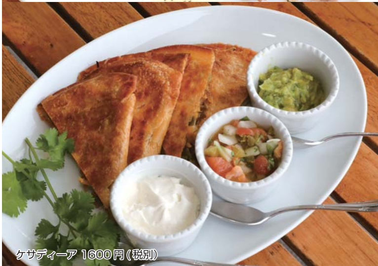
ケサディア 1600円 (税別)