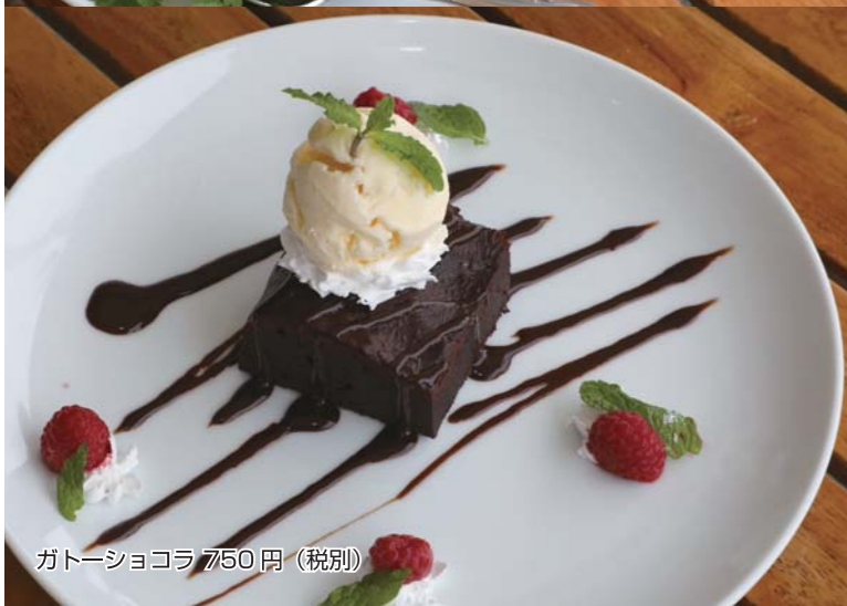
ガトーショコラ 750円 (税別)