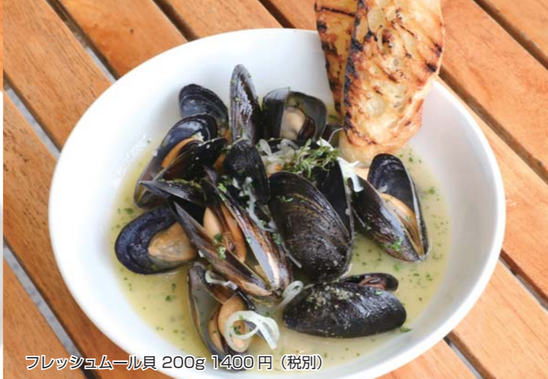
フレッシュムール貝 200g 1400円 (税別)