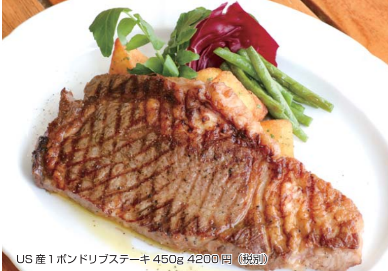
US産1ポンドリブステーキ 450g 4200円 (税別)