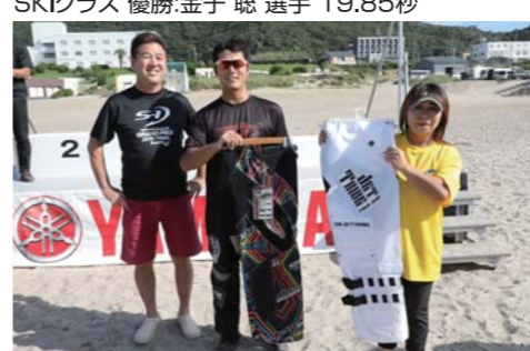
表彰式の前には全員参加のじゃんけん大会が開催され、JETTRIBEのライドパンツが登場した。