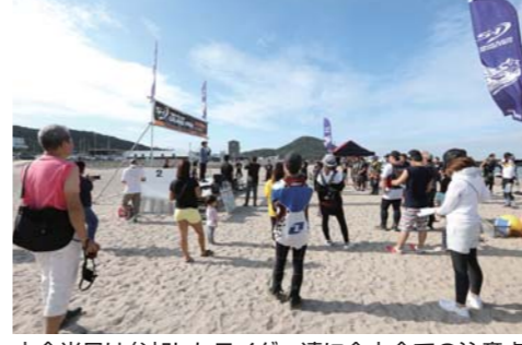
大会当日は参加したライダー達に今大会での注意点やコースの説明などが丁寧に行われていた。今大会も全国各地から多くのライダー達が遠征していた。