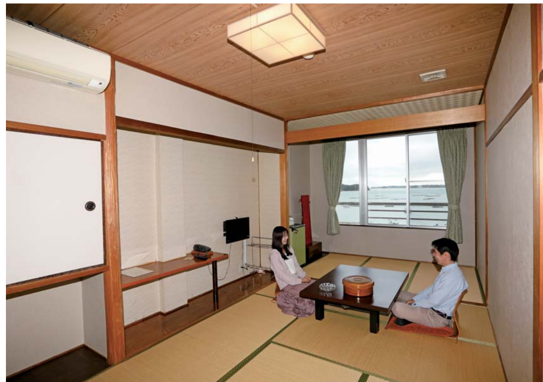
お部屋からは的矢湾が一望できて、本当に良い眺めでした。ここは泊まりでの利用もお勧めしたいお宿です。