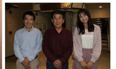
親しみやすい大将と記念撮影をしました。