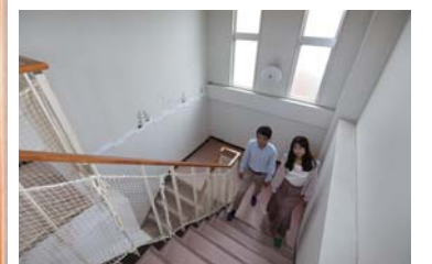
館内はとても清潔感があります。