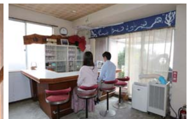
ロビーにはカウンターもあります。