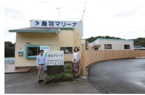
今回は鳥羽マリーナの近くのお宿をご紹介します。

※必ず御自身で海図、GPS、魚探、天気予報等をご確認の上、安全に十分注意してお出かけ下さい。トラブル等発生致しましても当社は一切責任を負いません。