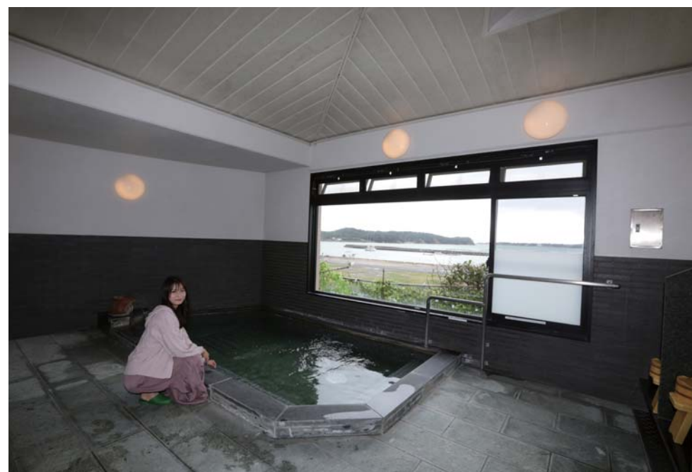
お風呂は天然温泉で、クーリングの疲れも癒してくれました。お湯も良いので何度も入りたくなります。