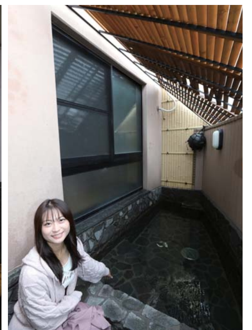
露天風呂もあるので、ゆっくりと寛げそうです。

るので、荷物が多くても安心です。お宿に到着後は早速館内の撮影に入ります。館内はとてもアットホームな雰囲気、クーリングの疲れを癒してくれます。また、清潔感もあるので、ゆっくりとリラックスして過ごすことができそうです。お部屋からは的矢湾が見えるので、宿泊の際はぜひお部屋からの眺めも楽しんで欲しいと思います。そして、お風呂は天然温泉を引いた内湯に岩の露天風呂があり、どちらもお湯の質は最高です。この時期、暖かいお風呂はクーリングで冷えた体を温めてくれます。館内の撮影後は早速料理の撮影に入ります。まずは、この名