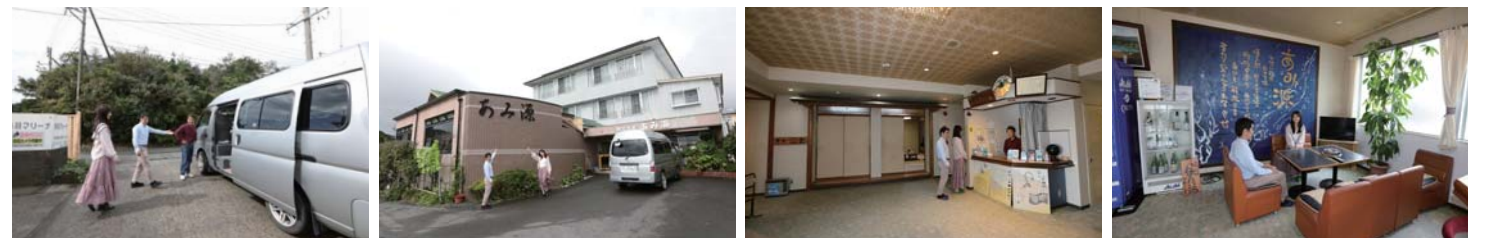
鳥羽マリーナからあみ源はお宿の送迎車に乗って行くことができます。館内はとてもアットホームな雰囲気、リラックスして過ごすことができました。

三重県鳥羽市畔蛸町186 TEL: 0599-33-6154 FAX: 0599-33-7221 URL: http://www.amigen.jp