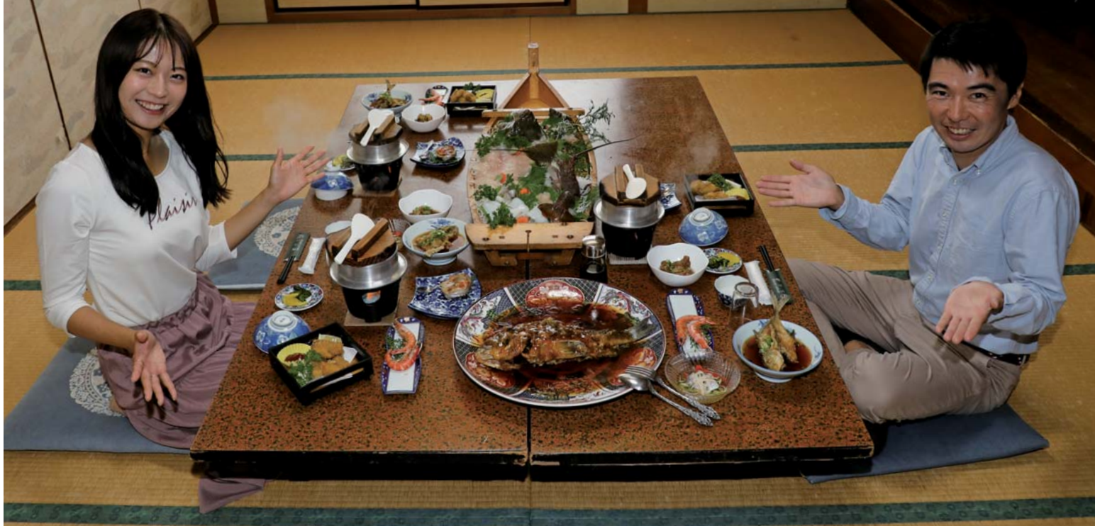
スペシャルサンクス:南鳥羽 あみ源 大将 女将さん、鳥羽マリーナ 木俣 裕樹 さん、モデル/岡本 桃香、text/photo:編集部