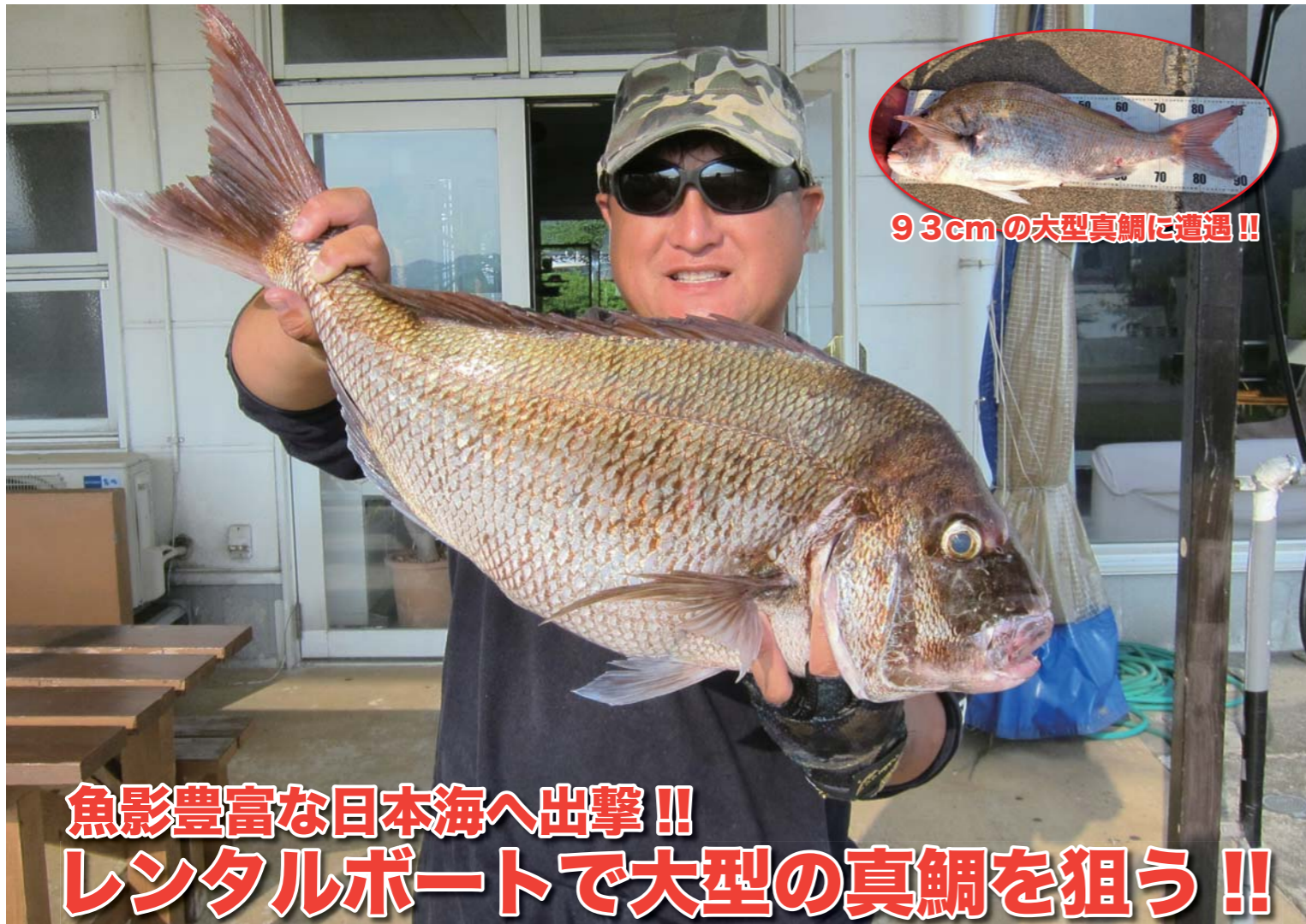
93cmの大型真鯛に遭遇!!