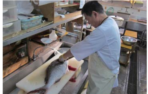
社長のタックルBOXは約15kg!! ジグやタイラバには拘りがあり、どんな海況でも瞬時に対応する。釣った魚をレストランの料理人が捌くサービスも人気(有料)。