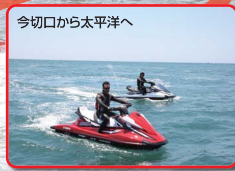
今切口から太平洋へ