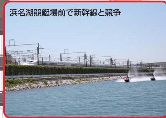
浜名湖競艇場前で新幹線と競争

※最初にマリーナでローカルルールや浅いエリアの説明を受ける。マリーナには充実した設備が整っている。