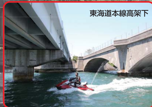
東海道本線高架下

浜名湖を走る時には通行届出書をお忘れなく!! ※書類に記入し、講習を受け8,000円を支払うと、記入した日から乗れる。(2年間有効)