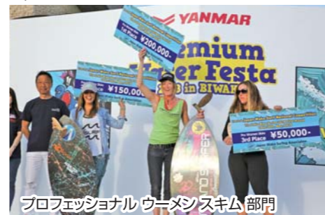
プロフェッショナル ウェーメンスキム 部門