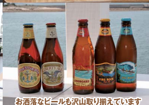
お洒落なビールも沢山取り揃えています