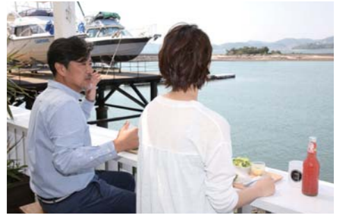
メニューは厳選され、どれもお勧めしたいものばかりです。シーサイドテラスでは海やポートを眺められるだけでなく、爽やかな風を浴びながら食事を楽しめます。

できます。営業日は基本土日祝日ですが、ご来店の際は前日までにお電話で営業有無を確認しておくとも良いと思います。店内はどこを見てもお洒落な空間に仕上がっており、ゲストを連れて来て嬉しく喜んで貰えると思います。そして、ここからは食事のご紹介ですが、今回は2種類のベーグルサンドのランチプレートとふわふわのマフィンを出して頂きました。特殊製法により作られるベーグルはランチでは3種類の中から選択が可能で、もちもちとした食感が楽しめるのが特徴です。ベーグルには特に拘っており、水を一切使わず、オレンジジュースとオレンジピールを練りこんだベーグルも用意されていました。ランチプレートではこのふわもち食感のベーグルにスモークチキンやスモークサーモン等をサ ンドして提供してくれるのですが、これが本当に美味しいんです!!ここにサラダとスープも付くので、食べ応えも十分でした。他にもふわふわのマフィンにはサービスでクッキーが付く時もあり、お腹があまり減っていない時にはマフィン2つとドリンクのセットもあるので、こちらがお勧めです。GWからはスムージーも開始予定なので、こちらでも人気を集めそうですね。ベーグルにサンドする食材はシーズン毎に変わる予定なので、何度か通っても違う味が楽しめるのもポイントが高いと思いました。今回のグルメクルージングでは海の見えるテラス席で絶品のもちもちベーグルサンドが食べられる「1963 OCEAN LOUNGE」をご紹介しました。ぜひ皆さんでクルージングの途中に食べに行ってくださいね!!