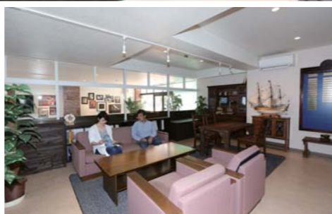
クラシカルな雰囲気、居心地の良いマリーナです。