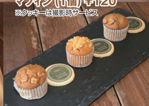
マフィン (1個) ¥120 ※クッキーは撮影時サービス