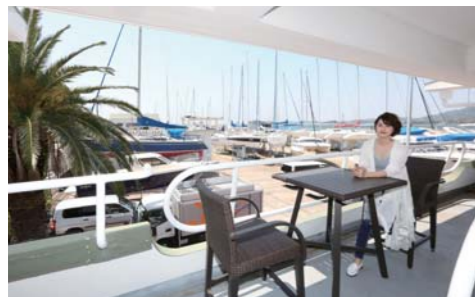
2Fにも寛げるスペースがあります。他にも全天候型のBBQスペースやジム「OCEAN FITNESS」もあり、マリンスポーツのオフトレーニングも可能です。