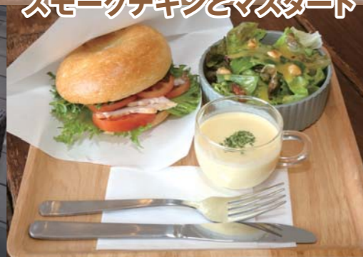
ランチプレート ¥1,000 スモークチキンとマスタード