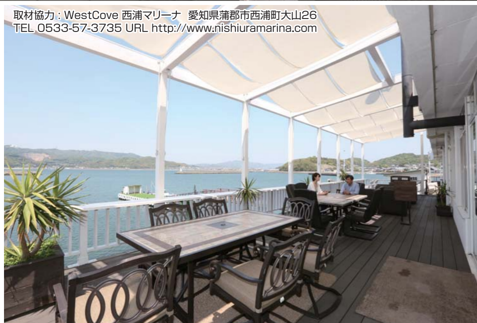
シーサイドデッキでは目の前に広がる海を見ながら、のんびりとした時間を過ごすことができます。

取材協力: WestCove 西浦マリーナ 愛知県蒲郡市西浦町大山26 TEL 0533-57-3735 URL http://www.nishiuramarina.com