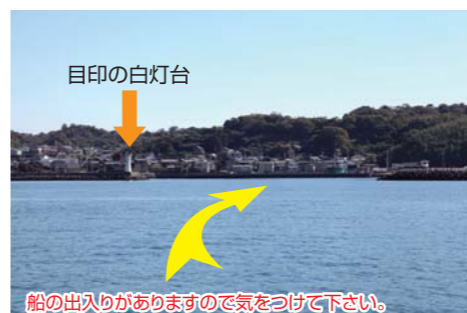
船の出入りがありますので気をつけて下さい。