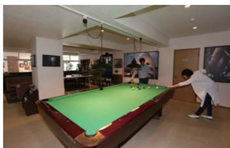
オーナーズサロンではビリヤードも楽しめます。