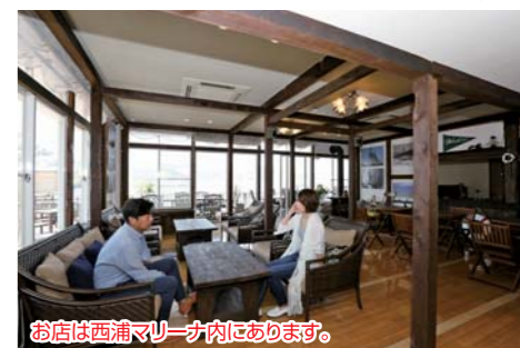
お店は西浦マリーナ内にあります。

※必ず御自身で海図、GPS、魚探、天気予報等をご確認の上、安全に十分注意してお出かけ下さい。トラブル等発生致しましても当社は一切責任を負いません。