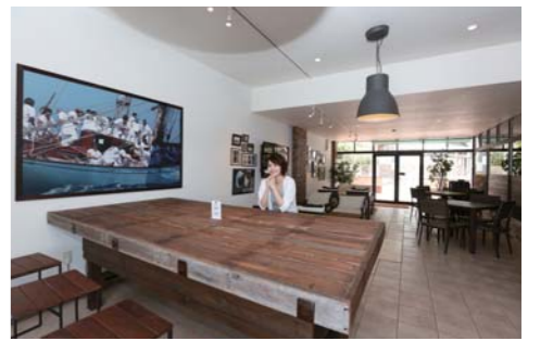
エントランスにはウッドベンチがあり、ここで休憩もできます。店内の壁にはお洒落な絵画や美しい写真が飾っており、どれを見ても、とても見応えがありました。