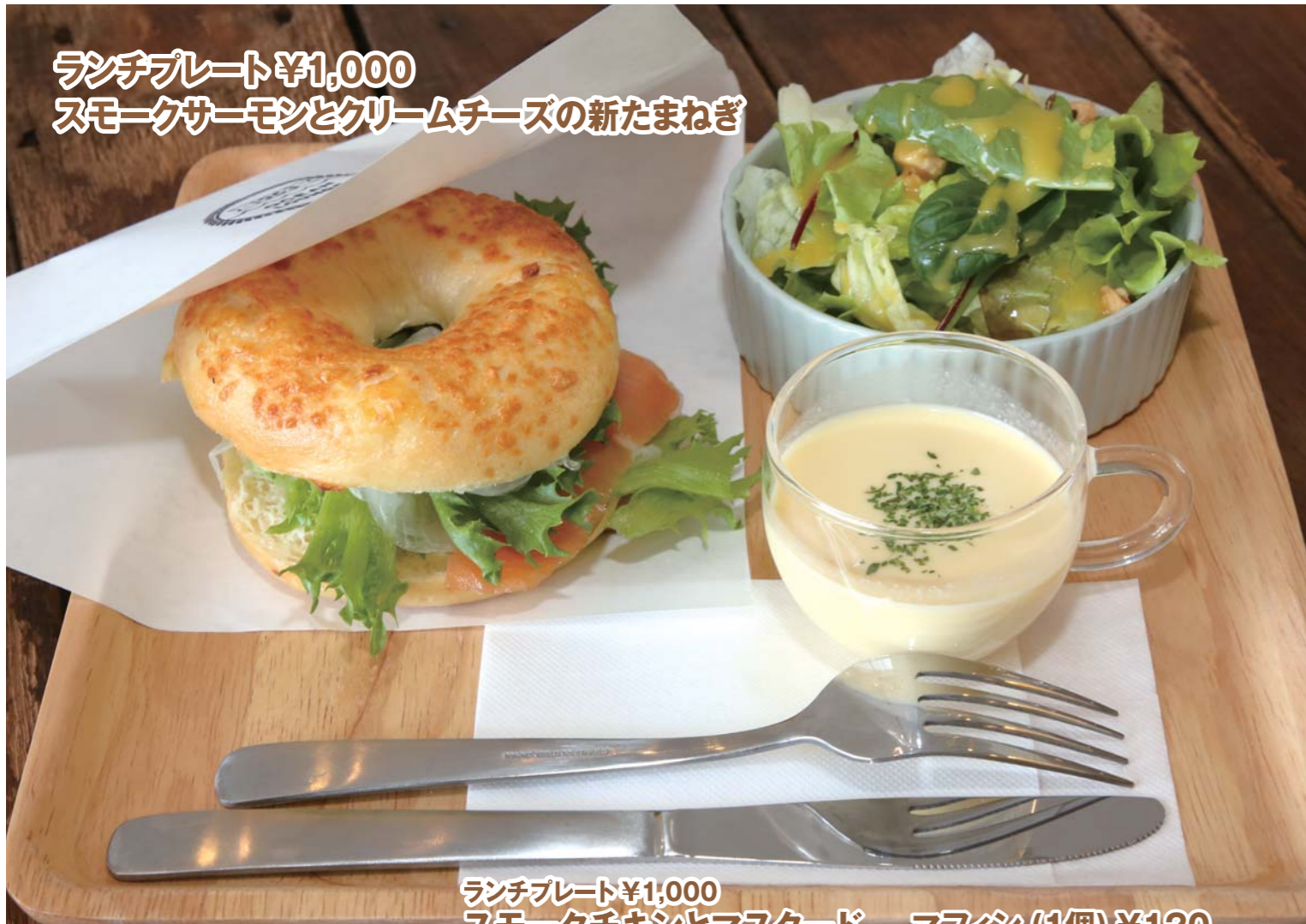
ランチプレート ¥1,000 スモークサーモンとクリームチーズの新たまねぎ