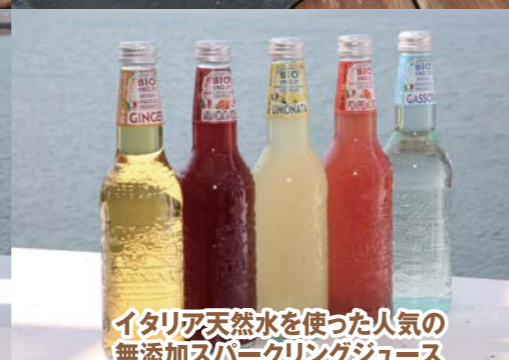
イタリア天然水を使った人気の無添加スパークリングジュース