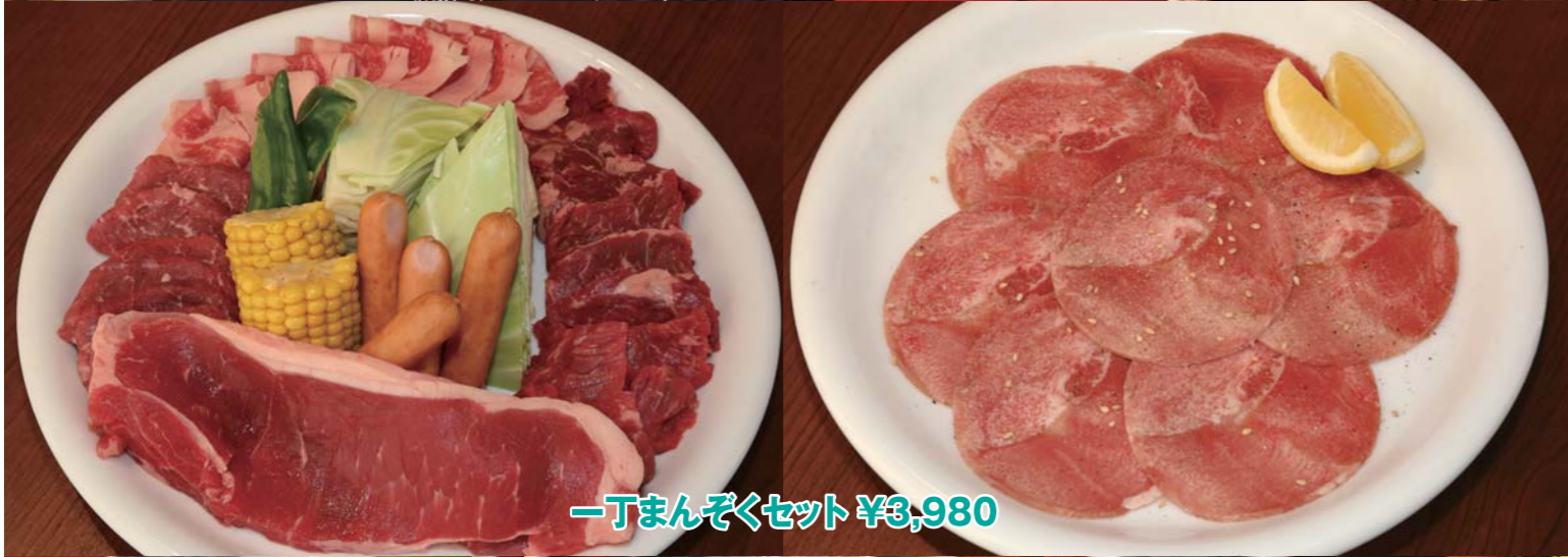
一丁まんぞくセット ¥3,980

店内は清潔感があってとても綺麗です。土日祝日は11:30から営業しているので、名古屋ポートショーの帰りにお肉を食べに行くのもアリですね!!