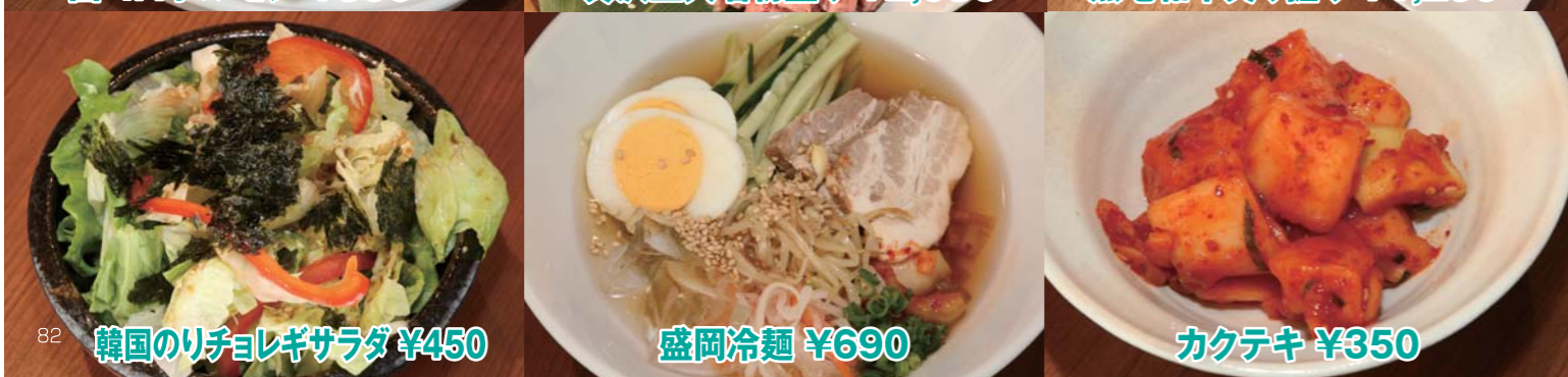
韓国のリチョレギサラダ ¥450