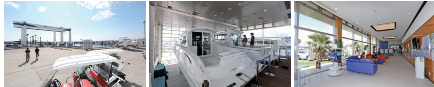
今回はNTPマリーナりんくうから出発!!マリーナには60tの大型クレーン、屋内展示エリア、マリンプラザなどがあり、このエリアでも屈指の規模を誇ります。