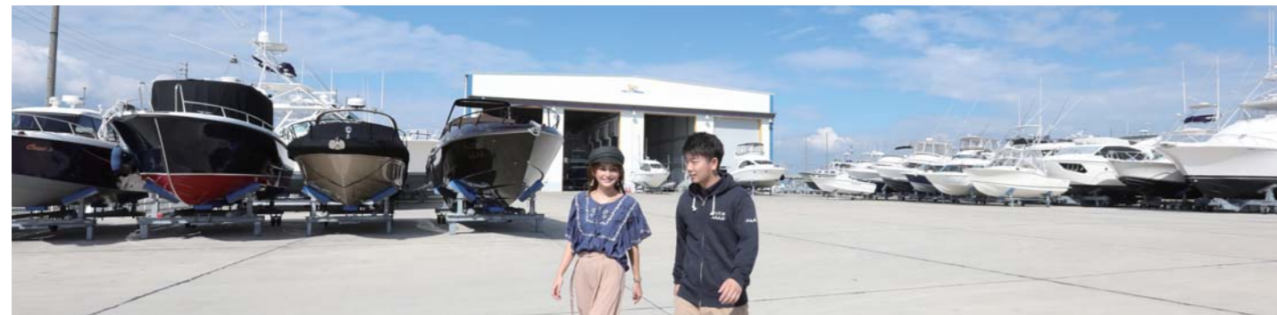
陸上ヤードには輸入艇～国産艇まで、様々なタイプのボートが並んでいます。サービスセンターでは70ftの大型艇を一度に4隻まで収容可能です。

※航行区域は時期によってカキ棚や釣筏が沢山入っています。航行の際は徐行して十分注意して下さい。