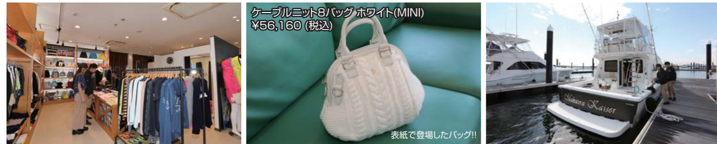
ケーブルニット8バッグ ホワイト(MINI) ¥56,160 (税込)