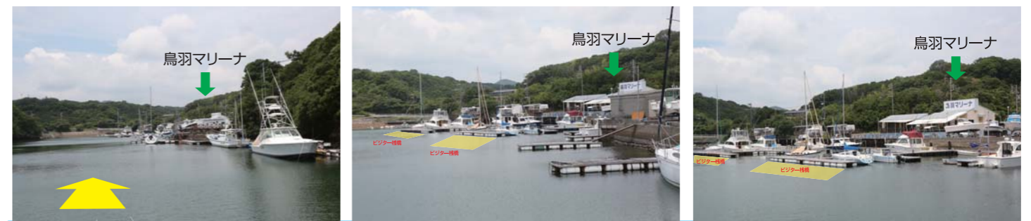
*必ず御自身で海図、GPS、魚探、天気予報等をご確認の上、安全に十分注意してお出かけ下さい。トラブル等発生致しましても当社は一切責任を負いません。