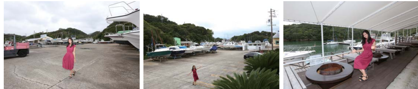
マリーナには様々なタイプのポートやヨットが艇置されており、ここを拠点に快適なマリンライフを楽しんでいます。テラスからは美しい湾内の景色が見えます。