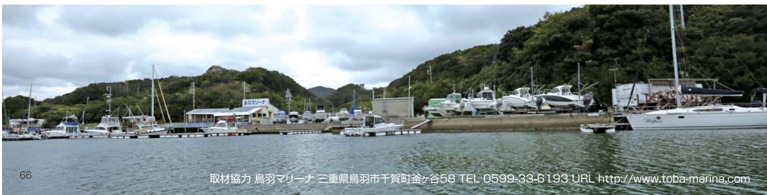
取材協力 鳥羽マリーナ 三重県鳥羽市千賀町釜ヶ谷58 TEL 0599-33-6193 URL http://www.toba-marina.com