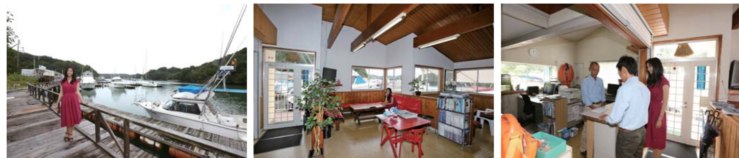
鳥羽マリーナは南鳥羽的矢湾(伊勢志摩国立公園内)にあり、クルージング、ポートフィッシング、トローリングが楽しめる絶好のロケーションに位置しています。