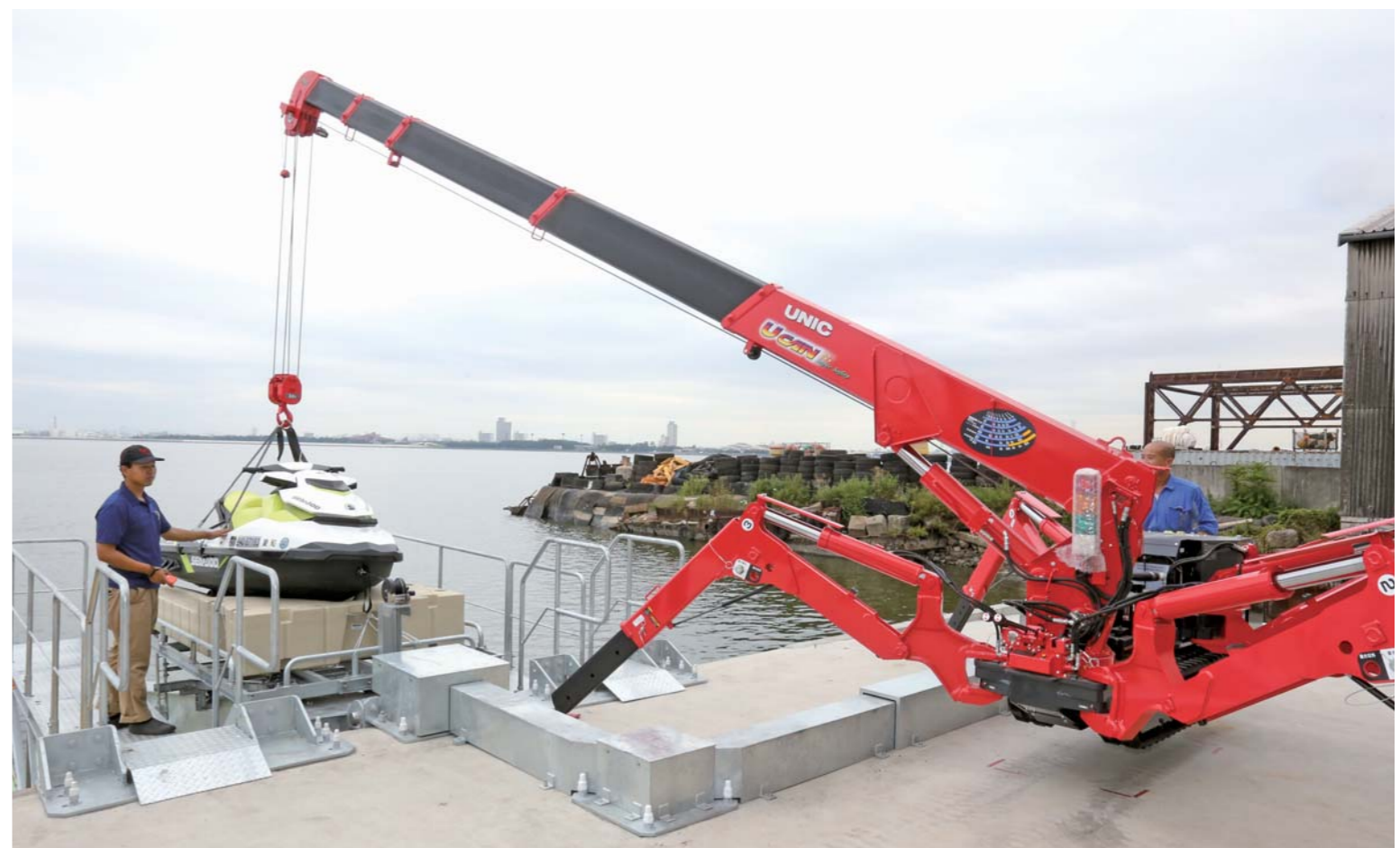
取材協力:水上バイク専用 飛島マリンベース TEL:0567-55-2888 URL: http://tobishima-marine.com 定休日:火曜日 営業時間8:30~17:00