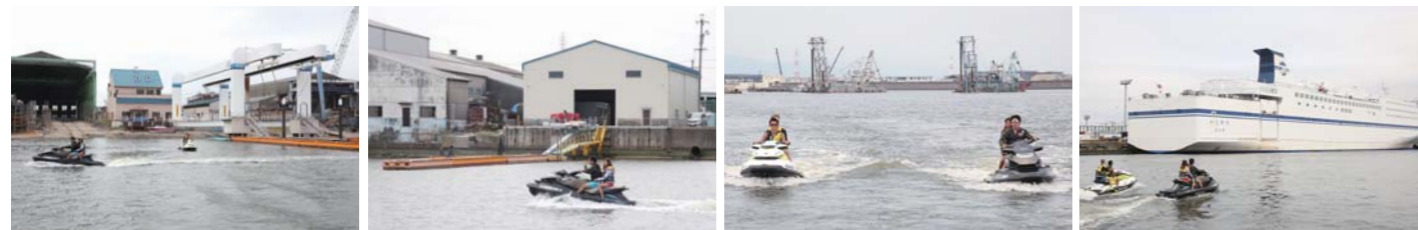
飛島マリンベースは伊勢湾陸運(株)飛島マリンが運営しており、名古屋港やセントレアへのツーリングを楽しめる。目の前の名古屋港エリアには見所が多数ある。

※金額は税別、入会金30,000円(初年度のみ)、年会費12,000円、揚降料2,500円、その他施設利用料等あり。 ※ピジター料金 艇置登録料10,000円(初回のみ)、揚降料4,500円、その他施設利用料等あり。 ※金額及び詳細は飛島マリンベース料金表の通り。屋内プレミアムの詳細はお問合せ下さい。