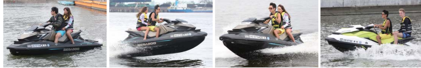
名古屋港周遊ツーリングは比較的近場に見所が固まっているので、初心者の方でも安心して楽しめるだろう。港内で操船スキルを身につけるのもアリだ。

びており、安心して水上バイクに乗り降りも可能だ。飛島マリンベースのある飛島エリアは名古屋港ツーリングやセントレアツーリングの拠点としても絶好のポジションに位置しており、ここを拠点に様々な場所へのツーリングも楽しめそうである。名古屋港エリアは名港トリトンを筆頭に名古屋港水族館やポートビルといった見所が沢山あるエリアなので、ぜひツーリングで楽しんでもらいたい場所の一つだ。撮影当日は