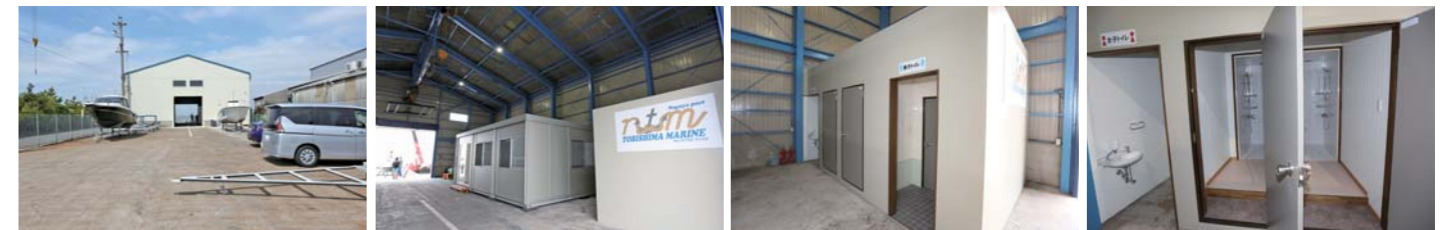
陸上でも水上バイクの保管が可能。庫内には事務所エリアも確保されている。男女別のトイレやシャワーを完備しており、海から上がった後は潮も落とせる。

港内は非常に穏やかな水面で、水上バイクを楽しむにはもってこいのコンディションであった。飛島マリンベースでは経験豊富なスタッフも在籍しており、ツーリングポイントやゲレンデの注意点も親切丁寧に教えてくれるため、初心者のライダー達でも安心して水上バイクを楽しめる。また、名古屋港内であれば、飛島マリンベースからスグ近くなので、マシンに何かあった時でも安心だ。水上バイクの保管形態は艇置