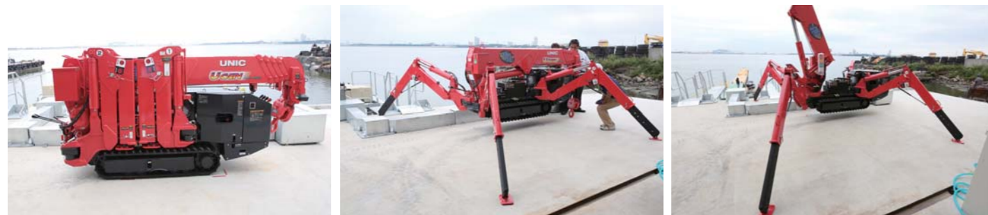
水上バイクの揚降で活躍するのが、こちらのクレーンだ。キャタピラで移動が可能で、ポジションを決めると4本の脚が広がりクレーンを支える仕組みだ。

飛島マリンに新展開だ。愛知県海部郡にある飛島マリンを運営する伊勢湾陸運が「水上バイク専用 飛島マリンベース」をスタートさせた。ここは名古屋市内からも抜群のアクセスを誇る同マリーナと同じ道沿いにあり、水上バイク専用エリアとなっている。船台での保管はもちろん、トレーラーごと保管できるプランもあるため、多くのライダー達から重宝される水上バイクの拠点となりそうだ。飛島マリンベース内には揚降専用のクレーンやオリジナルのスロープも用意されており、オーナー艇を安全かつ丁寧に揚降してくれる。スロープに沿って棧橋も伸