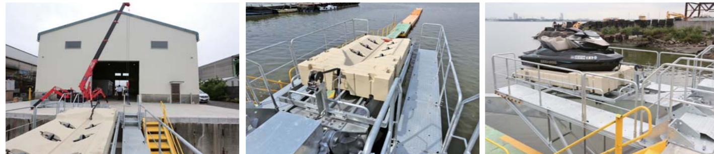
頑丈にできたオリジナルのスロープを完備しているので、クレーンで吊った後はこちらのスロープに乗せて、水上バイクを1艇ずつ丁寧に揚降してくれる。