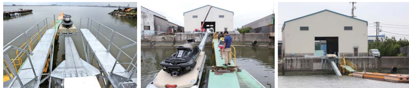
名古屋市内からのアクセスも抜群で、ビジター揚降にも対応可能だ。スロープに沿って棧橋も完備されているので、水上バイクの乗り降りも非常にスムーズだ。