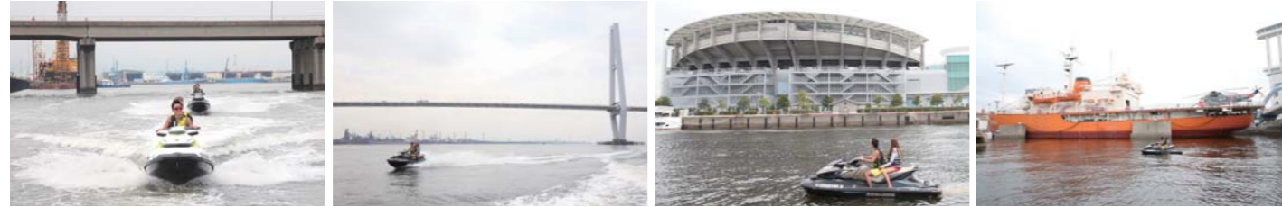
港内は波も穏やかで水上バイクでも本当に走りやすい。名港トリトンや名古屋港水族館にも、気軽に水上バイクで行ける。「南極観測船ふじ」も見ることができた。