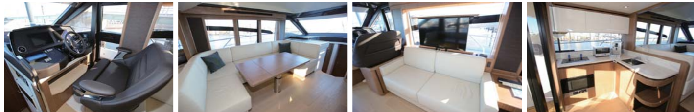
また、サロンには機能性の高いヘルムを設置。他にもソファ、テーブル、TV、ギャレー(大型の冷蔵庫、電子レンジ、食洗機付き)が付いており、居住性も抜群だ。

も高い走行性能を持っており、最高速度は34ノット(2950回転)を記録。カタログ数値ではクルージングスピード25ノットで燃費は165L/hとなっており、燃費面も良好な数値となっている。居住性についても見ていくと、見晴らしの良いフライブリッジにはヘルム、前方にはサンパッド、右舷側にBBQグリル、左舷側にソファ&テーブルが配置され、景色と軽食を同時に楽しめる。ステップを降りるとコックピットエリアになっており、ここにもソファ&テーブルを配置。後方のスイムプラットフォームにもBBQグリルがあり、ここでもBBQが楽しめる。サロン内には対面のソファ、テーブル、テレビ、更には本格的なギャレーを