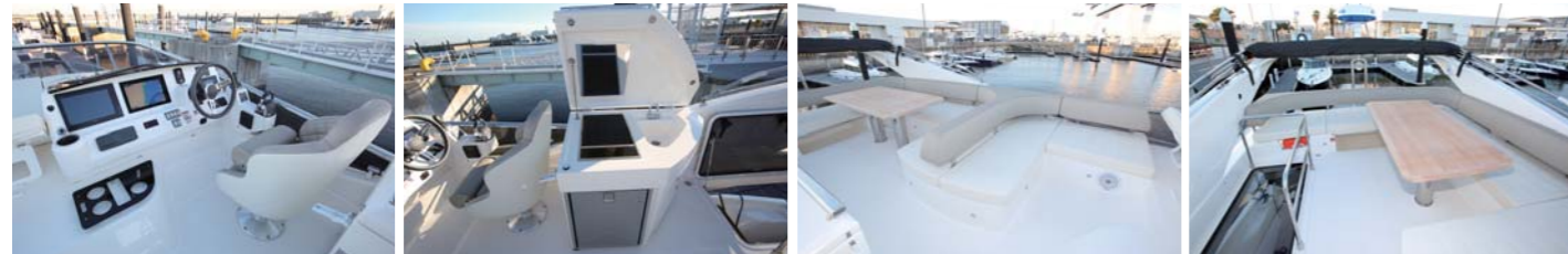
フライブリッジにはヘルムやBBQグリルを配置。また、ソファや大きめのテーブルも装備されているので、ここで食事を楽しんでも良いだろう。