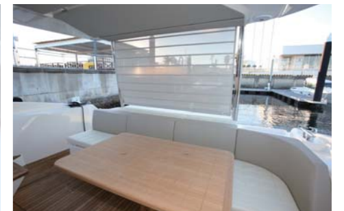
後方部にはシェードも付いており、日差しもカット。