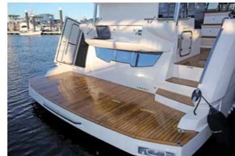
スイムプラットフォームもワイドで機能性が高い。ここにもBBQグリルがあるので、手軽にBBQを楽しめる。エンジンはVolvo Penta IPS600-D6を2基装備。