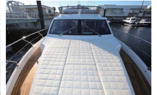
バウにあるサンパッド。この広さには驚きた。