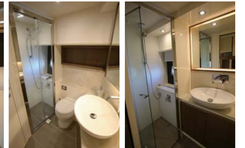
フォワードキャビンにもダブルベッドを用意。ミッドバースにはツインベッドを設置。オーナーとゲストでシャワー&トイレエリアを分けており、プライバシーも守る。

ABSOLUTE 52 FLY 全長 16.00m 全幅 4.46m 燃料容量 1,600L 清水容量 450L 定員 14名 最高出力 435HP×2 エンジン Volvo Penta IPS600-D6×2基 ※オプション等の詳細はお問合せ下さい。