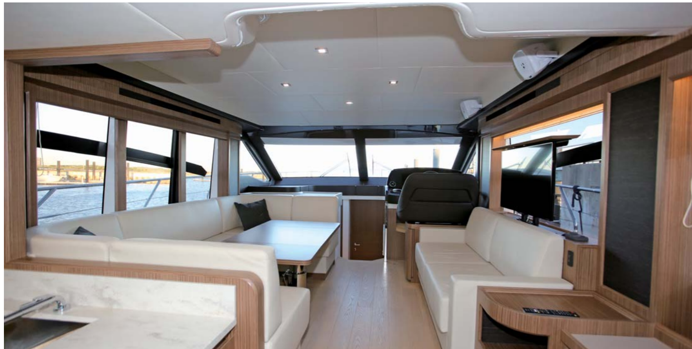
サロンはラグジュアリーな空間に演出されており、オーナーやゲストを気持ち良く迎え入れてくれる。船内にいる事を一瞬忘れそうになる高いクオリティだ。