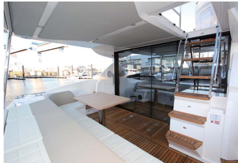
チークデッキのコックピットにはソファやテーブルもあり、ここも歓談スペースとして使えそう。

完備し、ここでも優雅な時間を過ごせそう。サロンからマスターキャビンへ入ると、ここは一流のホテルでのステイを感じさせてくれるラグジュアリーな空間になっており、専用のシャワー&トイレも完備されている。更には豪華なフォワードキャビンには大きなダブルベッドが用意され、ミッドバースにもツインベッドがある。ABSOLUTE 52 FLYは洗練されたデザインと高い走行性能を持ち合わせた高品質のイタリアンクルーザーと言えます。アブソリュートは今年9月開催のキャンボートショーのワールドプレミアで新たに58FLYと73NAVETTAの発表も控えており、今後も世界で高い注目を集めそう。