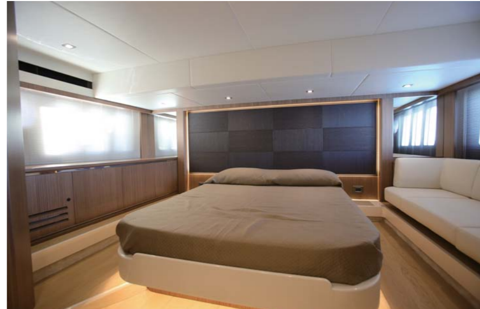
マスターキャビンには大きなダブルベッド、ソファ、収納スペースがあり、スイートルームの客室のような洗練された高いクオリティを感じさせてくれる。