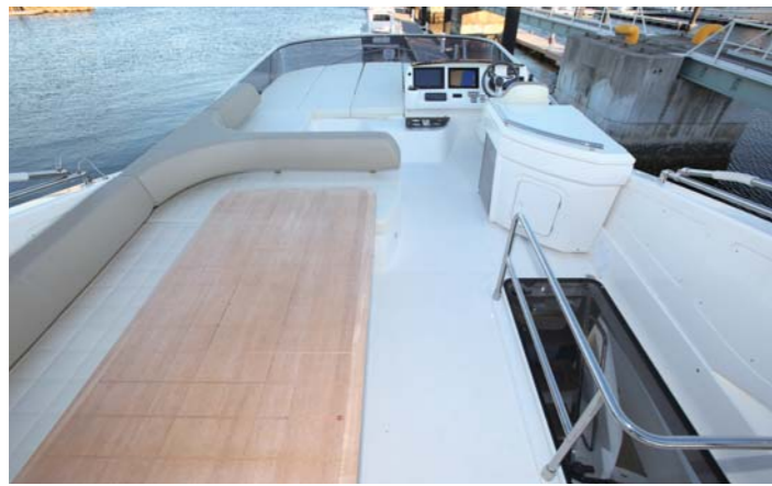
フライブリッジは長さ幅が十分に確保されており、最大8名が寛げるとも広い空間となっている。サンパッドエリアも広く、仲間同士でも十分寛げる。