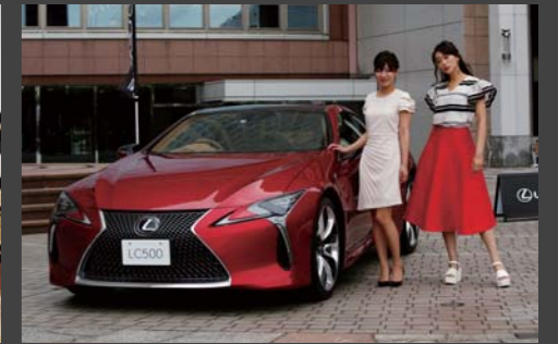
懇親会では記者に対して、レクサスサポートのブランドコンセプトや今後のビジョンが説明されていた。会場ではレクサスLC500の展示も行われ、高い注目を集めた。 取材協力:トヨタ自動車株式会社 マリン事業室 愛知県蒲郡市海陽町2-1 TEL 0120-532-451 URL http://www.toyota.co.jp/marine/