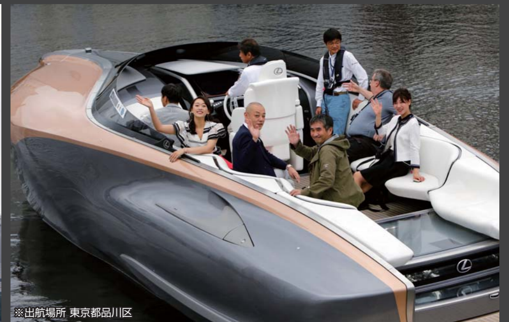
※出航場所 東京都品川区