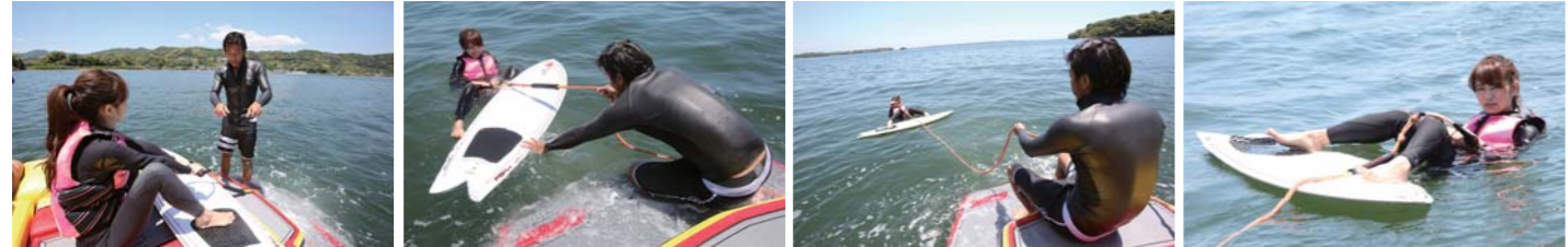
ベルマリンの体験スクールでは今人気爆発中のウェイクサーフィンも体験する事が可能!!経験豊富なインストラクターがおり、女性も安心してチャレンジできる。

取材協力 ベルマリン株式会社 静岡県湖西市利木482 TEL 053-578-3210 URL http://bellmarine.co.jp