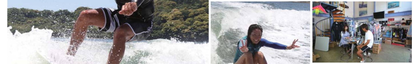
マリッジャー全般の相談も可能だ。