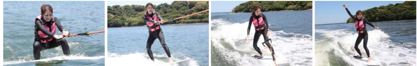
一通りレクチャーを受けたら早速ウェイクサーフィンに挑戦!!体験中には分かりやすいアドバイスも貰えるので、初心者の女の子でも見事立ち上がる事に成功!!