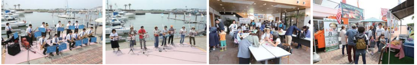
Live&演奏会もとても賑やかで、多くの人が足を止めて聞き入っていた。カルチャースクールでは体験レッスンを開催。キッチンカーはどれも美味しそうだった。

ナーのマリンライフをサポートしてくれる。今回はダイチグループが創業70周年を迎えるにあたり、感謝祭を開き、様々な魅力的な展示やイベントを開催していた。マリーナには大勢の人達が集まり、穏やかな海面でボートやヨットの体験乗船、シーカヤックやSUPの体験を楽しんでいた。こうしたイベントが開催された事によって、海遊びの持つ大きな魅力に沢山の人が気付いてくれたのではないかなと思う。