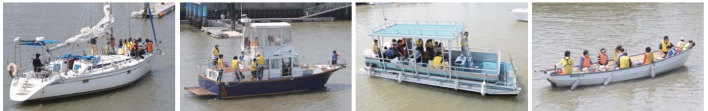
体験乗船のイベントではヨットやプレジャーボートに乗って、非日常の体験ができる。このイベントをきっかけに多くの方に海の素晴らしさを知って貰えたと思う。