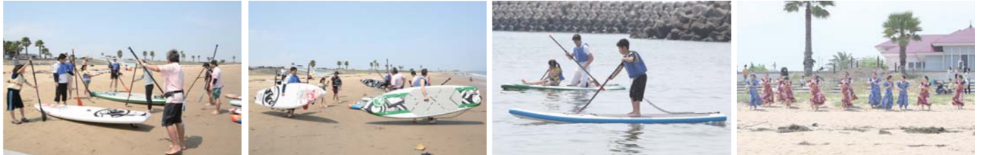
SUP体験はとても人気があり、浜辺には今話題のマリンスポーツを体験しに、多くの参加者が集まっていた。砂浜では素敵なダンスも披露されていた。