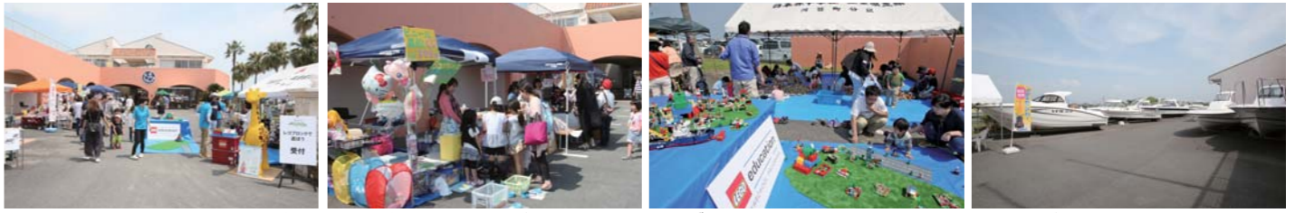
このイベントは年齢関係なく誰もが楽しめるのが良いところだ。ビニール風船くじやレゴの体験コーナーも賑やかだった。もちろんボートの展示も充実していた。