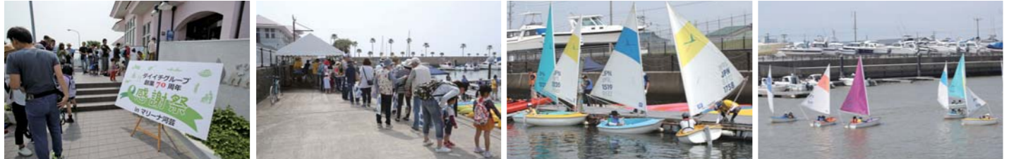
イベント当日は朝から行列ができていた。体験試乗や操船を申し込む人でマリーナは大賑わい。沢山の人が気持ち良さそうにアクセスディンギーに乗っていた。

取材協力:マリーナ河芸 三重県津市河芸町東千里854-3 TEL 059-245-5001 URL http://www.marina-kawage.co.jp