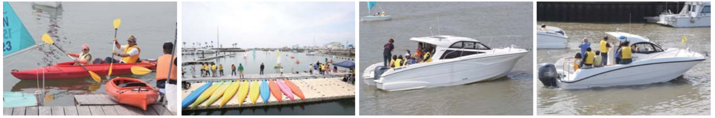
シーカヤックも人気で大人から子供までマリンスポーツに触れ合える素晴らしい時間となっていた。もちろんプレジャーボートの乗船も人気となっていた。