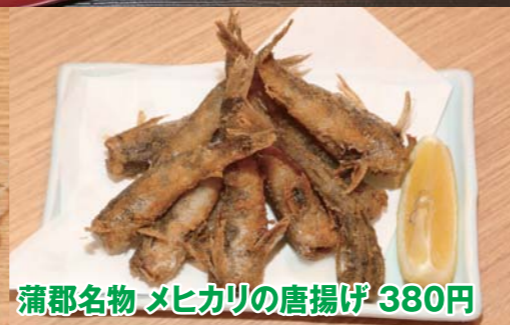
蒲郡名物 メヒカリの唐揚げ 380円