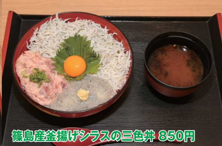
篠島産釜揚げシラスの三色丼 850円