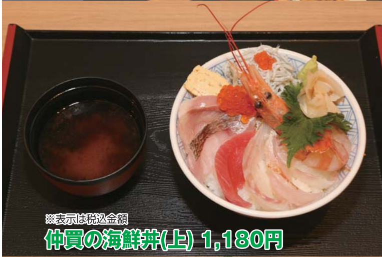
※表示は税込金額 仲買の海鮮丼(上) 1,180円