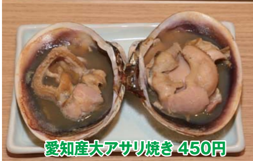
愛知産大アサリ焼き 450円