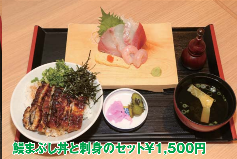
鰻まぶし丼と刺身のセット ¥1,500円