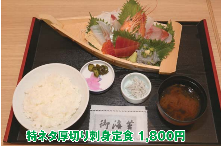
特ネタ厚切り刺身定食 1,800円