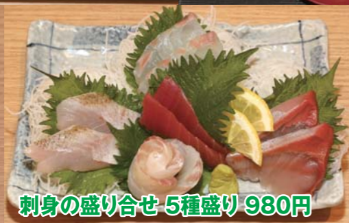
刺身の盛り合せ 5種盛り 980円