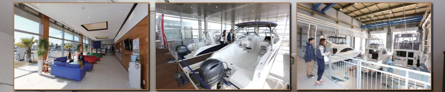
NTPマリーナりんくうは中部エリア最大級の設備で販売～保管、メンテナンスまで幅広くサポートしてくれます。メンテナンス工場は24m級の艇が4艇入ります。