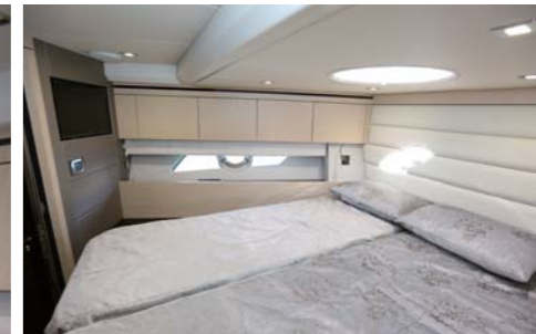
両サイドや上からの採光も確保され、非常に明るい。