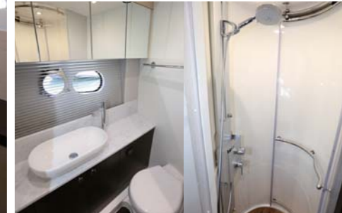
パウバースにもアイランドベッドがあり、こちらは用途に応じてダブルからツインにも変換が可能だ。専用トイレとシャワーもあり、プライバシーも確保。