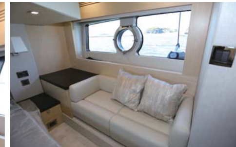
左舷側にはソファを配置。ゆったりと寛ぐ事もできる。