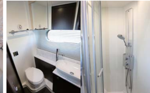
マスターステートルームにはダブルのアイランドベッド。室内は高さもあり、両側の窓からの採光も十分だ。清潔感のあるトイレとシャワースペースも確保。