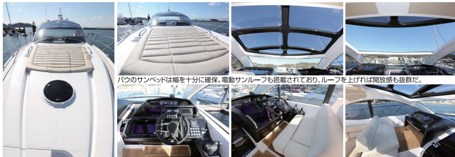
パウのサンベッドは幅を十分に確保。電動サンルーフも搭載されており、ルーフを上げれば開放感も抜群だ。