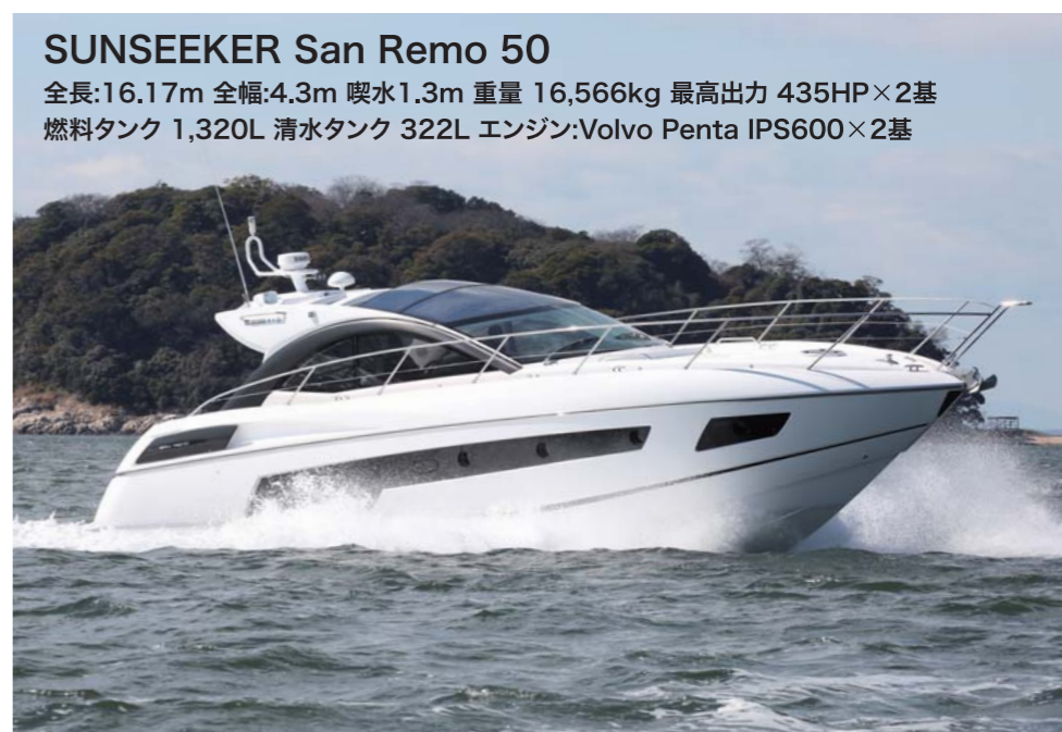
SUNSEEKER San Remo 50 全長:16.17m 全幅:4.3m 喫水:1.3m 重量 16,566kg 最高出力 435HP×2基 燃料タンク 1,320L 清水タンク 322L エンジン:Volvo Penta IPS600×2基

SUNSEEKER San Remo 50(サンシーカー サンレモ)はスタイリッシュなハードトップスタイルのエクスペスクルーザーだ。435馬力のエンジンを2基搭載しており、加速性能も高く力強い乗り味を楽しめる。旋回時には滑らかなコーナリングを見せ、バンク角も穏やかに走行時の安定性も高い。