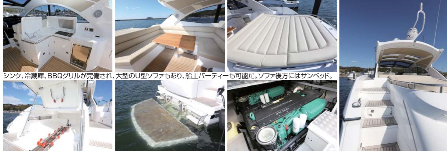
シンク、冷蔵庫、BBQグリルが完備され、大型のU型ソファもあり、船上パーティーも可能だ。ソファ後方にはサンベッド。