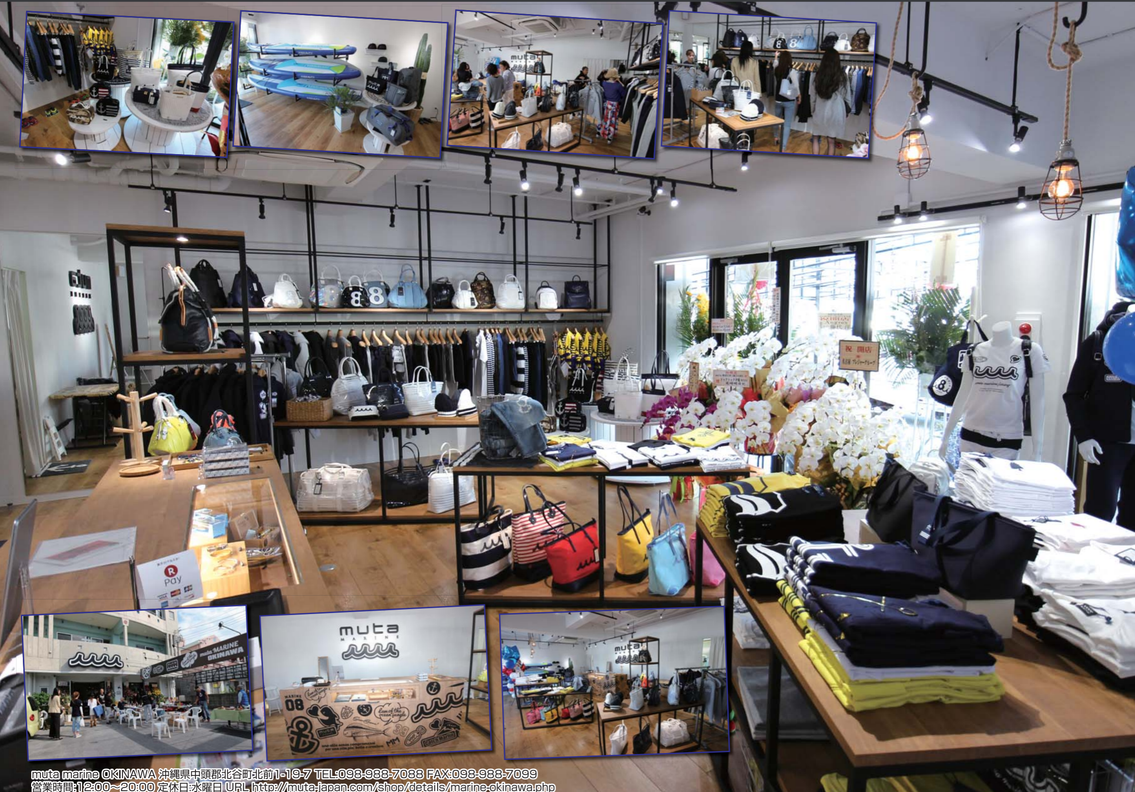
muta marine OKINAWA 沖縄県中頭郡北谷町北前1-19-7 TEL:098-938-7088 FAX:098-938-7099 営業時間:12:00~20:00 定休日:水曜日 URL http://muta-japan.com/shop/details/marine-okinawa.php