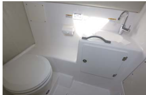
キャビンにはハンドレール付きのテーブルとL型シートを配置。右舷側にもシートとサイドボックスがある。マリントイレは広くて快適。女性にも喜ばれそう。