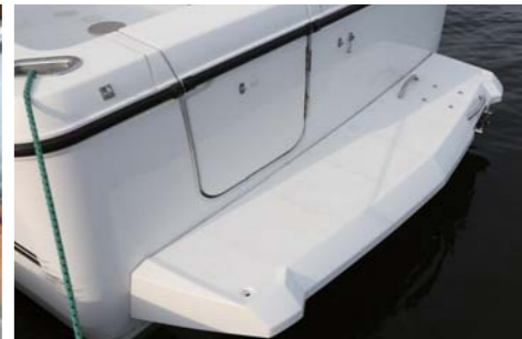
アフタデッキはフラットでこの広さ。エンジンは高い信頼性と燃費効率を持つVOLVO D6-435を採用。後方にはステップがあり、ポートへのアクセスも簡単。