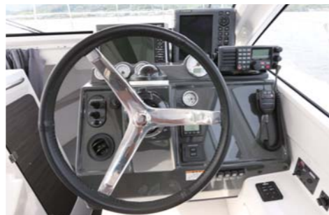
パウバースは大人一人が仮眠を取れるスペースを確保している。ヘルムは操作性がとても良い。航海計器の設置エリアも広く、自分好みにアレンジできそう。