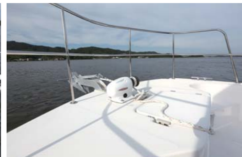
スクエアパウを採用したパウエリアは広い釣りのスペースを確保している。この広さなら複数でのキャストにも対応可能。パウレールにも高さがある。