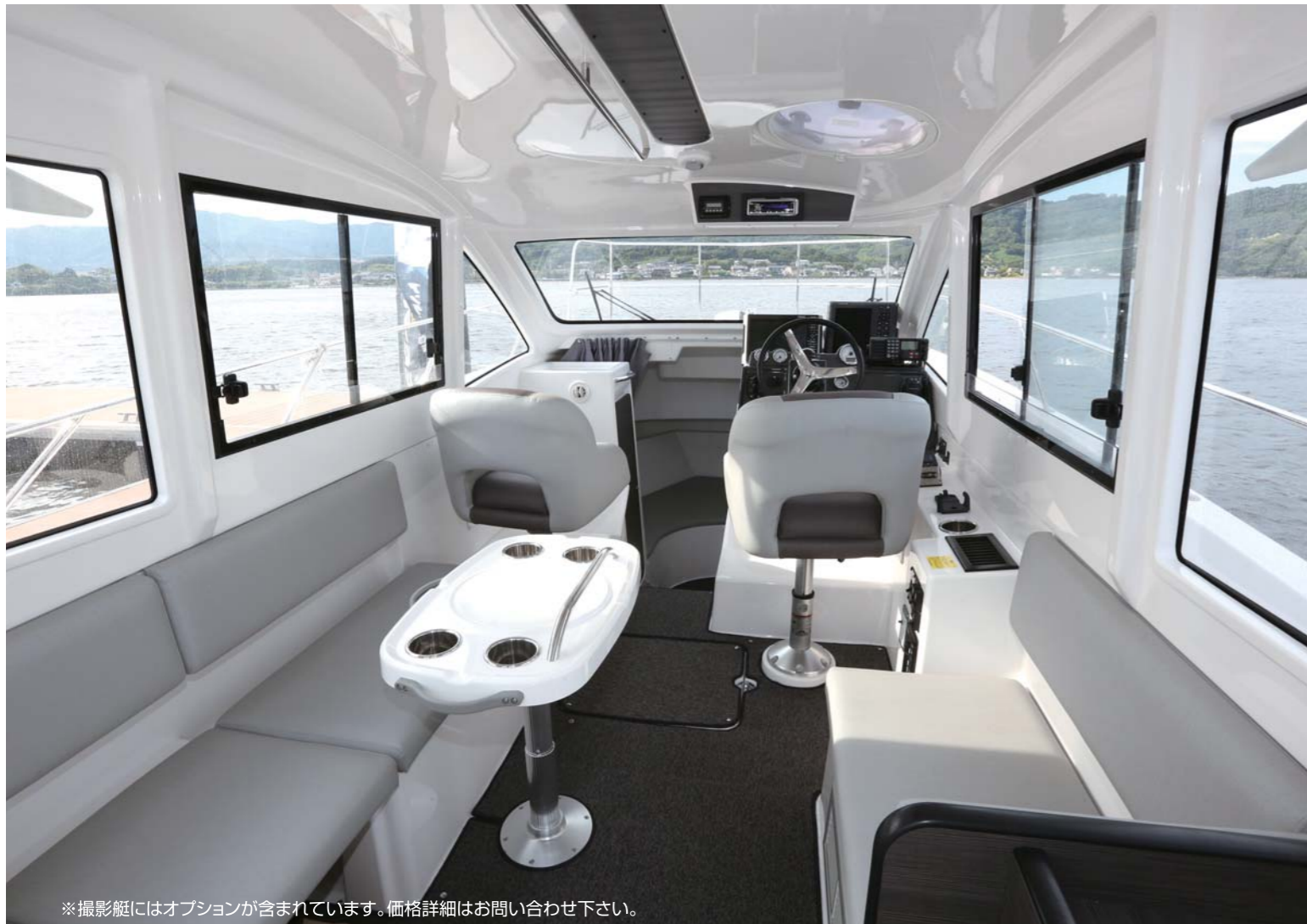
※撮影艇にはオプションが含まれています。価格詳細はお問い合わせ下さい。