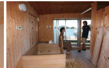
桧の展望風呂はとても良い香りです。