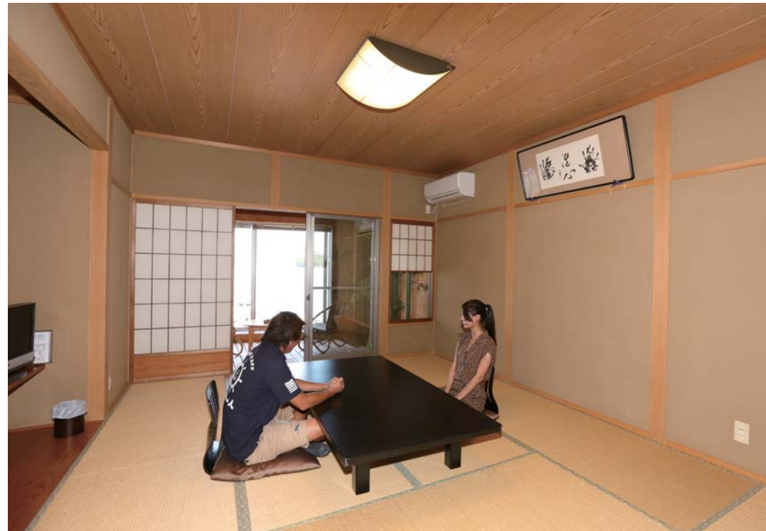
1Fにある鯛の間は広々とした客室で、桧の展望風呂付きとなっています。これなら家族や恋人にも喜ばれそうです。