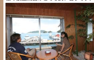
湯上りはテラスで寛ぐこともできます。