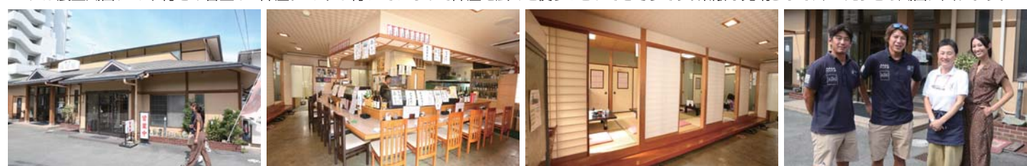
宿に併設する和食処は地元では居酒屋としても愛されています。今回はこの食事をご紹介しますが、どれも絶品でした!!皆さん、撮影お疲れ様でした!!

航路は鳥羽桃取水道を通るコース。桃取水道まで来たら大村島赤灯台を左舷側に見て航行します。その後、イルカ島も左舷側に見て航行し、細い航路を走ります。そこからは筏等に気をつけて航行して下さい。また、お宿の棧橋を利用する際は必ず事前にお宿へ連絡して下さい。お宿に到着後は早速館内の撮影に入ります。お部屋は1Fに1部屋、2Fに3部屋あり、どこも展望風呂付きです。もちろん大浴場もあるので、仲間同士でゆっくりと語りたい時でも安心です。部屋は広々として清潔感があり、2Fの部屋にはロフトも完備されていました。ここなら釣りの遠征に鳥羽に来られた際にも拠点として活躍してくれそうです。続いてお料理の撮影ですが、まず頂いたのは松阪牛のステーキ丼です。松阪牛が贅沢にご飯の上に乗っており、肉の旨みが溢れんばかりに口中に広