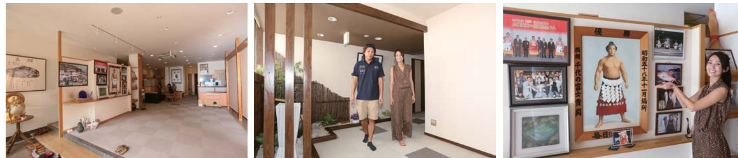
広々としたエントランスロビーは気持ち良くゲストを迎え入れてくれます。館内は清潔感があり、とても過ごしやすいです。大将は九重親方の大親友です!!

三重県鳥羽市小浜町272-58 TEL 0599-25-2259 URL http://www.hamabeya.com