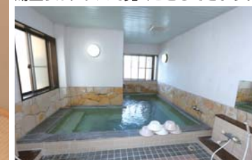
1Fには大浴場もあります。