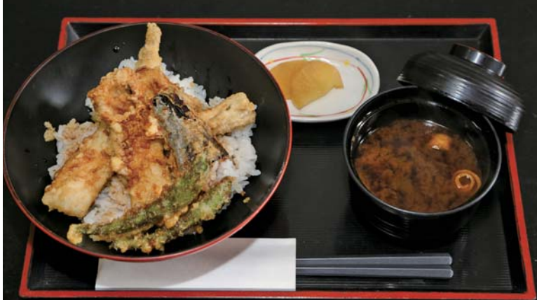
海老の天ぷら定食 ¥1680(税込)