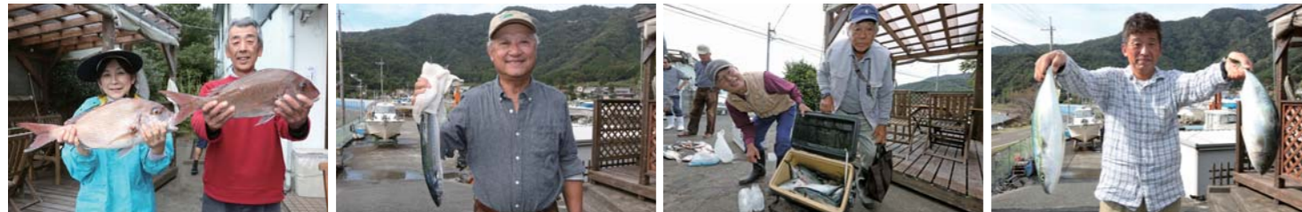
検量開始時間になるとマリーナには続々と参加艇が帰港してきた。クーラーボックスを開けると型の良い真鯛や青物を中心に魚がギッシリと入っていた。