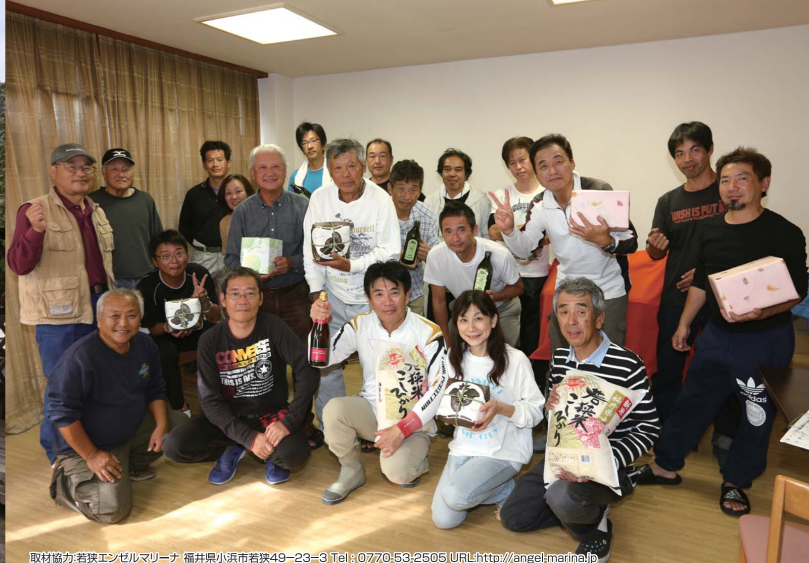
取材協力:若狭エンゼルマリーナ 福井県小浜市若狭49-23-3 Tel : 0770-53-2505 URL:http://angel-marina.jp