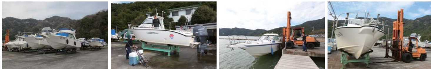
若狭エンゼルマリーナは小浜湾の東奥に位置し、釣りを楽しむオーナーが多数在籍している。また、マリンフォークリフトを完備し、揚降も非常にスムーズだ。