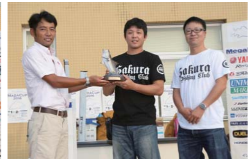
ボート部門(チーム) ショッカー静岡A 220.75P