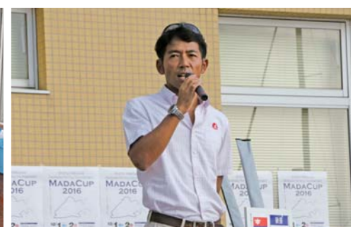
表彰式会場となった三河みどまりーナには多くの選手やその家族が集まった。同伴者参加可能な抽選会も行われるため、家族でも楽しめる内容である。