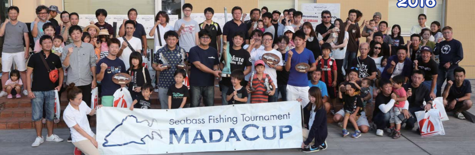
取材協力: 三河みどまりーナ 愛知県豊川市御津町御幸浜1-1-21 Tel:0533-76-3100 URL: http://mikawamito-marina.com/web/

Enshu-Mikawa Seabass Fishing Tournament MADACUP 2016