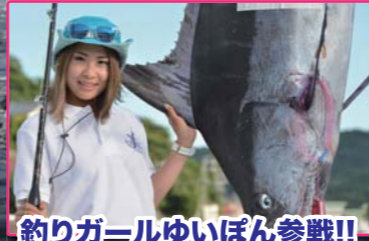
釣りガールゆいぼん参戦!!

第20回の記念大会となった今年の鳥羽ビルフィッシュトーナメント。エントリー45艇、参加者約200人と今年も非常に大きな規模での開催となった。この大会は開催地の中部だけでなく、関東や関西エリアからも参戦があり、各エリアでトーリングを楽しむオーナー同士の親睦も深められる大会である。今シーズンは中部エリアのカジキも比較的好調と言える年で、今大会は多くの釣果が期待されていた。初日のキャプテンミーティングでは各チームに向けて、注意事項や最新の釣果情報が伝えられ、参加者が真剣な表情でメモを取る姿が印象的であった。