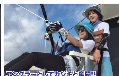
アングラーとしてカジキと奮闘!!