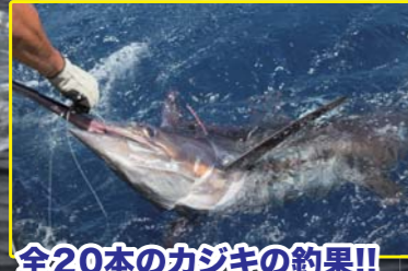
全20本のカジキの釣果!!