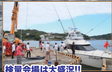
検量会場は大盛況!!