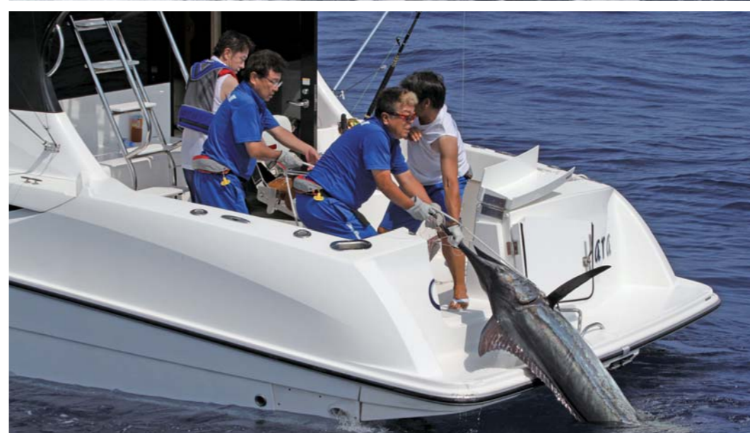
フリーダムは開始わずか1時間でカ ジキをヒットさせた!!