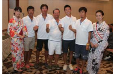
フォンテンポーネII