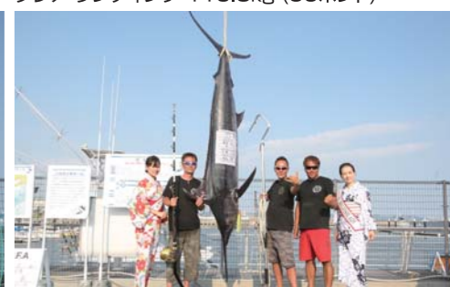
ヘラクレス:特別賞 152.8kg