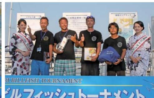
特別賞:ヘラクレス