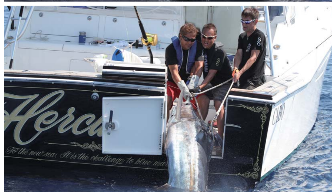
大物とのファイトを制したヘラクレス が特別賞を受賞!!