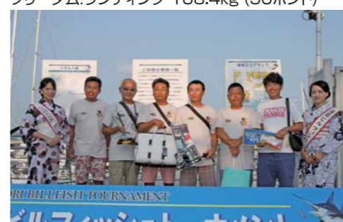
準優勝:コニー 144P (T&Rの順番により2位)