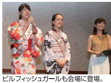
ビルフィッシュガールも会場に登場。