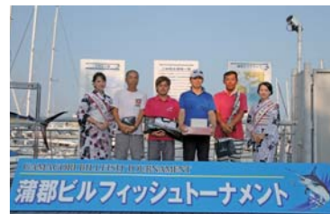
蒲郡ビルフィッシュトーナメント