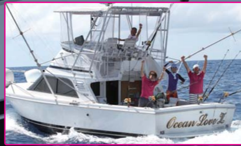
今年の優勝はオーシャンラブ!!1日に2本のT&Rに成功!!見事第15回のチャンピオンに輝いた!!