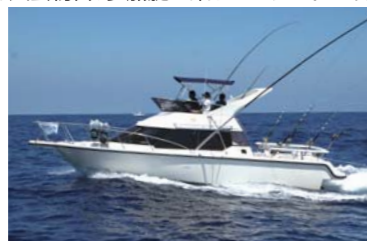
フォンテンポーネII