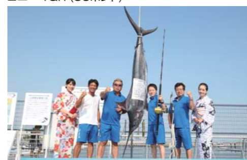
フリーダム:ランディング 108.4kg (50ポンド)