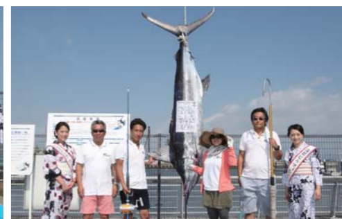
クリア:ランディング 119.8kg (50ポンド)