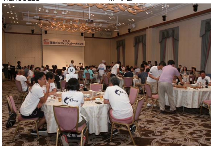
ウェルカムパーティーは蒲郡クラシックホテルで盛大に開催された。

ィーも開催され、オーナー同士が笑顔で交流を深めるシーンも見ることができた。こうしたパーティーでは普段違うマリーナに所属するオーナーとも交流を深める事ができ、参加したオーナー達にとっては有意義な時間になっていた。また、パーティーではムータバッグを中心にルアー等の豪華景品が当たる抽選会も行われ、会場は大きな盛り上がりを見せた。そして、翌日の2日目はオーシャンラブが幸先良くT&Rに成