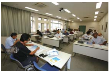
前日にはキャプテンミーティングを実施。大会初日、参加艇が集まるスタートフィッシングは迫力ある光景が広がった。

取材協力 ラグナマリーナ 愛知県蒲郡市海陽町2丁目1番地 TEL.0533-58-2950 URL http://www.lagunamarina.co.jp