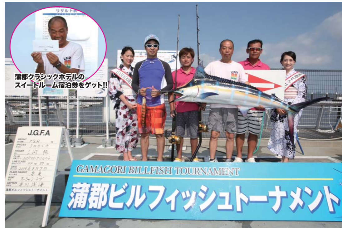
蒲郡クラシックホテルの スイートルーム宿泊券をゲット!!

功。続いてクリアが100キロオーバーのカジキをランディングし、まずまずのスタートを切っていた。すると11時を過ぎた頃、再びオーシャンラブからヒットコールが入った。ファイトもスムーズで、なんとこの日2回目となるT&Rを成功!!その結果、見事大会優勝の栄冠を勝ち取ったのである。今年は沢山の釣果と交流が生まれた『蒲ビル』。参加チームにとって、最高に熱いビルフィッシュトーナメントであったに違いない。