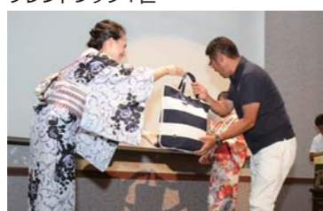
ムータ等の豪華景品抽選会も開催!!