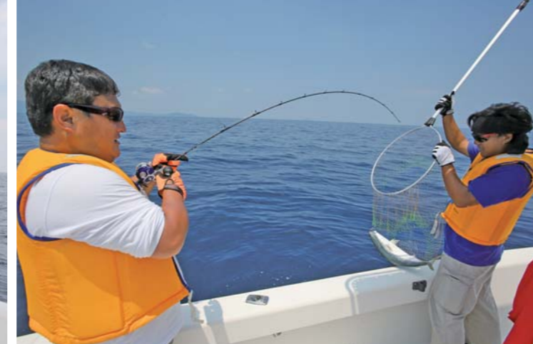
マリーナからポイントまでは約25分で到着。この近さが若狭湾の魅力の一つでもある。ジグを落とすと直ぐにハマチがヒット。もう一つの魅力は魚影の濃さだ。