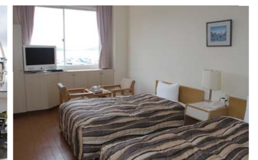
マリーナは小浜西ICより車で1分の好立地。陸上ヤードは広く、様々なタイプのボートが幅広く保管されている。ホテルも併設しており宿泊施設も充実している。