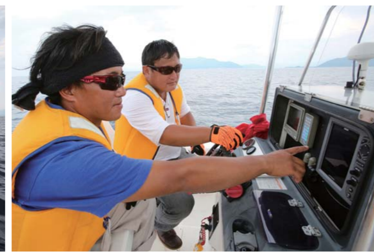
今回はレンタルボートのラインナップの中から、スズキアグレッサーで出航。GPSと魚探を駆使し、前日までの釣果情報を元に魚の集まりそうなポイントを探す。