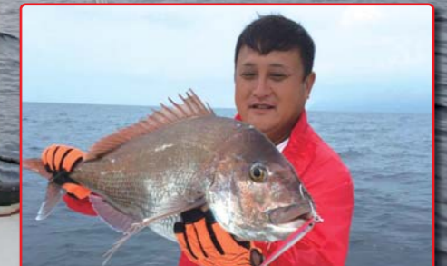
大型の真鯛もゲット!!この魚影の濃さは最高。是非多くの方にチャレンジして欲しい!!

取材協力 若狭マリンプラザマリーナ 福井県小浜市岡津44 TEL 0770-53-2100 URL http://www.marineplaza-marina.com