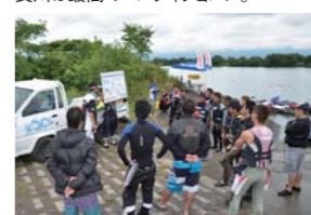
まずはコース説明などのライダーズミーティングからスタート。