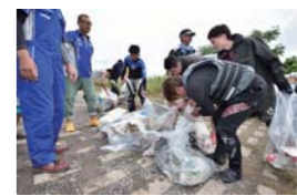
レース後には感謝の意味も込めて、参加者全員で長良川のリバーサイドクリーンをおこなった。