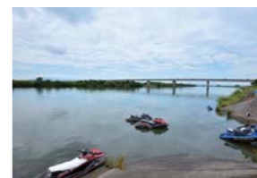
久々のS-1開催を歓迎するように、長良川は最高のコンディションに。

が降る天候ながら、水面は鏡のようなベタ。久しぶりのS-1を思う存分堪能できるシチュエーションとなり、さらに好タイムも連発。昨年の全国大会での優勝タイムと同等の成績を収めたライダーもいるなど、レベルの高いレースとなった。来年以降も継続して、長良川でのS-1が開催されることを期待したい。