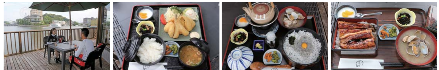
桟橋に係留し食事開始。テラスはウェットスーツで食事OK。サクサクのフライ、釜揚げ&生シラスを堪能。浜名湖名物のうなぎと濃厚なあさり汁は絶品の一言。