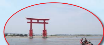
弁天島の鳥居に水上からアクセス!!

取材協力:富士マリナー 静岡県浜松市西区呉松町1229 TEL 053-487-0884 URL http://www.marine-dealers.net/fuji-m/ BRPジャパン(株) 神奈川県川崎市川崎区東田町8 TEL: 044-200-1431 URL: www.brp-jp.com