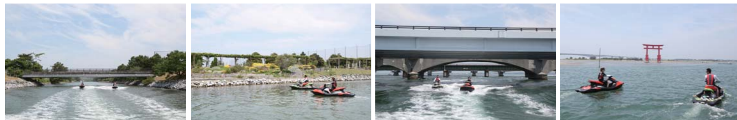
道中は水路を走ったり、浜名湖ガーデンパークで花を水上から観察した。また、いくつかの橋の下を潜る事もある。お勧めのスポットはやはり弁天島の鳥居だ。