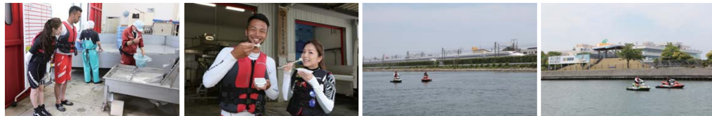
取材という事で特別にシラス工場を見学。ここでは新鮮なシラスを2人でパクリ。他にも新幹線の通過するスポットや浜名湖競艇場の建物を水上から見学した。

浜名湖は年間を通じて様々なマリンスポーツが楽しめる人気のレジャースポットだ。今回は本格的なツーリングシーズンを迎えるに辺り、シードゥのスパークとともに、見所満載の浜名湖をたっぷりご紹介していこうと思う。スパークは発売以降、手軽な価格設定と爽快感溢れる走行性能で多くのユーザーの心を掴んでいる人気PWCだ。そして、今回浜名湖の魅力を紹介してくれる富士マリナーは、PWC以外にもボート