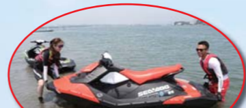
浅瀬でスパークを安全な位置に移動!!