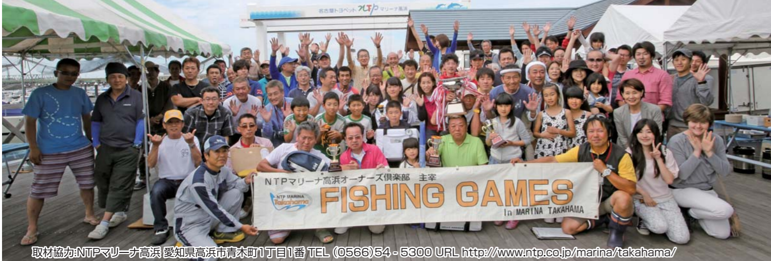
取材協力:NTPマリーナ高浜 愛知県高浜市青木町1丁目1番 TEL (0566)54-5300 URL http://www.ntp.co.jp/marina/takahama/

6月5日(日)に愛知県高浜市のNTPマリーナ高浜で「第12回 キス釣り &バーベキュー大会」が開催された。このイベントが開催されたNTPマリーナ高浜は年間を通じて様々なイベントが開催され、オーナー同士の交流も積極的に行われるとても雰囲気の良いマリーナだ。今年も全17艇がエントリーし、イベントは盛大に行われていた。大会当日の天気は小雨のぱらつく曇り空。しかし、出港後しばらくすると雨も止み、曇ってはいたものの気温的には釣りのしやすいコンディションとなった。また、当日の海況は風も波も無く、釣りに専念しやすい最高の状態だった。スタートフィッシング時には、全参加艇が撮影艇の前を気持ち良さそうに走り抜け、それぞれ思い思いのポイントへとボートを走らせた。そして、