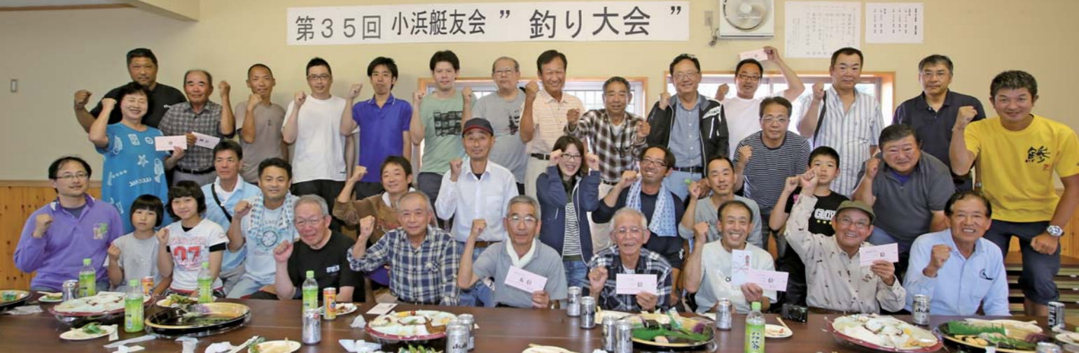
第35回 小浜艇友会 ”釣り大会”

取材協力: 小浜マリーナ 福井県小浜市甲ヶ崎第9号25番地 TEL : 0770-53-1173 URL : obama-marina.com/