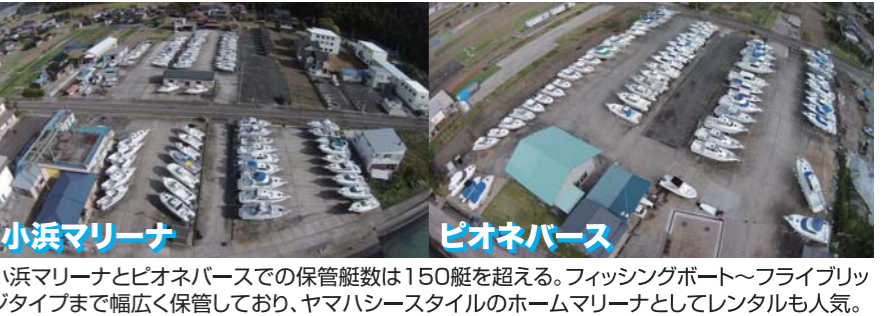
小浜マリーナ ピオネバース

1日という期間内にも関わらず、真鯛69.5cm、キス24.7cmと好記録が揃えられていた。これだけ勝負強いオーナーが集まると、優勝するのも至難の技である。また、大会の雰囲気自体もとても良く、マリーナに集まったオーナー同士は皆本当に社交的な方が多い。一度会話が盛り上がると、子供からベテランまで釣りの話題で笑い声が絶えないのだ。今年もオーナー同士が笑顔で交流を深めた素敵なイベントとなっていた。