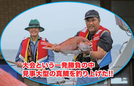
大会という一発勝負の中 見事大型の真鯛を釣り上げた!!