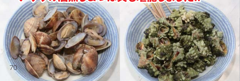
アサリの酒蒸し&つぼ貝も堪能しました!!