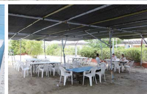
お店にはバラエティに富んだメニューが用意され、カレーライス、ラーメン、ピラフ、各種定食と幅広く揃っている。食事スペースも広くて快適です。