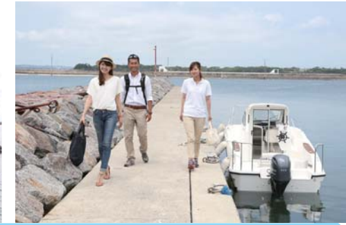
※必ず御自身で海図、GPS、魚探、天気予報等をご確認の上、安全に十分注意してお出かけ下さい。トラブル等発生致しましても当社は一切責任を負いません。