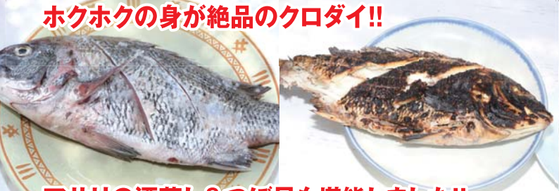
ホクホクの身が絶品のクロダイ!!