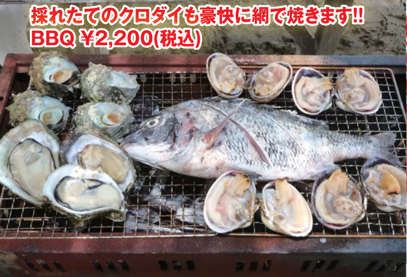
採れたてのクロダイも豪快に網で焼きます!! BBQ ¥2,200(税込)

佐久島 なぎさ(海の家) TEL 0563-79-1062 愛知県西尾市一色町佐久島西屋敷 なぎさ GW~夏は毎日営業。予約の場合は10月までオープン