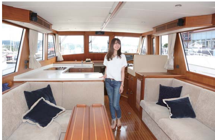
GRAND BANKS HERITAGE 41EU グランドバンクスは広いサロンがあり、休日のマリーナステイも快適に過ごせます。居住性が高く、ショートはもちろんロングクルージングにもピッタリの一艇です。