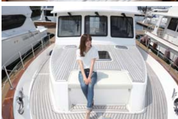
三河みとマリーナにはグランドバンクスのようなセンス溢れる輸入艇が多数展示・保管されています。他にもお洒落な輸入艇が揃うので、是非チェックして下さい。取材協力:三河みとマリーナ 愛知県豊川市御津町御幸浜1-1-21 Tel:0533-76-3100 URL http://mikawamito-marina.com