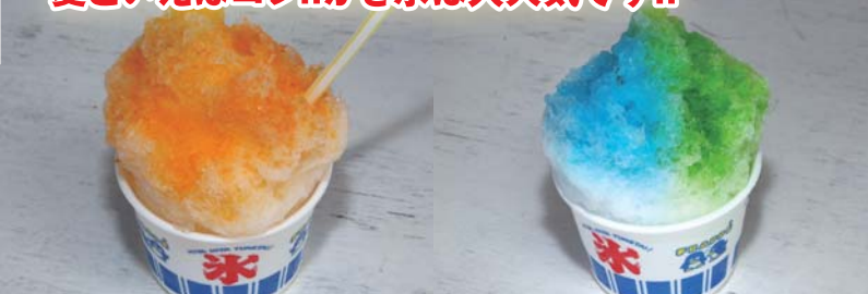
夏といえばコレ!!かき氷は大人気です!!