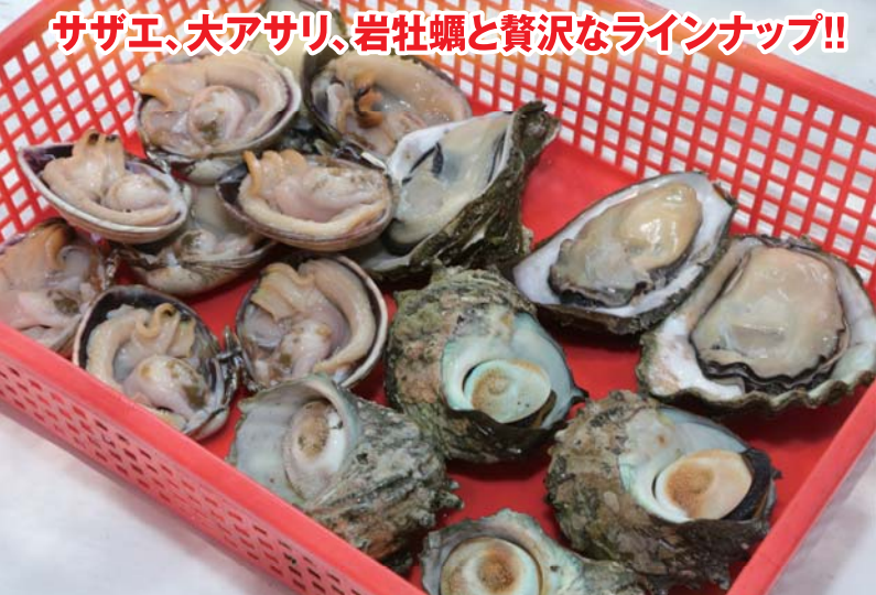
サザエ、大アサリ、岩牡蠣と贅沢なラインナップ!!