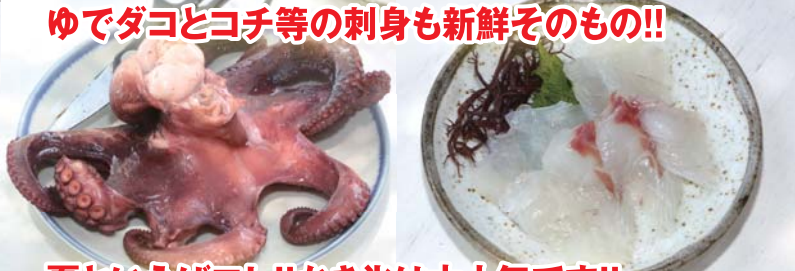
ゆでダコとコチ等の刺身も新鮮そのもの!!