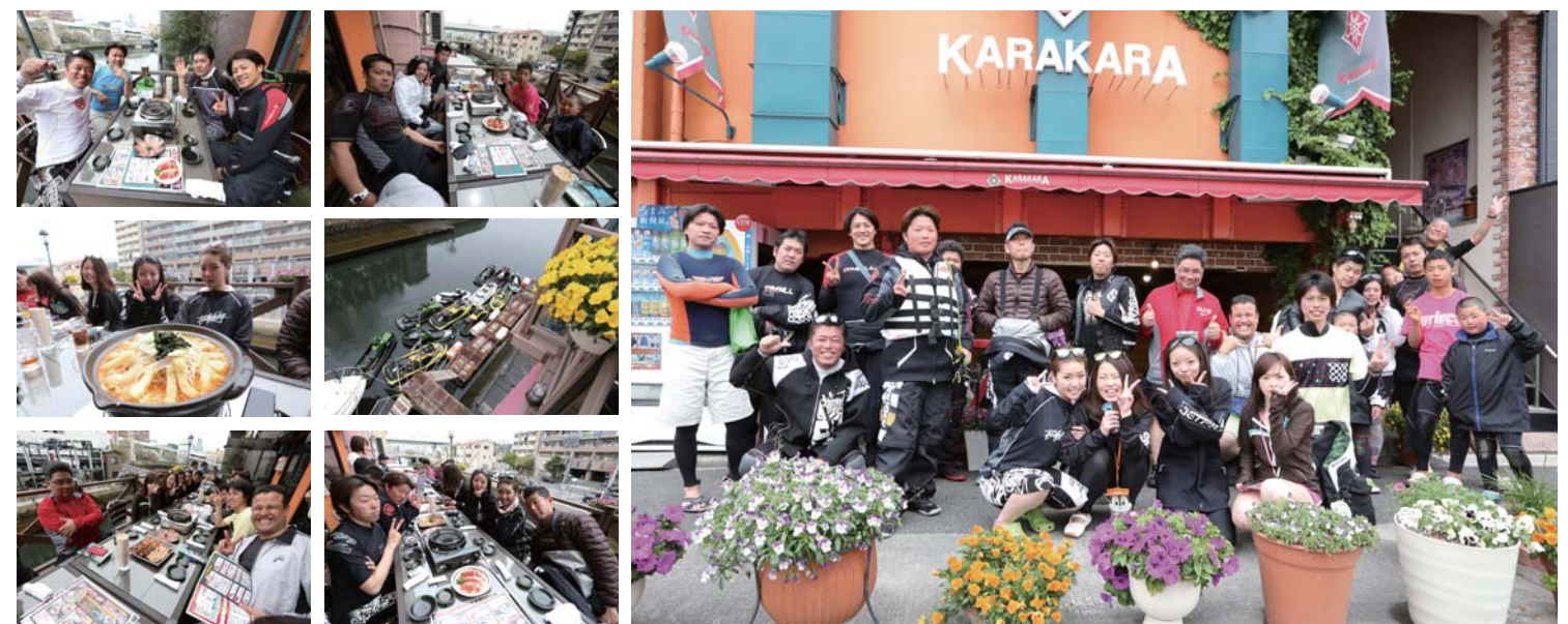
KARAKARA 総本店 愛知県名古屋市中区松原3-1-14 エムズビルSouth Tel.052-324-0331 17:00~24:00 (10名様以上お昼予約営業可)