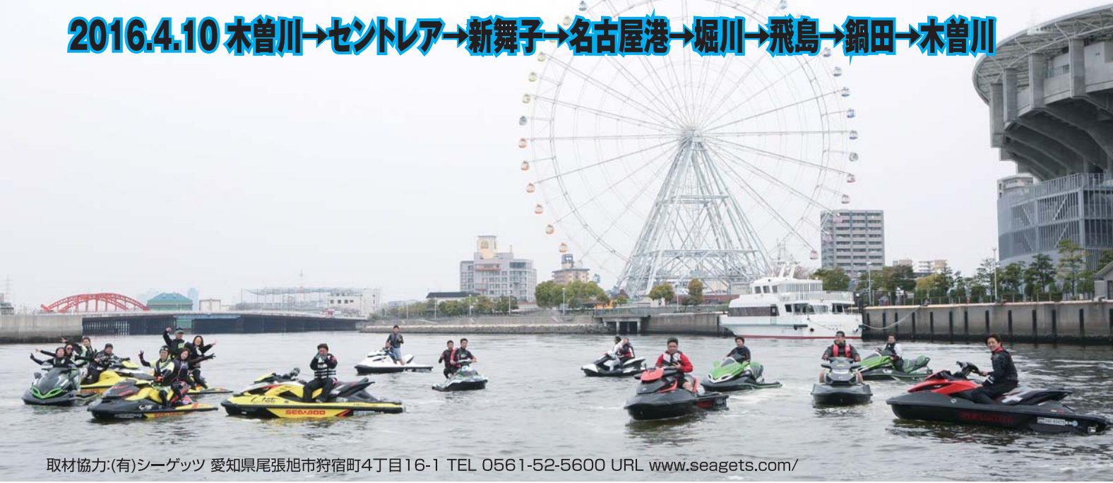
取材協力:(有)シーゲッツ 愛知県尾張旭市狩宿町4丁目16-1 TEL 0561-52-5600 URL www.seagets.com/

2016.4.10 木曾川→セントレア→新舞子→名古屋港→堀川→飛鳥→鍋田→木曾川