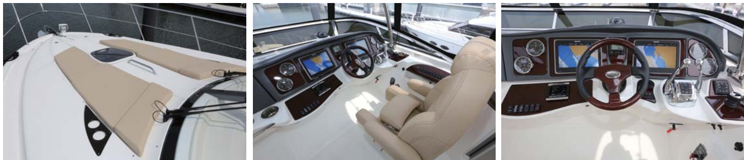
水面に浮かびながらフォワードデッキサンパッドで一休みするのも良いだろう。フライブリッジのヘルムには両サイドに2つレイマリンが搭載されている。