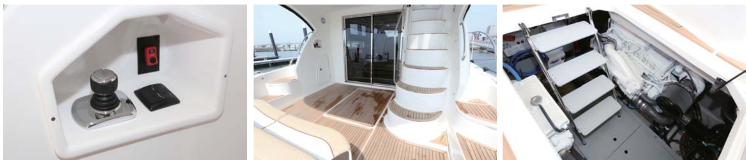
後方コックピット内にもジョイスティックがある。また、コックピット下にはエンジンルームがあり、カミンズQSB6.7L 480HO ZEUS×2基が搭載されている。