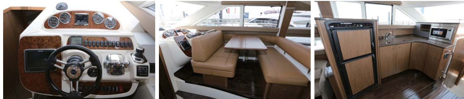
ロアヘルムもあり、急な雨にもこちらで対応できる。ソファは可動式で用途に応じてスタイルを変えられる。また、本格的なギャレーが完備されている。