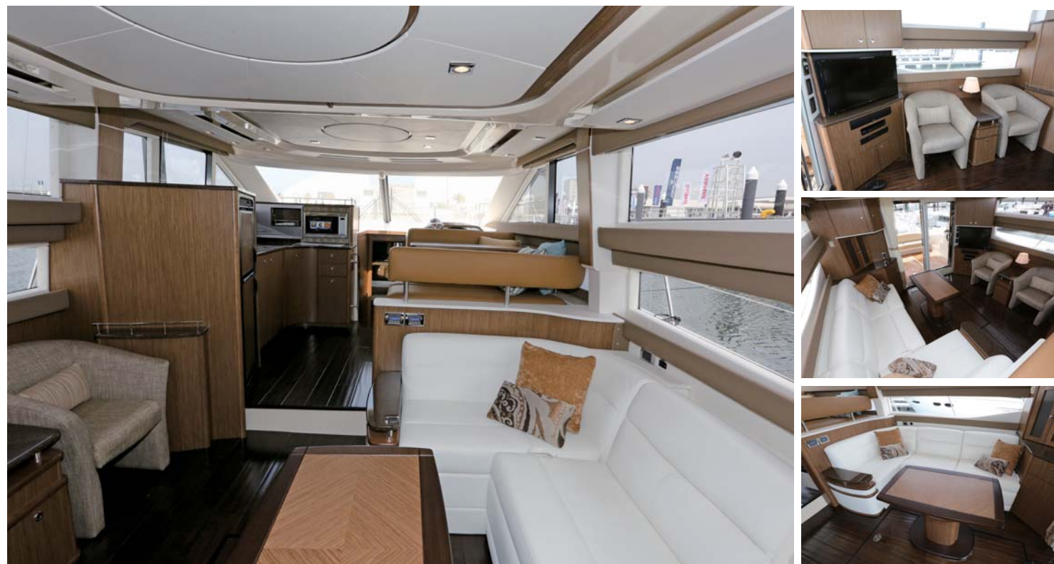
メリディアン441セダンのメインサロンはとても効率的なレイアウトで居住性も高い。休日には仲間とのマリーナステイも十分に楽しませてくれるだろう。