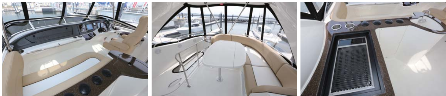
フライブリッジの広さは申し分ない。ヘルム横とフライブリッジ後方には座り心地の良いシートを配置。ギャレーにはBBQグリルもあり、仲間と食事を楽しむ。