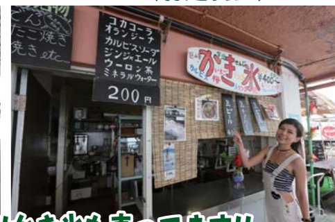
清潔感のある休憩スペースや食事が買えるカウンターも設置!!かき氷も売ってます!!

に見ながら航行します。続いて見えてくる小島も距離をキープしながら大きく外に回り込みます。入港する棧橋の手前には沖合に向けて馬の瀬という浅瀬がありますので、必ずここも大きく回り込んで棧橋に係留して下さい(詳細はクルージングマップより)。棧橋に係留後は早速ビバを目指します。三河大島は夏になれば島がとても賑やかになり、BBQや海水浴、マリンスポーツを楽しむ大勢の人で溢れています。今回ご紹介するお店はそんなマリニーズンに是非ご利用して頂きたいお店で、係留した棧橋からも歩いてスグの距離にあります。建物は大きく、敷地も広いので団体での利用やプライベートでのバカンスの際にはピッタリです。今回は地元の新鮮な大アサリを中心とした海鮮BBQとジューシーな和牛を中心とした肉系BBQの両方を頂きました。大アサリは言