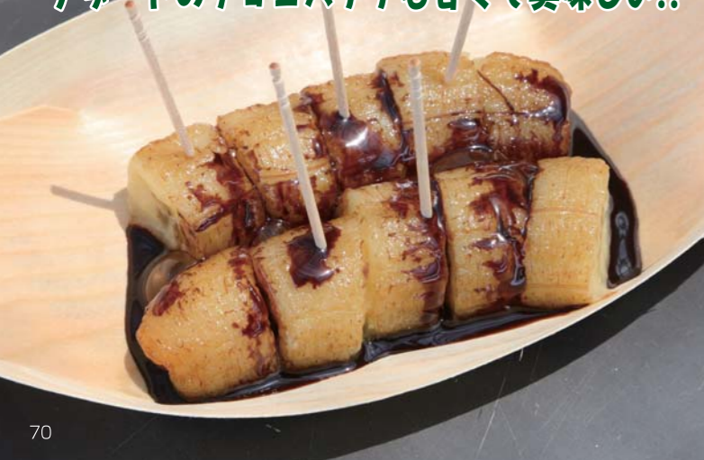
デザートはチョコバナナも甘くて美味しい!!