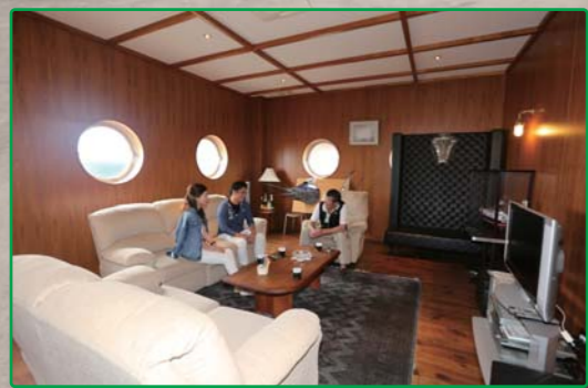
まずは居心地の良い応接室で休憩します。