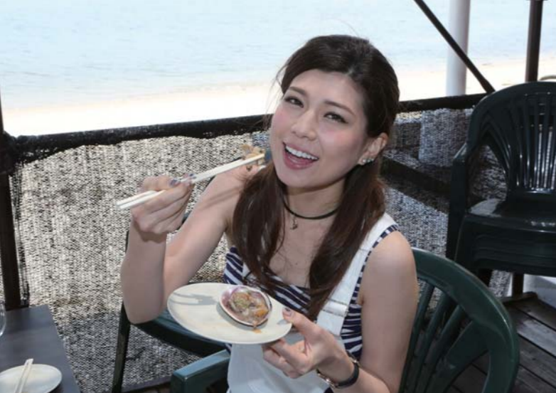
新鮮な素材を使った海鮮中心のプレート