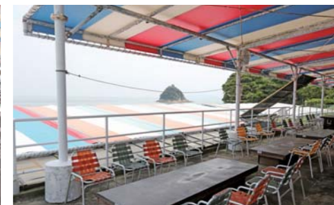
Viva(ビバ)は三河大島の東浜海水浴場にあります。大きな建物で中もとでも広いです!!

VIVA ビバ 三河大島 海の家 Viva ビバ 090-3851-5512(担当 斎藤) 営業時間 9:00 ~ 17:00 営業期間 5月1日~6月30日 渡船運行が無い為 不規則運営となります。事前にご連絡下さい。 7月1日~8月31日(悪天候日以外毎日OPEN) URL http://viva-3.com