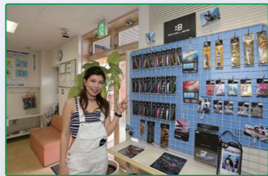
ポーズレスガールも務めるさゆりちゃんがお勧めするジグがマリーナでも手に入ります!!

取材協力:NTPマリーナ高浜 愛知県高浜市青木町1丁目1番 TEL (0566)54 - 5300 URL http://www.ntp.co.jp/marina/takahama/