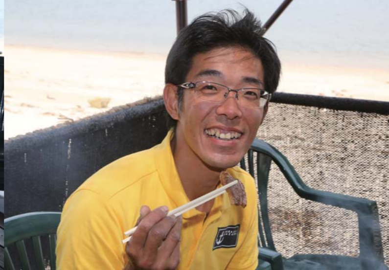
肉と野菜がボリューム満点に乗ったプレート