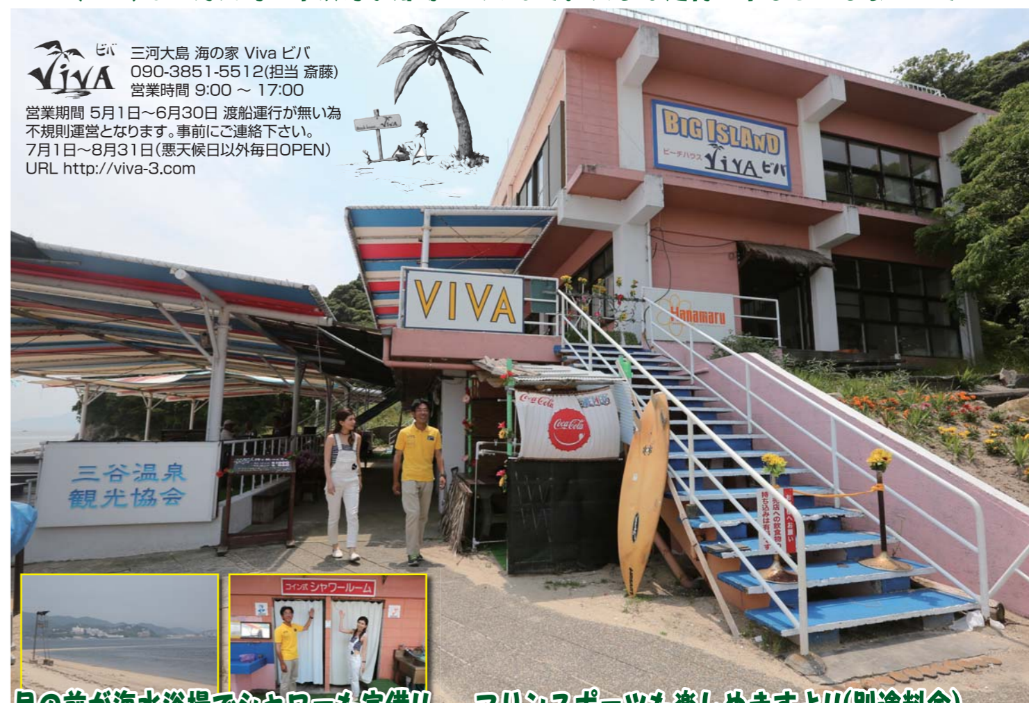
目の前が海水浴場でシャワーも完備!! マリンスポーツも楽しめますよ!!(別途料金)