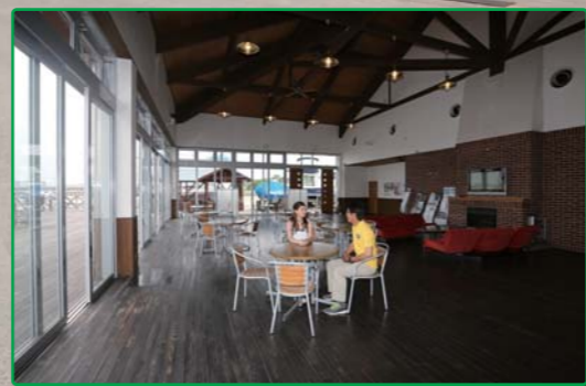
クラブハウスではマリーナの概要を質問!!