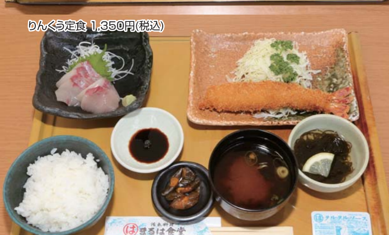
りんくう定食 1,350円(税込)