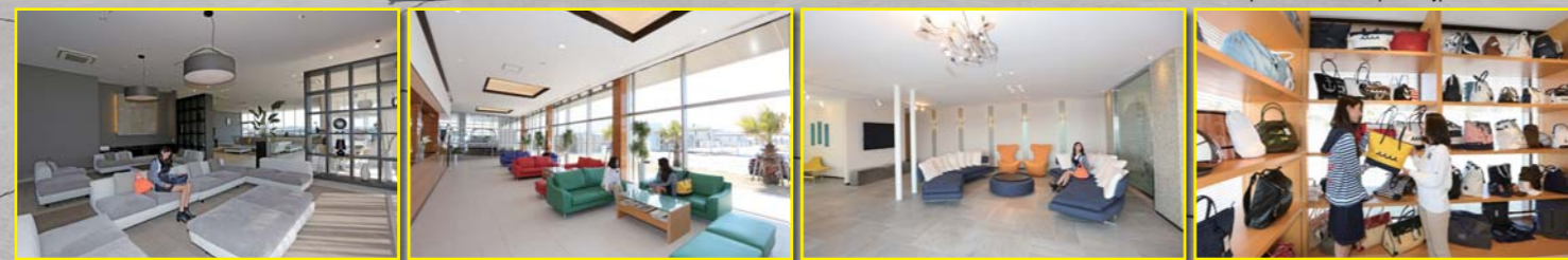
上品なレイアウトのマリーナハウス 落ちついた空間のマリンブラザ オーナー限定のメンバーズハウス ムータのショップにも注目です