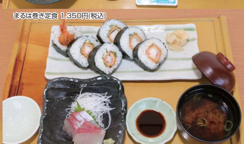
まるは巻き定食 1,350円(税込)

※各コース追加200円(税込)でソフトドリンクまたはコーヒーが付きまます。※平日昼間のみのご提供となります。