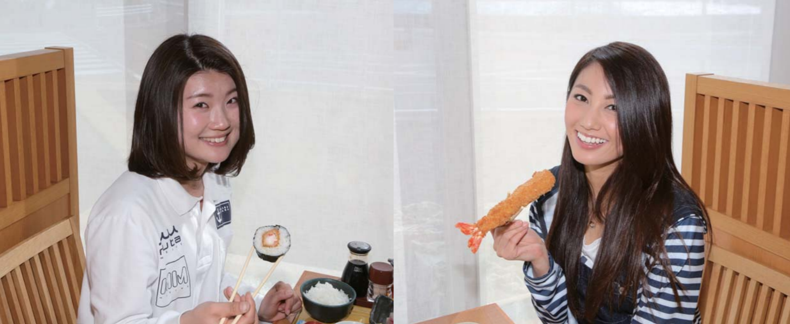
うめさん定食 1,890円(税込)