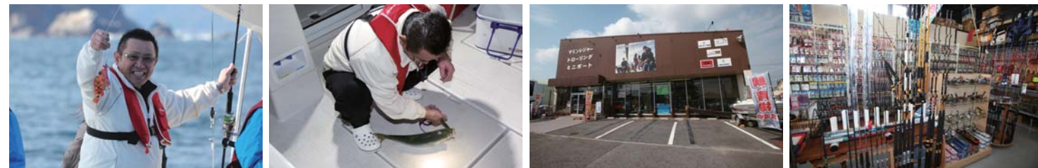
釣った魚を美味しく食べるため、帰港後は素早く魚を締める。愛知県豊田市にあるアクティブマリンでは釣りを通じてポート遊びの魅力をとことん提案してくれる。

発売以降多くのボートユーザーから高い評価を受け続けているリガーマリンエンジニアリングの新型スパンカー。国内でも屈指の技術力を誇るメーカーが、ユーザー目線に立って開発したスパンカーは操作性の高さはもちろん、品質にも疑いの余地はない。初心者であってもレクチャーさえ受ければ、問題なく使いこなす事ができる操作性は、まだスパンカーを装備していないオーナーにも是非注目して頂きたいアイテムである。今回はそんなリガーマリンエンジニアリングのスパンカーがヤママーの人気モデルEX33-IIに装備されたため、海上でのパフォーマンスを実際に見せて頂く事にした。EX33-IIは静止安定性も高く、船内の釣りスペースが広いいため、釣りには最適のモデルで、このボートにスパンカーを付ければ釣りの効率は更に上がり、非常に心強い武器として活躍してくれそうだ。海上に浮かぶヤママーEX33-IIはスパンカーと見事に融合しており、ピシッとセイルが貼られた姿は実に美しい。