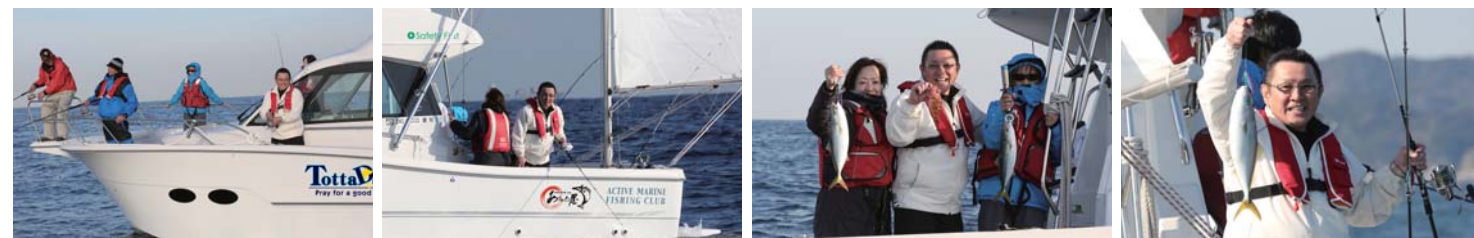
パウデッキは広く仲間との釣りの際にもストレスなく釣りを楽しませてくれるため、ジギングのような激しく動く釣りもスムーズ。オーナー自ら見事ハマチをゲット!!