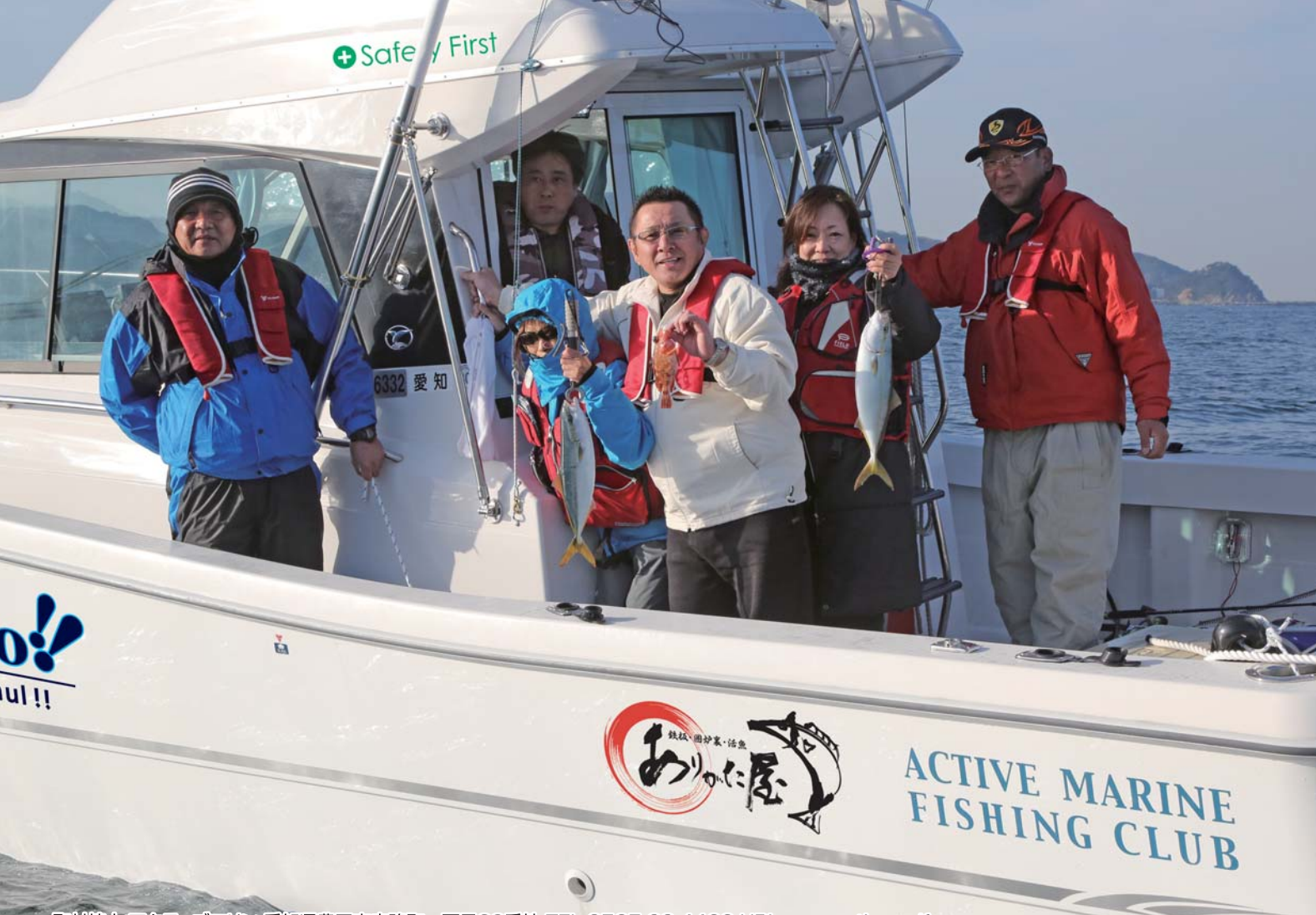
取材協力: アクティブマリン 愛知県豊田市広路町一丁目29番地 TEL 0565-33-4466 URL www.active-golf.com