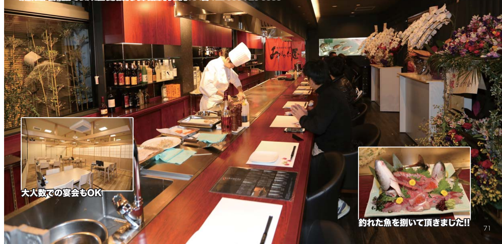
大人数での宴会もOK