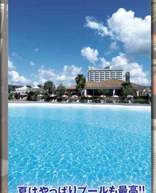
夏はやっぱりプールも最高!!