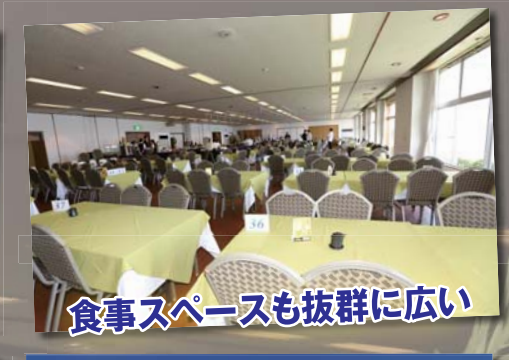
食事スペースも抜群に広い