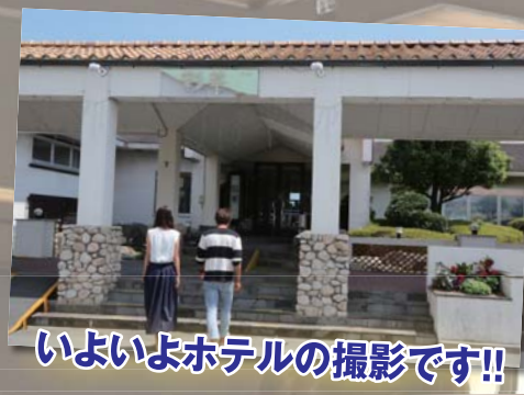
いよいよホテルの撮影です!!

浜名湖レークサイドクラブ 静岡県浜松市北区三ヶ日町下尾奈200 TEL:053-524-1311 URL http://www.h-lsp.com ランチバイキング 11時半~14時 (LO13時半) 大人1,850円 小人1,050 ※小人とは4歳~小学6年生まで ※3歳以下無料。