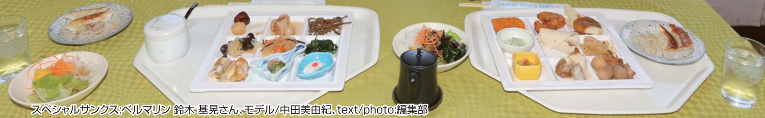
スペシャルサンクス:ベルマリン 鈴木 基晃さん、モデル/中田美由紀、text/photo:編集部