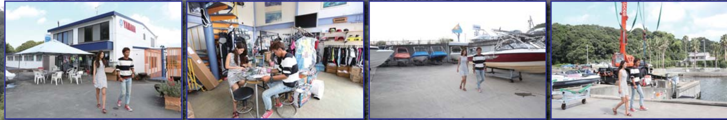
静岡県湖西市利木482 TEL 053-578-3210 URL http://www.bellmarine.co.jp