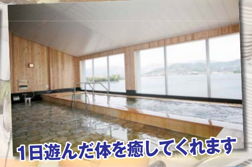
1日遊んだ体を癒してくれます