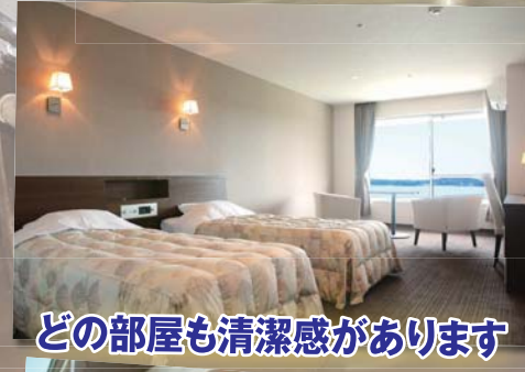
どの部屋も清潔感があります