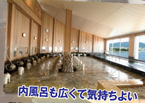
内風呂も広くて気持ちよい