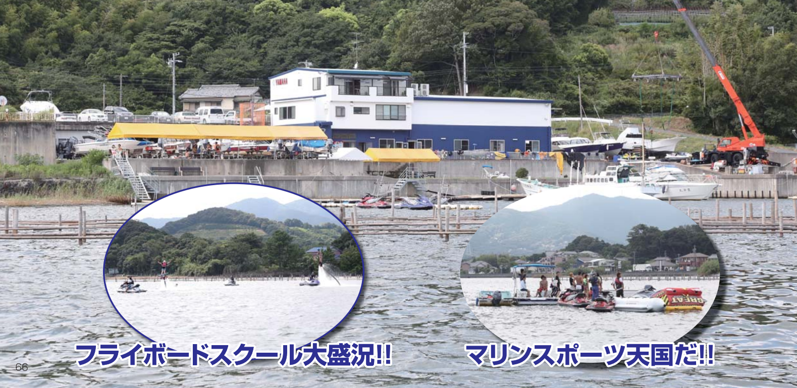
フライボードスクール大盛況!!