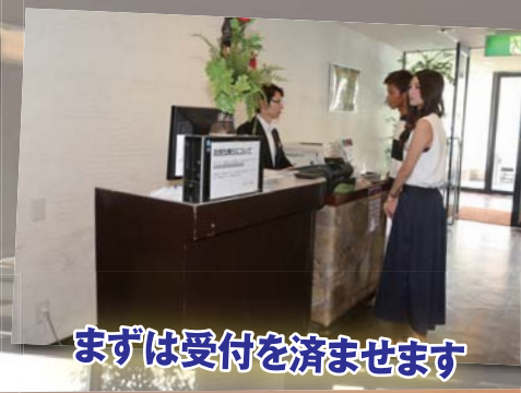
まずは受付を済ませます