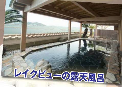
レイクビューの露天風呂