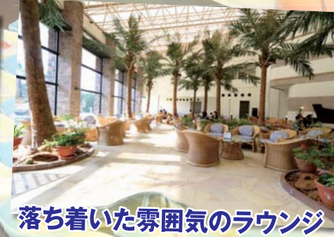
落ち着いた雰囲気のリウンジ