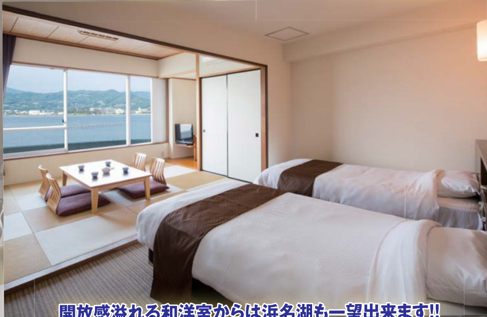
開放感溢れる和洋室からは浜名湖も一望出来ます!!