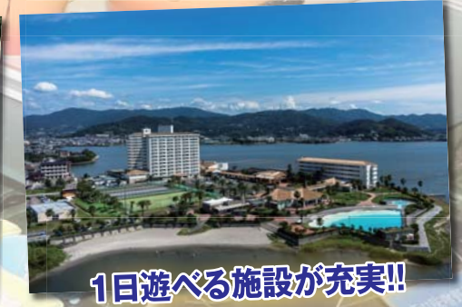
1日遊べる施設が充実!!

して下さい。また、橋を通過してすぐの所にある猪鼻湖神社には近づき過ぎないで下さい。目的地である浜名湖レークサイドプラザへはベルマリンへ帰港後に向かい、ホテルに到着したらまず受付を済ませます。ホテルの外観は綺麗で清潔感のある造りになっており、中のラウンジも高さ、広さともに抜群で開放感たっぷり。足を一步踏み入れれば、休日を通りリゾート施設としては十分なクオリティーが備わっている事が分かって頂けると思います。館内は夏休みという事もあり、沢山の家族連れが訪れ大きな賑わいを見せていました。ここではホテルなので食事はもちろん、宿泊施設や温泉も充実の設備が整えられており、マリンレジャーを楽しみに県外から浜名湖を訪れた人にもお勧め出来るホテルです。また、温泉も清掃の行き届いた綺麗な施設