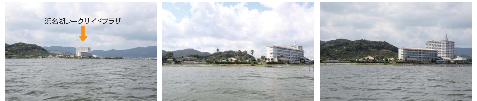
※必ず御自身で海図、GPS、魚探、天気予報等をご確認の上、安全に十分注意してお出かけ下さい。トラブル等発生致しましても当社は一切責任を負いません。