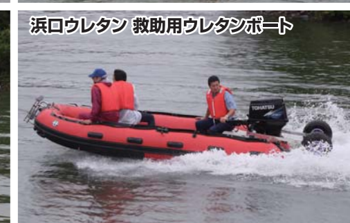
浜口ウレタン 救助用ウレタンボート

7/4日(土)~5(日)静岡県浜松市のボートクラブカナルにて、『はまなこ災害対策展(DIS-RECはまなこ)』が開催された。会場となったボートクラブカナルは世界基準の水陸両用ボート『SEALEGS(シーレグス)』の正規輸入代理店として、これまでに多くのボートユーザーに安全な海の楽しみ方を提案している。イベント当日は、本格的なレスキュービークルを始めとした災害対策に必要な最新のシステムや装備が展示された。中でも会場で大注目を浴びていたシーレグスは試乗の際、陸上ヤードとスロープを自走し、そのままアクセスした海上で軽快な走りを披露した。これには集まった多くの来場者から歓声が上がった。改めて緊急時に迅速な出動が可能で高速走行も可能なこのボートの持つ可能性に注目が集まった形だ。もう一つの水陸両用艇のエアポートはスクルー船では行けない浅瀬や漂流物の浮かぶエリアでも走行出来る高いポテンシャルを発揮。ヤマハ発動機はジェット救難艇を展示し、ジェット推進という特徴をしっかりと来場者に向けてアピールしていた。他にもカロライナスキップは浅瀬での走行性の高さや、荒れた海での安定性の高さをアピールし、スズキやトーハツも積極的にレジャーボートでの人命救助に対する能力をアピールしていた。更には浜口ウレタンのウレタンボートは穴が開いても沈まないボートとして注目を集めていた。陸上展示では救命シェルターや海中探検ギアといった災害時に役立つアイテムの展示も多数行われていた。誰もが予想する事など出来ない災害に対しては、事前に入念な対策を取っておく事が強く求められる。災害が起きた時、さあどうしようでは遅いのだ。