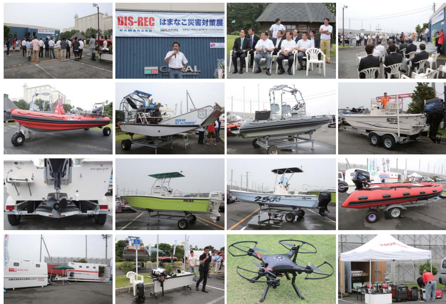
会場となったボートクラブカナルには水陸両用ボートのシーレグスやエアポート、ヤマハのジェット救難艇、スズキ、トーハツ、カロライナスキップ等の展示が行われ、来場者から高い注目を浴びていた。他にも陸上では救命シェルター、海中探検ギアといった展示等も行われ、会場は非常に興味深い展示ばかりであった。