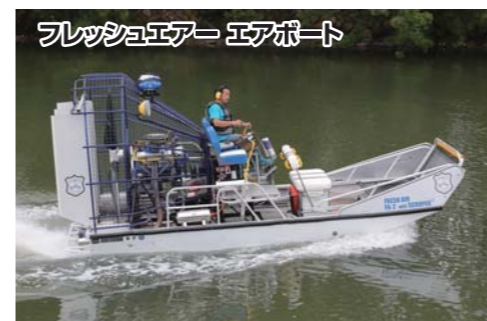
フレッシュエア エアポート