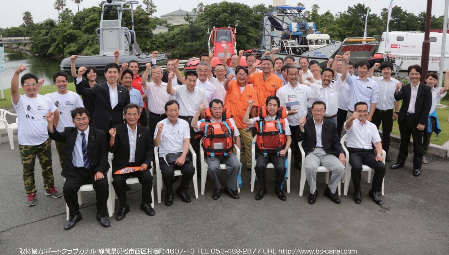
取材協力:ボートクラブカナル 静岡県浜松市西区村瀬町4607-13 TEL 053-489-2877 URL http://www.bc-canal.com