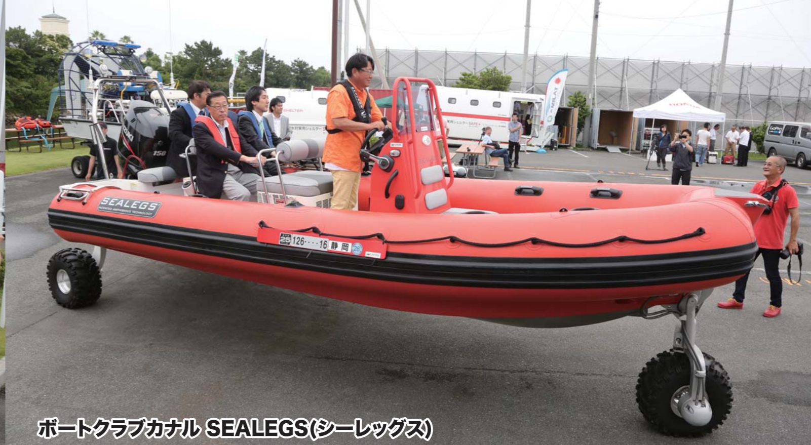
ボートクラブカナル SEALEGS(シーレグス)