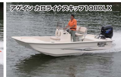
アゲイン カロライナスキップ198DLX