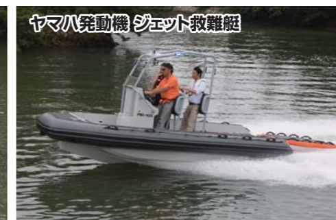
ヤマハ発動機 ジェット救難艇