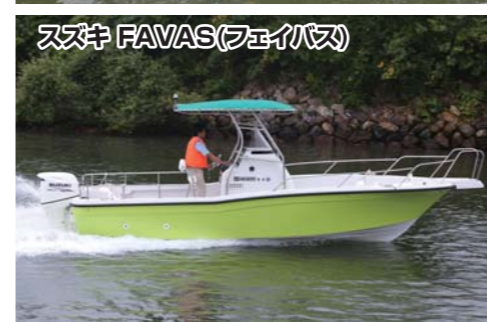
スズキ FAVAS(フェイバス)