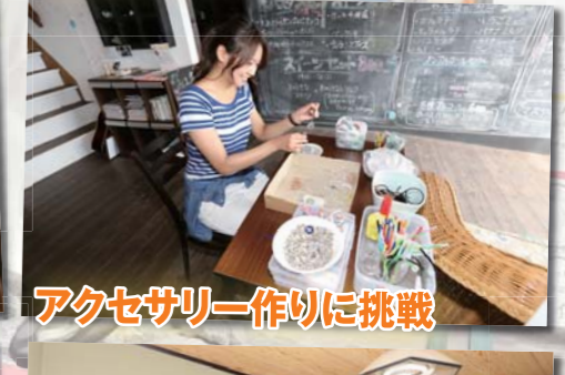
アクセサリ作りに挑戦