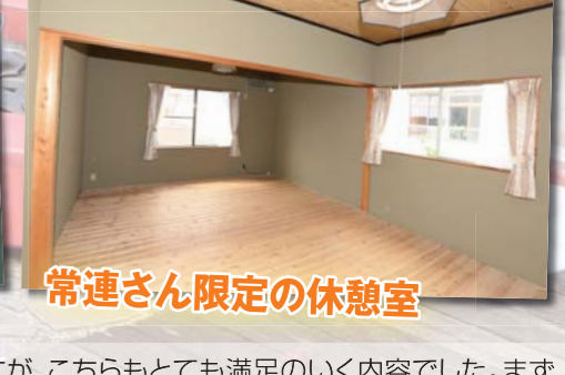
常連さん限定の休憩室

が多くあるのでこちらも近づき過ぎない下さい。今回は佐久島の東港から入港するのですが、緑の灯台の周りも浅いため、入港の際は入港口の両サイドに寄り過ぎず、真ん中を航行するようにして下さい。東港に係留後は歩いて数分の所にお店があるので、徒歩で行く事が出来ます。お店はとても清潔感があって内装もお洒落に拘られています。そして何より若者が中心になっていることもあって、店内は活気に溢れています。接客もとても親しみやすく、がやがやした雰囲気ではなく、とても居心地の良い時間を過ごす事が出来ると思います。席の種類も豊富でBBQの出来るテーブル、店内のカウンター席、グループ席と用途に応じてチョイスも出来るため、比較的柔軟に楽しませてくれるお店だと思います。ちょっとお洒落で友人や恋人に紹介したくなるような遊び心に溢れたお店とも言えるでしょう。そして肝心