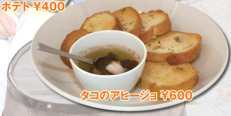
タコのアヒージョ ¥600