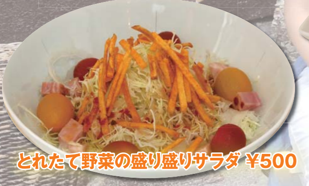
とれたて野菜の盛り盛りサラダ ¥500