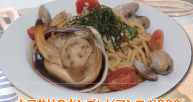
大アサリのボンゴレピアンコ ¥900