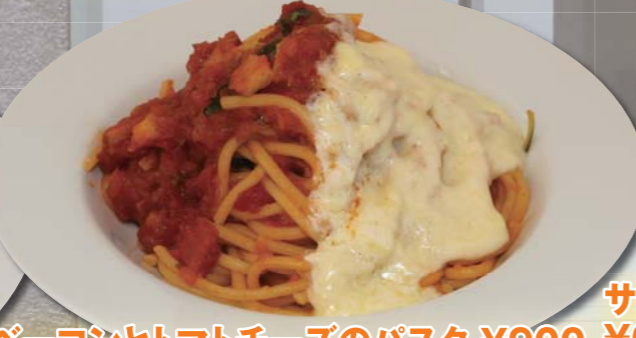
ベーコンとトマトチーズのパスタ ¥900