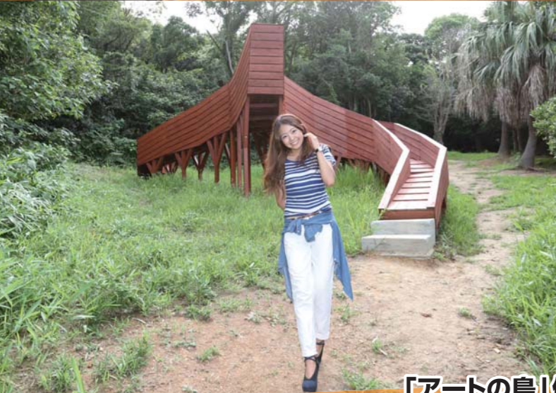
「アートの島」佐久島へ上陸!!

佐久島はアートの島ということもあり、1日掛けて散歩してみるのも面白い。島ではレンタルサイクルも利用出来るので、積極的に利用してみよう。「これカッコイイ!!」と思うような芸術性の高い建物や、島ならではの豊かな自然風景も楽しめます。この夏は仲間と佐久島に出掛けてみよう!!