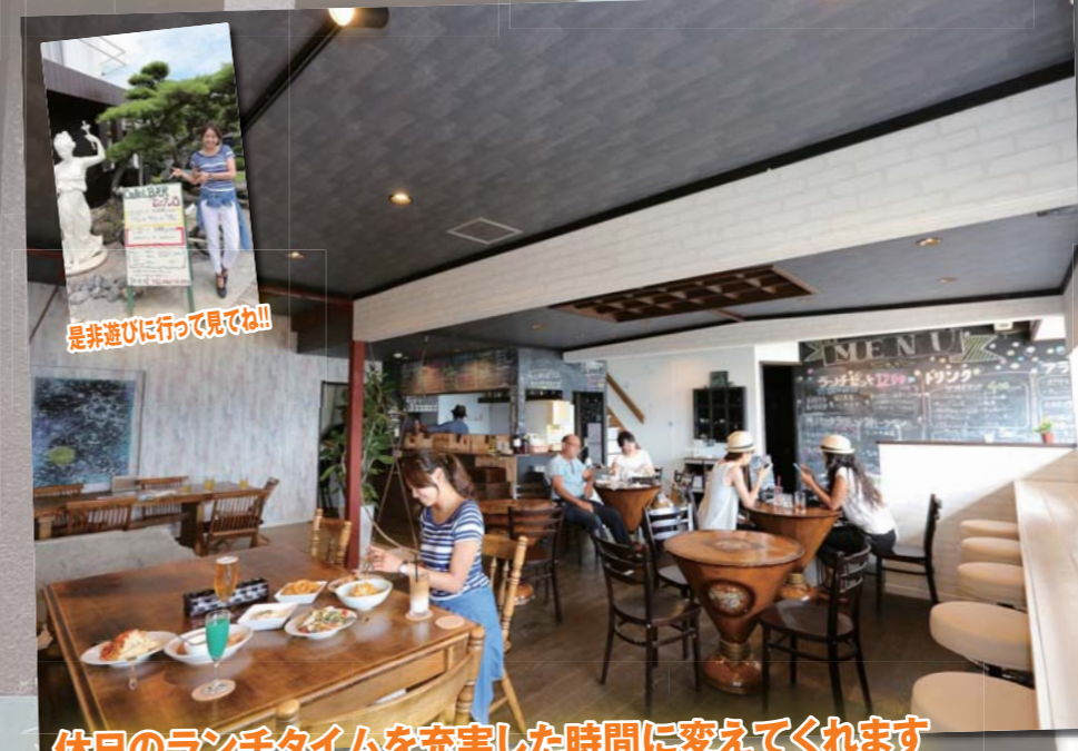
是非遊びに行ってみてね!!