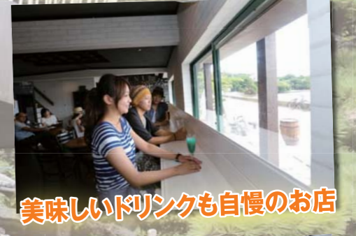
美味しいドリンクも自慢のお店