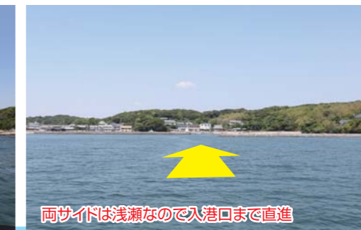
両サイドは浅瀬なので入港口まで直進