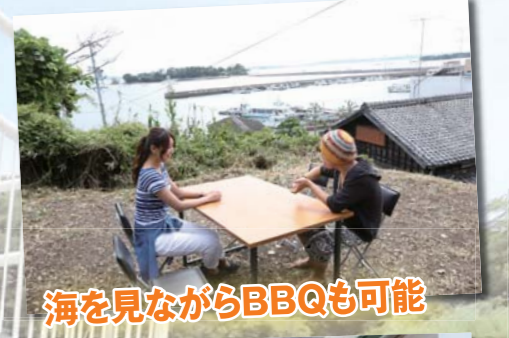
海を見ながらBBQも可能