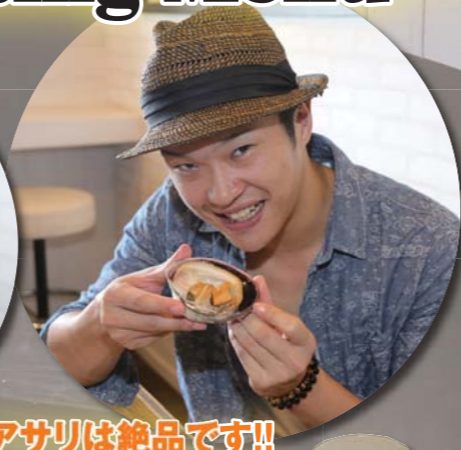
大アサリは絶品です!!