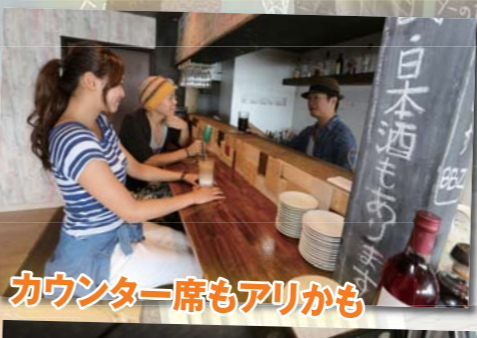
カウンター席もアリかも