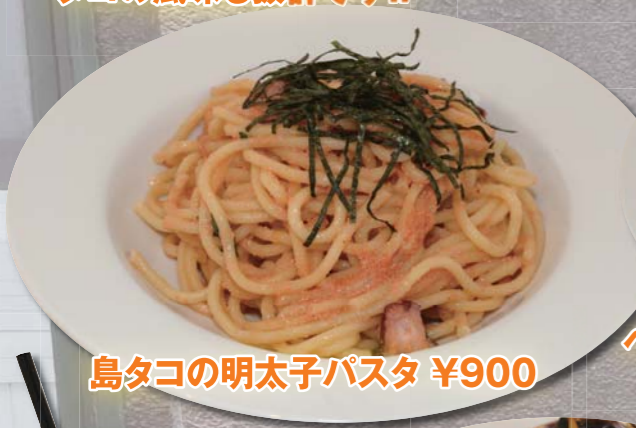
島タコの明太子パスタ ¥900