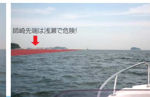
師崎先端は浅瀬で危険!