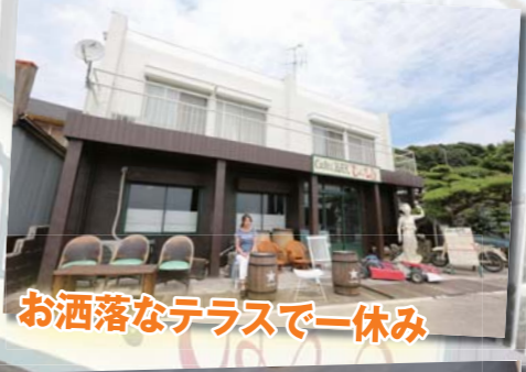
お洒落なテラスで一休み