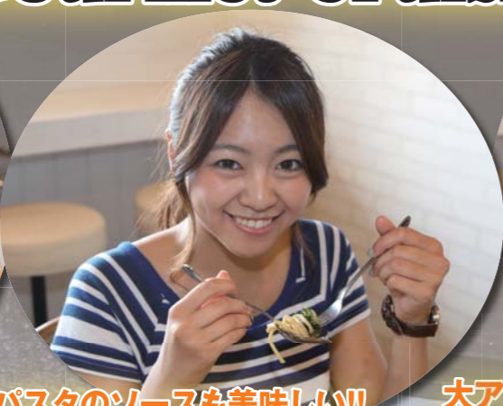
パスタのソースも美味しい!!