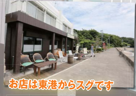
お店は東港からすぐです

Cafe&BAR ひよる Cafe & BAR ひよる 愛知県西尾市一色町佐久島東屋敷37 TEL:0563-78-2014 URL:http://sakushima-atorie.chu.jp 営業時間:10時~18時30分 ランチタイム10:00~14:00 カフェタイム15:00~18:00 ※18時以降は完全予約制 不定休