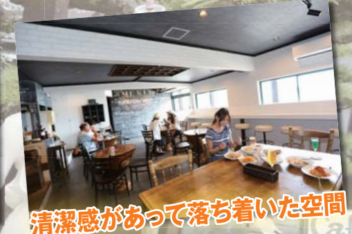
清潔感があって落ち着いた空間