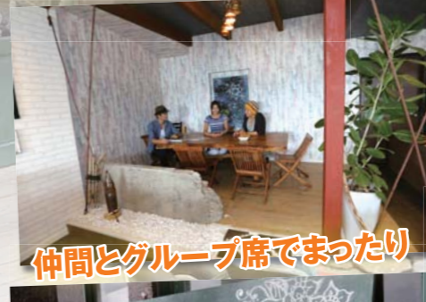
仲間とグループ席でまったり