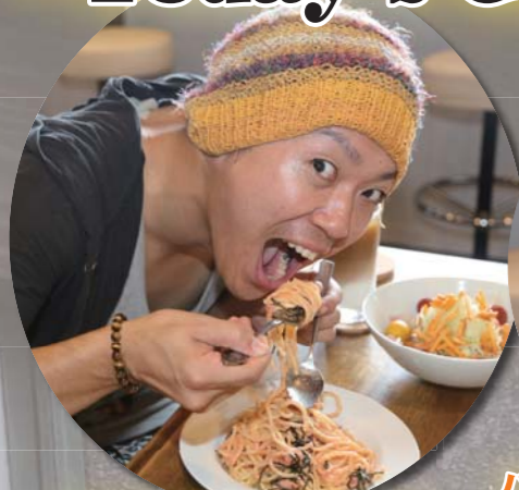
タコの風味も抜群です!!