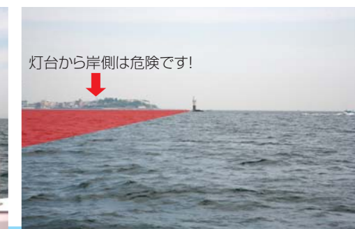
灯台から岸側は危険です!