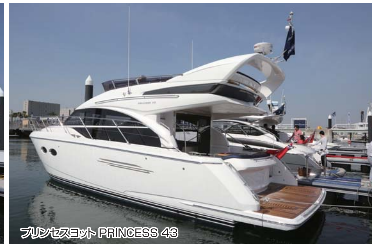
プリンセスヨット PRINCESS 43