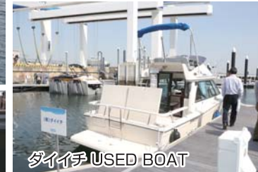
ダイイチ USED BOAT