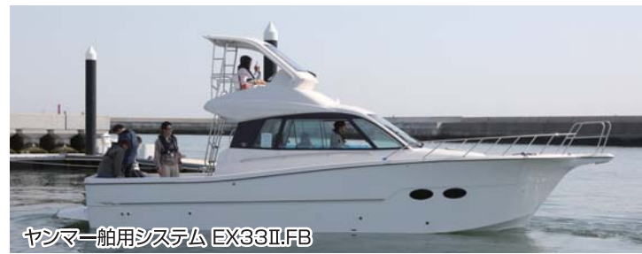
ヤンマー船用システム EX33II/FB

見たボートに一目惚れしてしまうということも十分ありそうだ。それだけ各社が自信を持って展示している魅力溢れるボートが今回のボートショーでは並べられていたように感じた。いよいよゴールデンウィークも過ぎ、これから一気にマリンシーズンに突入する。今年も様々なエリアで各社の人気モデルが活躍する勇姿を見るのが楽しみでならない。