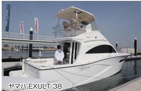
ヤマハ EXULT 38