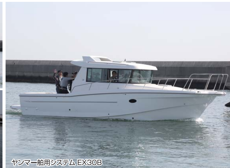
ヤンマー船用システム EX30B