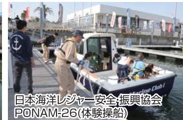
日本海洋レジャー安全・振興協会 PONAM-26(体験操船)