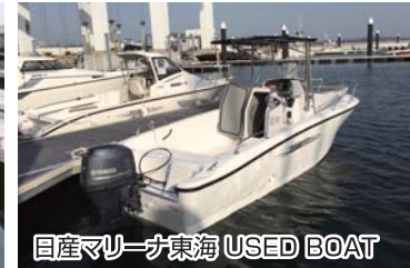
日産マリーナ東海 USED BOAT