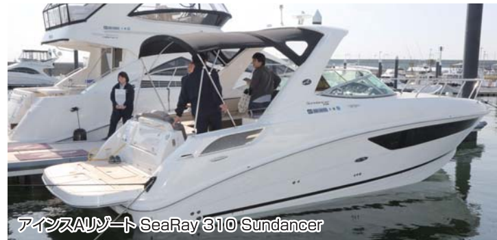
アインスAリゾート SeaRay 310 Sundancer