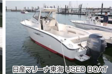
日産マリーナ東海 USED BOAT