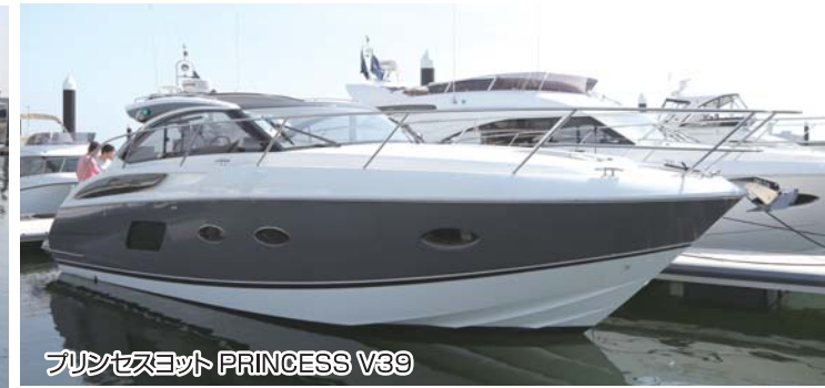
プリンセスヨット PRINCESS V39

れば、海上に展示中のボートならスグに棧橋で見る事も可能だ。今回のボートショーには国内外の人気メーカーが揃って出展しており、雑誌やホームページでしか見たことのないボートを実際に自らの目で見るとも出来た。こうしたイベントでは事前に見るボートを決めて来場したもの、やっぱり生で見るとこっちモデルの方が良いと思ったり、初めて