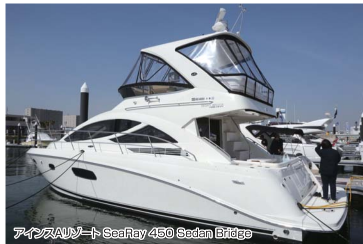
アインスAリゾート SeaRay 450 Sedan Bridge