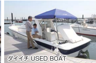
ダイイチ USED BOAT