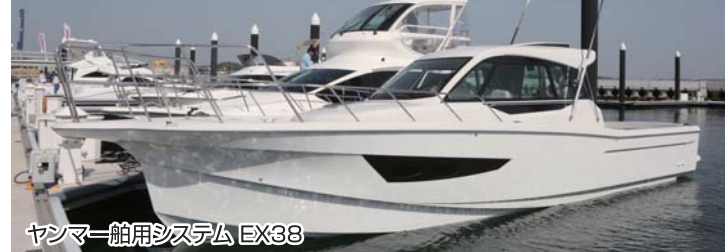
ヤンマー船用システム EX38