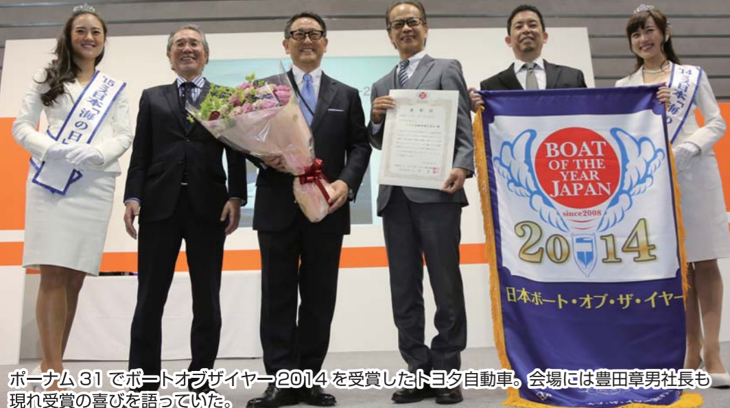
ポーターナム 31 でボートオブザイヤー2014を受賞したトヨタ自動車。会場には豊田章男社長も現れ受賞の喜びを語っていた。

ジャパンインターナショナルボートショー2015 2015年3月5日(木)～8日(日) 10:00～17:00 パシフィコ横浜(屋内展示)