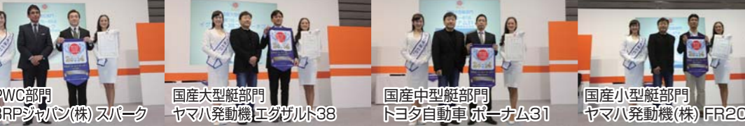
PWC部門 BRPジャパン(株) スパーク 国産大型艇部門 ヤマハ発動機 エグザルト38 国産中型艇部門 トヨタ自動車 ポーターナム31 国産小型艇部門 ヤマハ発動機(株) FR20