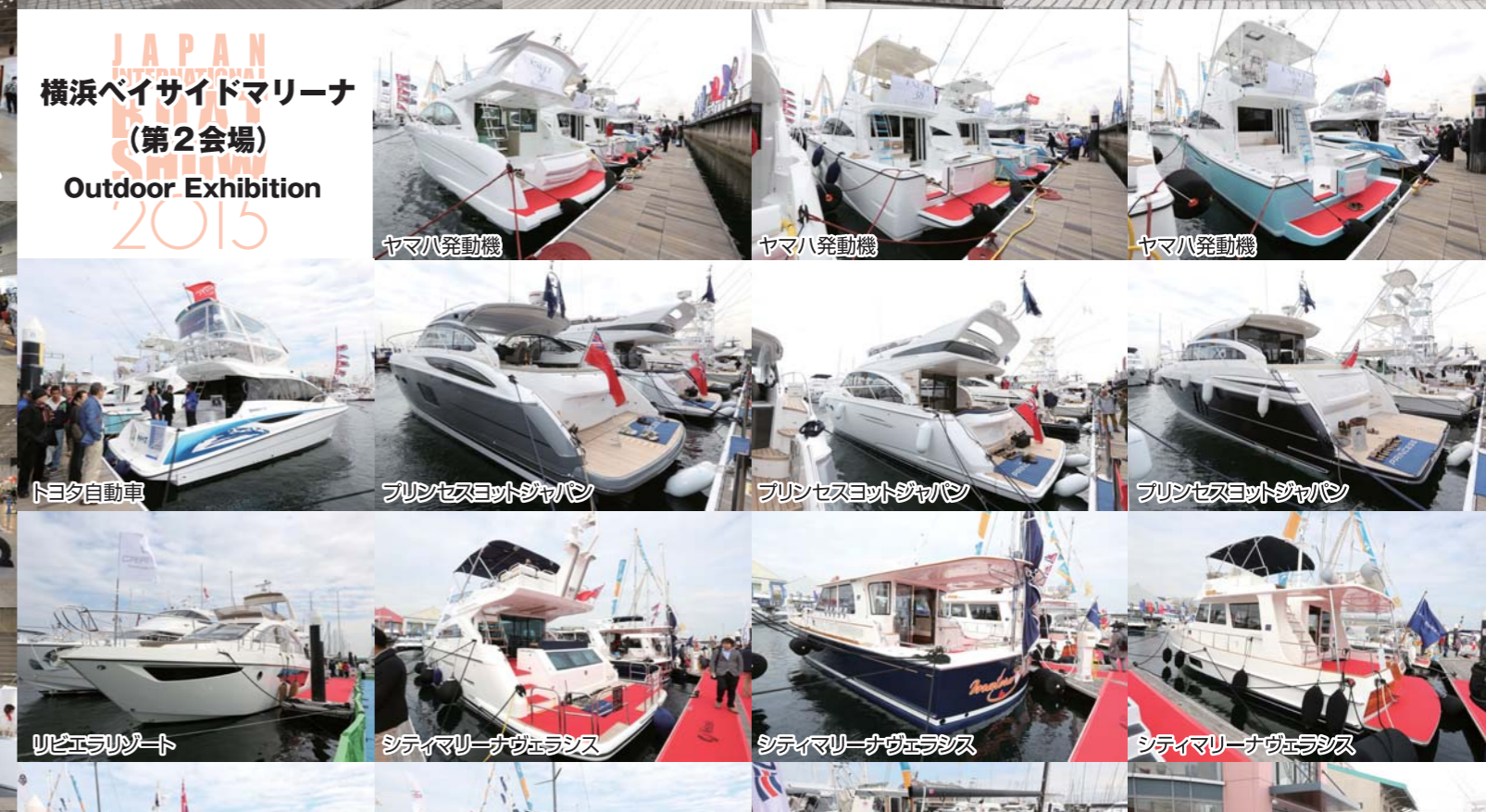
ヤマハ発動機 ヤマハ発動機 ヤマハ発動機 トヨタ自動車 プリンセスヨットジャパン プリンセスヨットジャパン プリンセスヨットジャパン ヲビエラリゾート シティマリーナヴェラシス シティマリーナヴェラシス シティマリーナヴェラシス シティマリーナヴェラシス シティマリーナヴェラシス シティマリーナヴェラシス ムータマリン