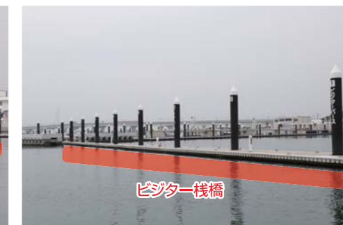
※必ず御自身で海図、GPS、魚探、天気予報等をご確認の上、安全に十分注意してお出かけ下さい。トラブル等発生致しましても当社は一切責任を負いません。