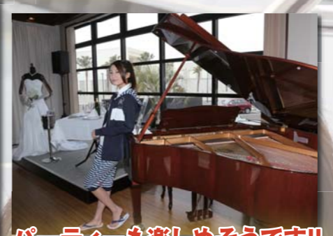
パーティーも楽しめそうです!!