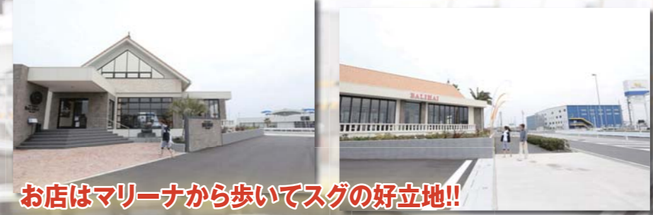
お店はマリーナから歩いてスグの好立地!!

カフェ&レストラン バリハイりんくう店 〒479-0882 愛知県常滑市りんくう町3-10-2 TEL:050-5571-2945 (予約専用) TEL:0569-38-8221 (問合せ専用) URL:http://www.rinku-balihai.jp 営業時間 11:00~22:00 (L.O.21:00) ランチタイム 11:00~15:00 基本的に年中無休。総席数134席