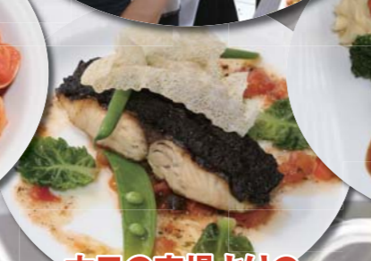
本日の市場よりの お魚料理