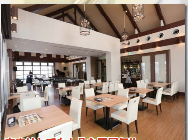
店内はとても上品な雰囲気!!