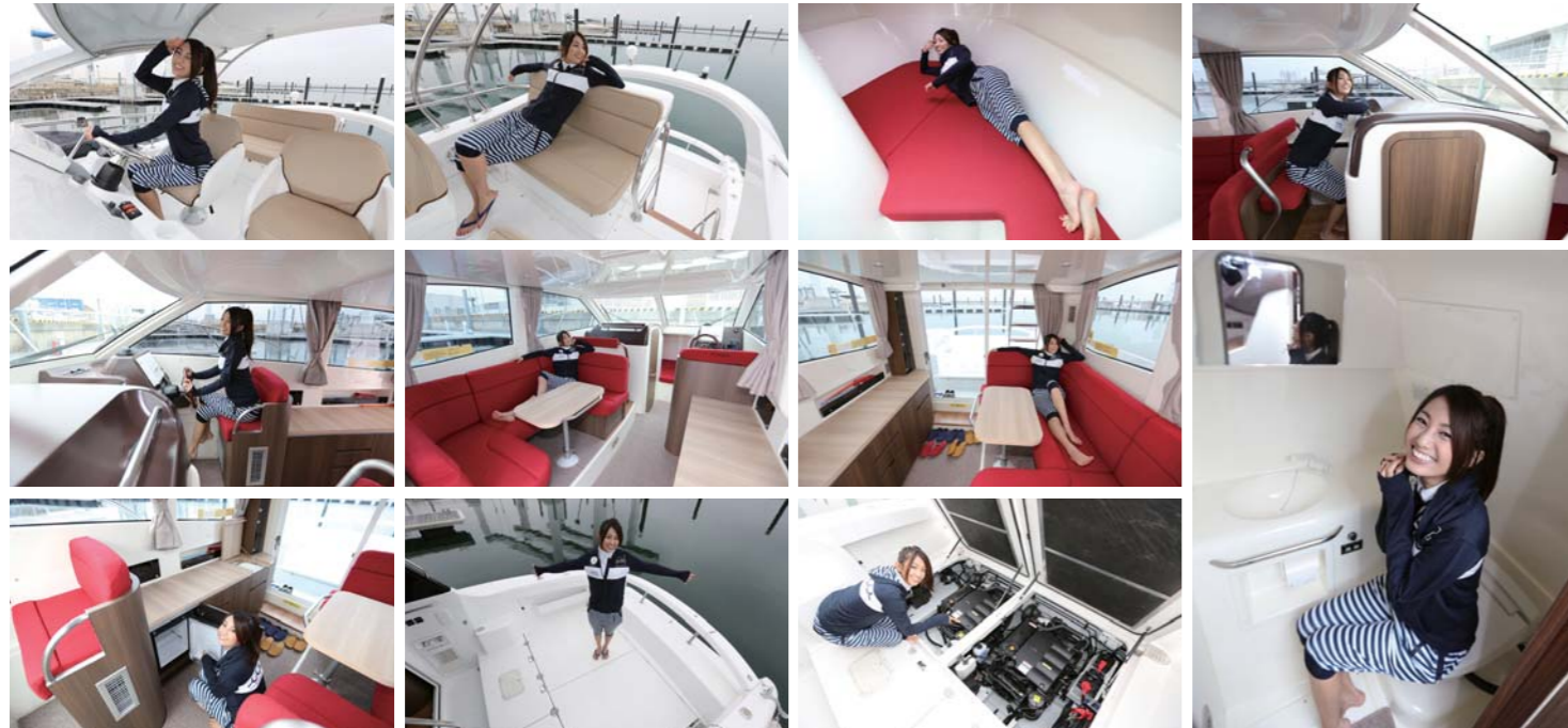
そしてグルメクルージングで使用したボートはトヨタマリンの新型ボート『ボナム-31』。日本ボートオブザイヤー2014を受賞した今大注目のボートです。 取材協力トヨタマリン営業所 愛知県蒲郡市海陽町2丁目1 TEL 0120-532-451 URL www.toyota.co.jp/marine/