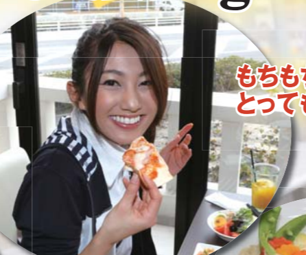
もちもちのピザが とっても美味しい!!