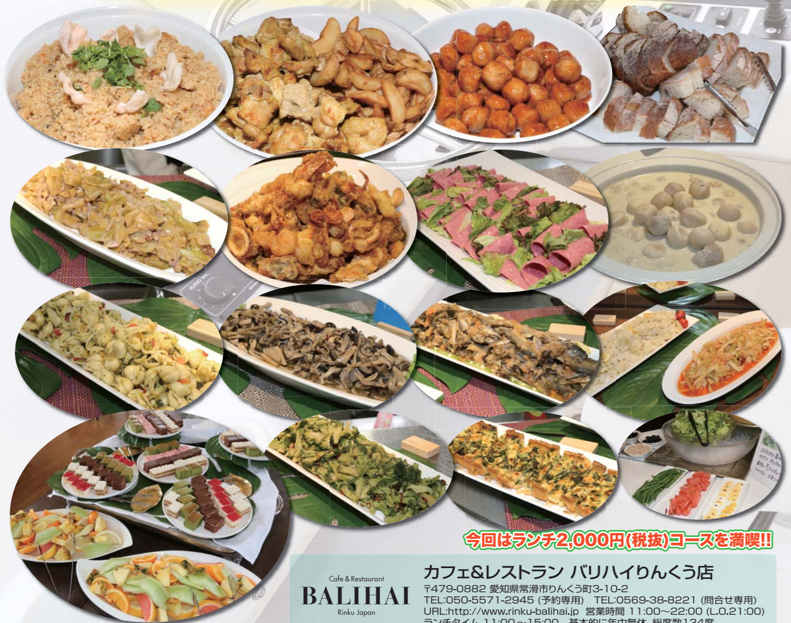
今回はランチ2,000円(税抜)コースを満喫!!

カフェ&レストラン バリハイりんくう店 〒479-0882 愛知県常滑市りんくう町3-10-2 TEL:050-5571-2945 (予約専用) TEL:0569-38-8221 (問合せ専用) URL:http://www.rinku-balihai.jp 営業時間 11:00~22:00 (L.O.21:00) ランチタイム 11:00~15:00 基本的に年中無休。総席数134席