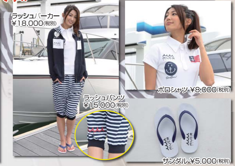
ラッシュパーカー ¥18,000(税別)

muta MARINE 愛知県常滑市りんくう町3-6-1 NTPマリーナりんくう TEL 0569-38-1266 URL www.muta-japan.com/