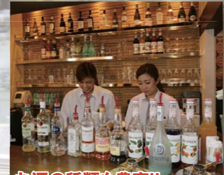
お酒の種類も豊富!!