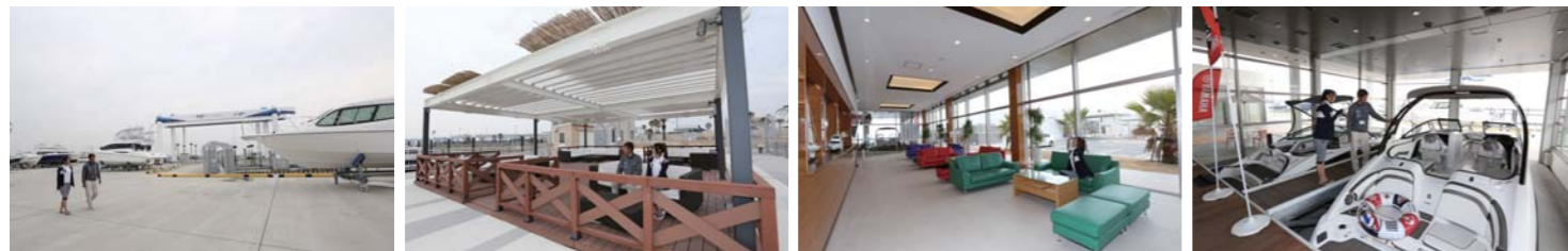
今回は愛知県常滑市のNTPマリーナりんくうがグルメクルージングに登場!!今年の名古屋ポートショー2015の会場にもなっているので、是非行ってみたい!! 取材協力:NTPマリーナりんくう 愛知県常滑市りんくう町3丁目6番地の1 TEL (0569) 35-7200 URL www.ntp.co.jp/marina/