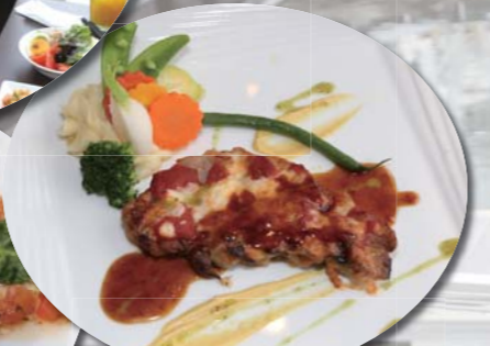
本日のシェフ お勧めお肉料理