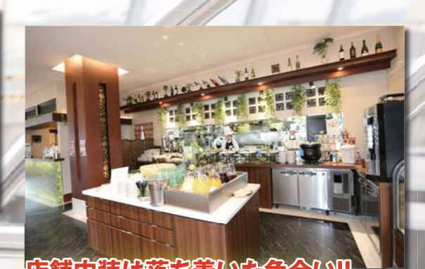
店舗内装は落ち着いた色合い!!