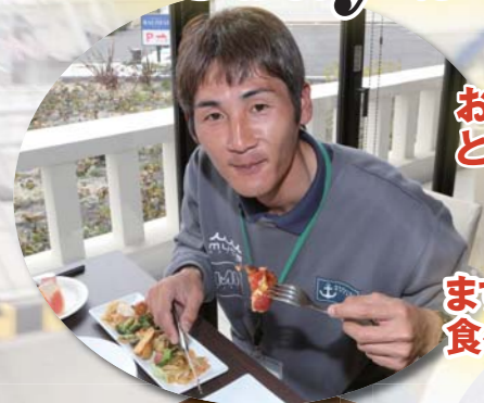
お肉料理は とてもジューシー!!