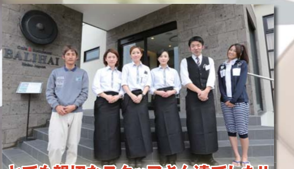
とても親切なスタッフさん達でした!!