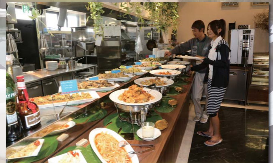
素材に拘られた料理が選びたい放題!! 贅沢な時間です!!