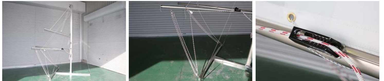
3点でしっかりと支えられ非常に安定した状態で直立しているマスト。操作の際に滑車やロープ止めを使用する事で、大きな力をかけなくてもスムーズに使える。

取材協力 リガーマリンエンジニアリング 三重県いなべ市大安町南金井1732番地 TEL 0594-87-0200 URL http://www.regar.co.jp