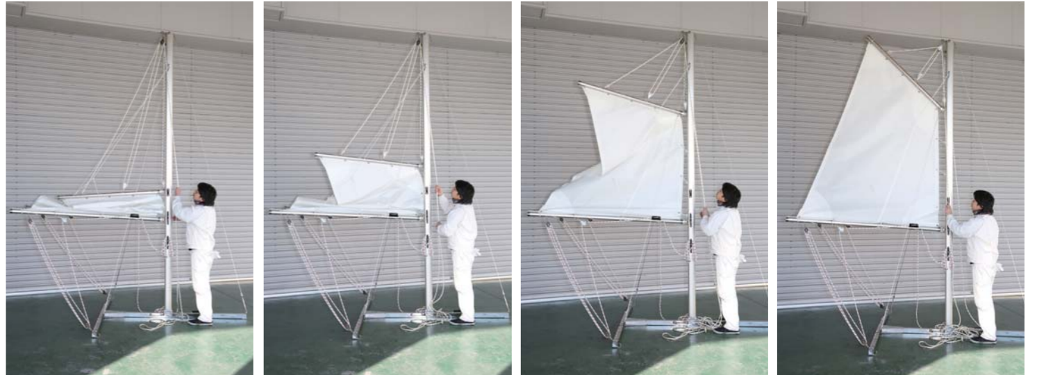
リガーマリン製のスパンカーは非常に操作し易く、セイルを張るまでの流れもスムーズ。また、セイルの取付け位置が変更出来るためセイルの高さも変更出来る。