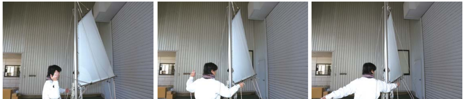
ブームは左右に操作する事が出来て、セイルの向きをその日のコンディションに応じて変える事が出来る。微妙な風の変化にもしっかりと対応してくれるのだ。