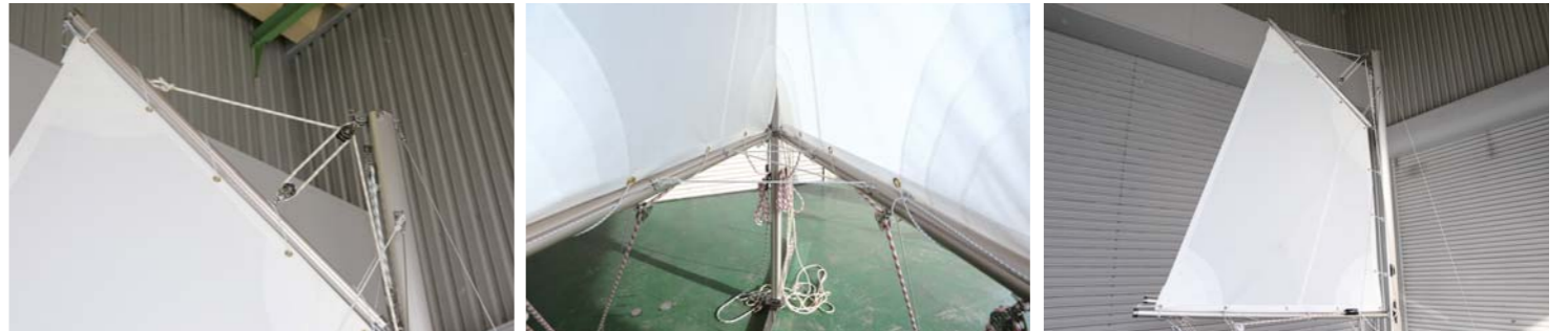
ブームに沿って固定されたセイルは強度も抜群だ。また、カラーもホワイトの他にブルーやブラックも選択可能。他にもネームイラストもオーダーする事が出来る。