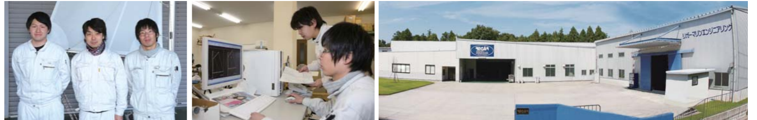
リガーマリンエンジニアリングの作る製品にはメイドインジャパンを誇る高度な技術と物作りに対する熱い思いが込められており、ユーザーからの信頼も厚い。

船を風を立てる。これが釣果に直結するとともに、風を利用した釣りをアングラーに楽しませてくれるのは言うまでもない。そして今回で紹介するリガーマリンエンジニアリングの新型スパンカーは今年スパンカーの装備を検討中のボートオーナーにとってはまさに吉報と言えるだろう。2014年のスパンカーリニューアル後もメーカーとして更なる品質改良を重ね生まれたのが、この新型スパンカーだ。主な特徴は、シンプルで使いやすく、品質が高いということだ。説明すると、煩わしいロープをできる限り減らし、ロープカラーを分けるなど操作方法を明確にした事で格段に操作が楽になっているようだ。また、シンプルが故に細部にこだわり、金具などは自社開発で強固で見た目に美しく、マストやブームなどは全て日本製に切り替え、艶やかで傷が付きにくいのも特徴と言えるだろう。全国のボートユーザーから高い評価を得ているリガーマリンエンジニアリングから今年登場した新型スパンカーは各地のボートショーで見ることが出来るので、是非注目して見て欲しいと思う。